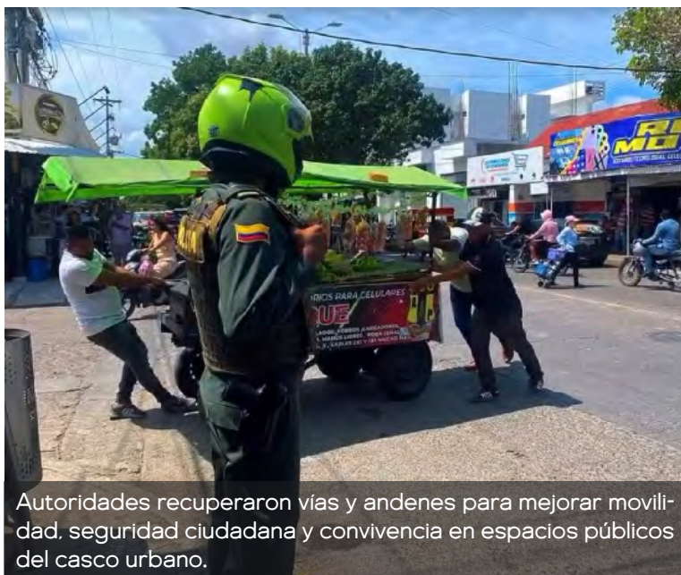
Autoridades recuperaron vías y andenes para mejorar movilidad, seguridad ciudadana y convivencia en espacios públicos del casco urbano.

Desde la administración municipal destacaron que un espacio público despe-