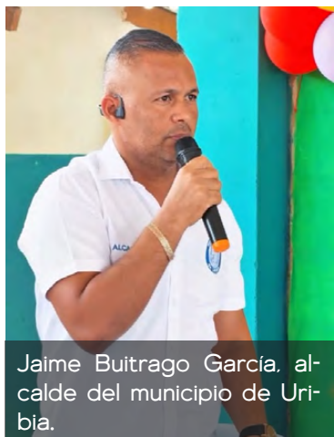
Jaime Buitrago García, alcalde del municipio de Uribia.