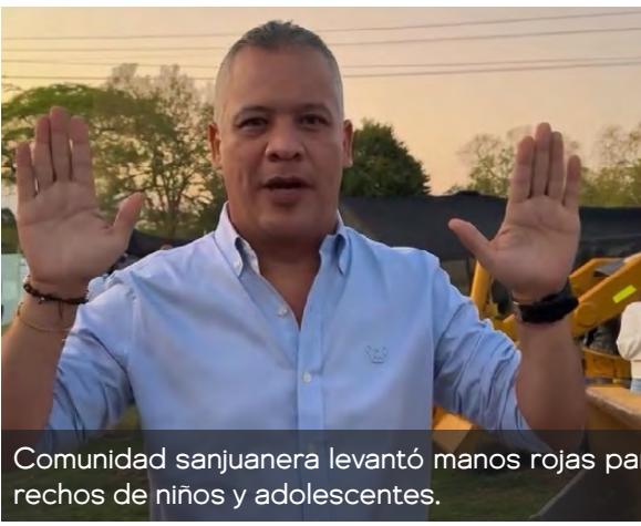
Comunidad sanjuanera levantó manos rojas para rechazar el reclutamiento y defender los derechos de niños y adolescentes.

En el municipio de San Juan del Cesar levantaron la mano roja para decir: ¡Alto ahí! La niñez y la adolescencia no van a la guerra. Este 12 de febrero, la comunidad sanjuanera se sumó a esta acción simbólica en defensa de los derechos de los niños, niñas y adolescentes, enviando un mensaje claro contra el reclutamiento y cualquier forma de violencia que los afecte. “Que nadie sea indife-