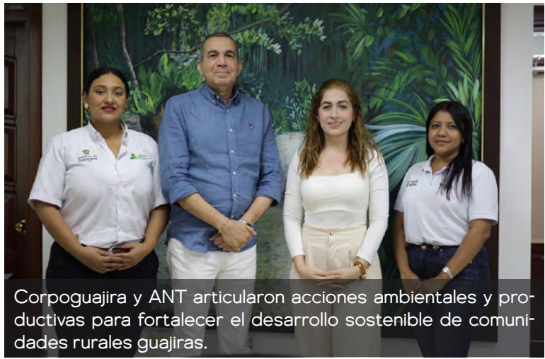
Corpoguajira y ANT articularon acciones ambientales y productivas para fortalecer el desarrollo sostenible de comunidades rurales guajiras.

Guajira de la ANT, quienes reafirmaron su compromiso de trabajar de manera articulada para fortalecer el campo guajiro, promover oportunidades sostenibles y garantizar una gestión responsable del territorio.