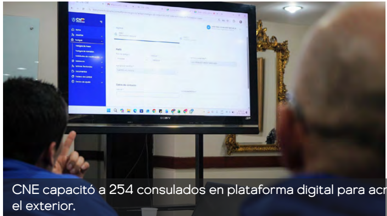
CNE capacitó a 254 consulados en plataforma digital para acreditar actores electorales y fortalecer transparencia del voto en el exterior.