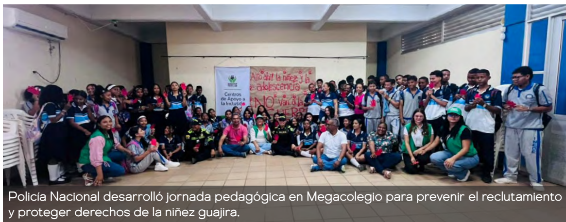
Policía Nacional desarrolló jornada pedagógica en Megacolegio para prevenir el reclutamiento y proteger derechos de la niñez guajira.

Finalmente, la Policía Nacional reiteró el llamado a padres de familia, docentes y comunidad en general a denunciar oportunamente cualquier situación que ponga en riesgo a la niñez y adolescencia, e invitó a seguir sumando esfuerzos por una Guajira donde los niños crezcan libres, protegidos y con oportunidades.