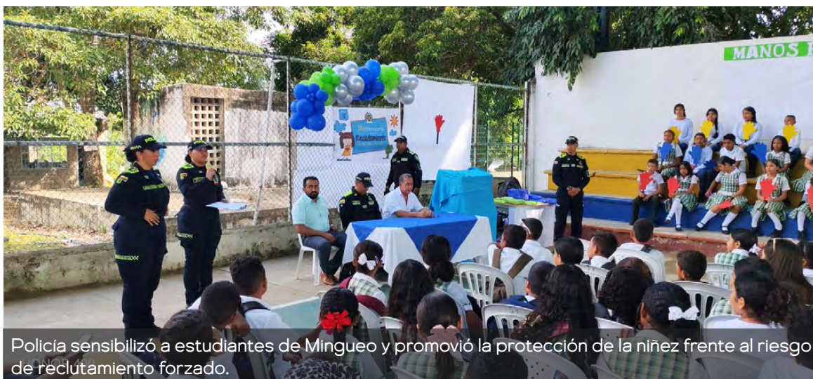
Policía sensibilizó a estudiantes de Mingueo y promovió la protección de la niñez frente al riesgo de reclutamiento forzado.

La actividad fue liderada por la Seccional de Protección y Servicios Especiales, a través del Grupo de Infancia y Adolescencia, en articulación con la Subestación de Policía Mingueo, y se desarrolló en la Institución Educativa Técnica Rural Agropecuaria de Mingueo (INETRAM). En la