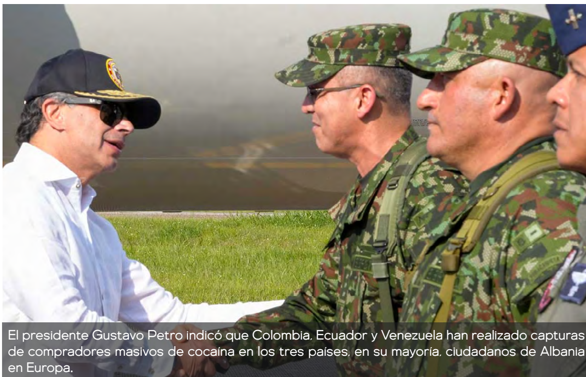
El presidente Gustavo Petro indicó que Colombia, Ecuador y Venezuela han realizado capturas de compradores masivos de cocaína en los tres países, en su mayoría, ciudadanos de Albania en Europa.

De acuerdo con el presidente Petro, por esa época