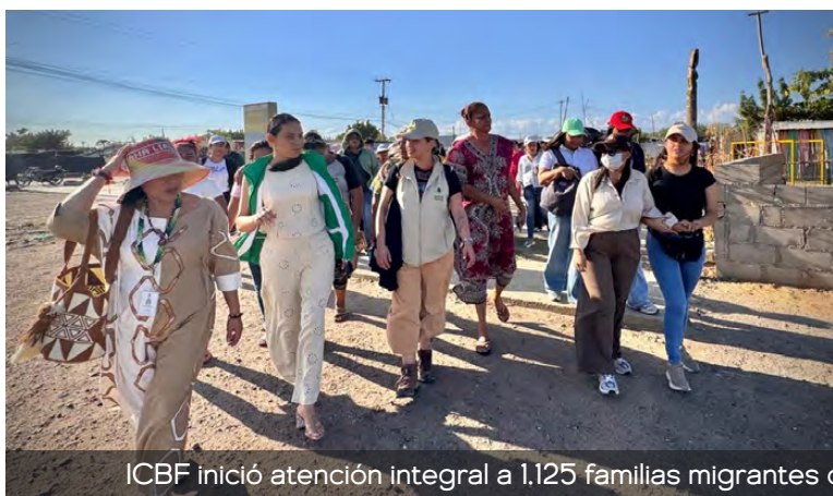
ICBF inició atención integral a 1.125 familias migrantes de La Pista para fortalecer derechos y tejido comunitario.

El asentamiento La Pista es considerado el más grande del departamento de La Guajira. Se trata de un territorio multiétnico y multicultural habitado en su mayoría por población migrante. De acuerdo con estimaciones oficiales, en el sector residen cerca de 13.000 personas, de las cuales aproximadamente 7.000 son niñas y niños, lo que lo convierte en un punto prioritario para la atención integral y la garantía de derechos.