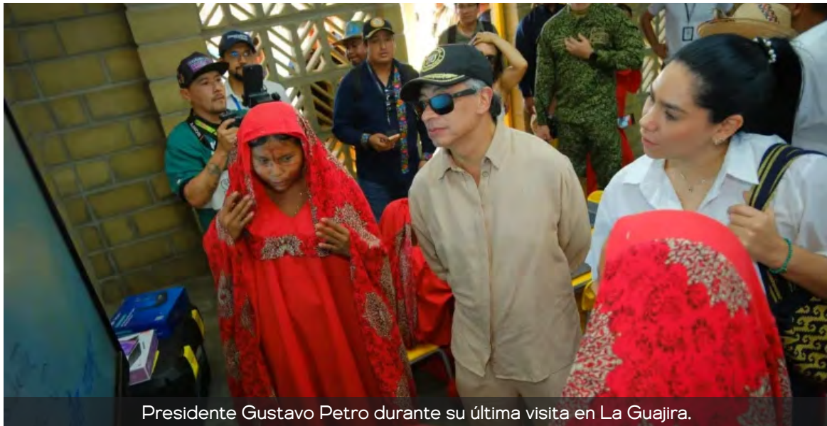
Presidente Gustavo Petro durante su última visita en La Guajira.