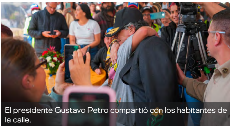
El presidente Gustavo Petro compartió con los habitantes de la calle.

"El arameo y su última letra fue recogido como símbolo por San Francisco de Asís", aseguró, quien, paso seguido, recordó que el santo dijo que "los últi-