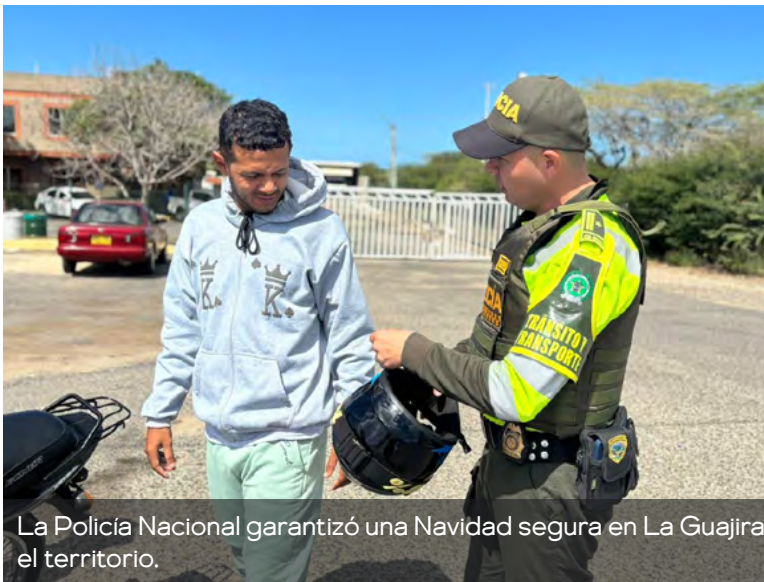
La Policía Nacional garantizó una Navidad segura en La Guajira, con reducción total de homicidios y acciones preventivas en todo el territorio.

En esta fecha se movilizaron 6.720 vehículos por los corredores viales de La Guajira. Se registró un accidente de tránsito, con dos personas lesionadas, lo que representa una reducción en la siniestralidad vial frente al mismo periodo de 2024.