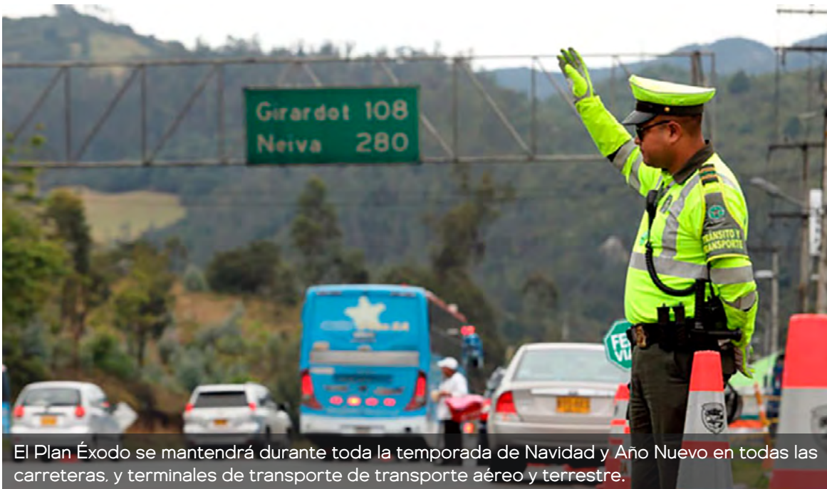
El Plan Éxodo se mantendrá durante toda la temporada de Navidad y Año Nuevo en todas las carreteras, y terminales de transporte de transporte aéreo y terrestre.

"Cuando hablamos de millones de vehículos y mi-