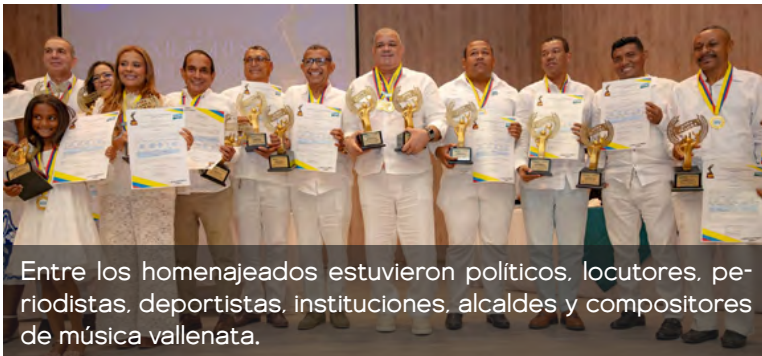
Entre los homenajeados estuvieron políticos, locutores, periodistas, deportistas, instituciones, alcaldes y compositores de música vallenata.

"Todo esto representa la universidad con la que soñamos, esa que busca de manera decidida transformar las condiciones de vida en el departamento de La Guajira y lo hemos logrado con responsabilidad. Muchas familias que no tenían profesionales, hoy cuentan con enfermeras, médicos, arquitectos o nutricionistas en formación. Por eso, ninguno de estos reconocimientos es solo institucional, trasciende a un orgullo y una celebración de todos los guajiros", concluyó el rector.