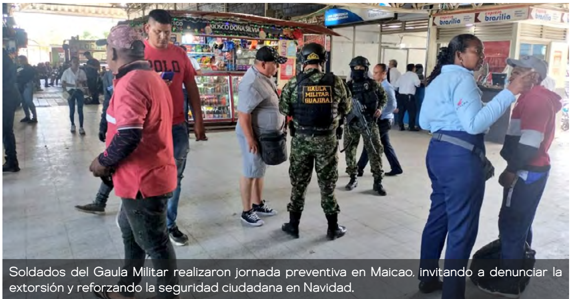
Soldados del Gaula Militar realizaron jornada preventiva en Maicao, invitando a denunciar la extorsión y reforzando la seguridad ciudadana en Navidad.

"Invitamos a la comunidad a denunciar oportunamente cualquier hecho de