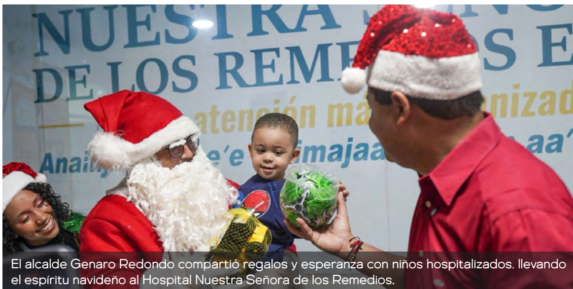
El alcalde Genaro Redondo compartió regalos y esperanza con niños hospitalizados, llevando el espíritu navideño al Hospital Nuestra Señora de los Remedios.

Durante la jornada, se realizó la entrega de regalos y se compartieron momentos de alegría que iluminaron los pasillos del centro asistencial, generando sonrisas y emociones en