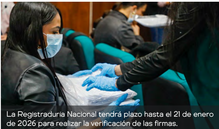
La Registraduría Nacional tendrá plazo hasta el 21 de enero de 2026 para realizar la verificación de las firmas.