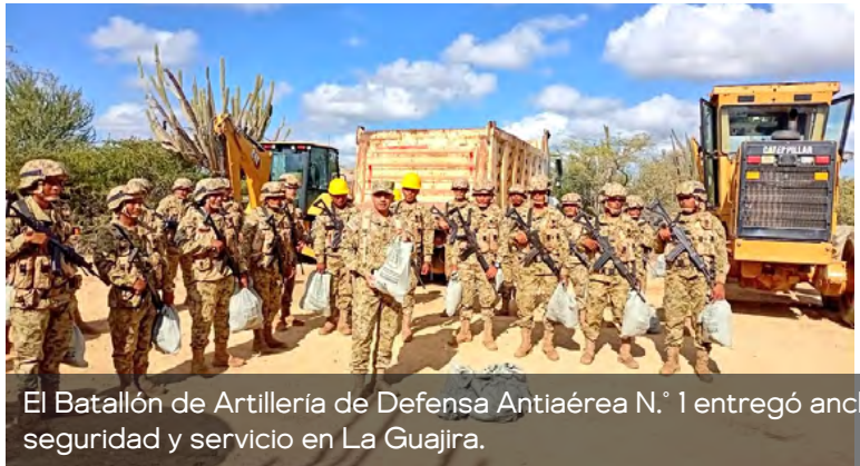
El Batallón de Artillería de Defensa Antiaérea N.º 1 entregó anchetas navideñas a sus soldados, en reconocimiento a su labor de seguridad y servicio en La Guajira.