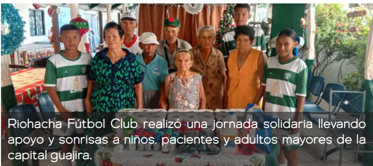
Riohacha Fútbol Club realizó una jornada solidaria llevando apoyo y sonrisas a niños, pacientes y adultos mayores de la capital guajira.

Realizamos esta actividad para que los niños de la escuela fortalezcan valores como el respeto, la solidaridad y el amor por nuestros adultos mayores"