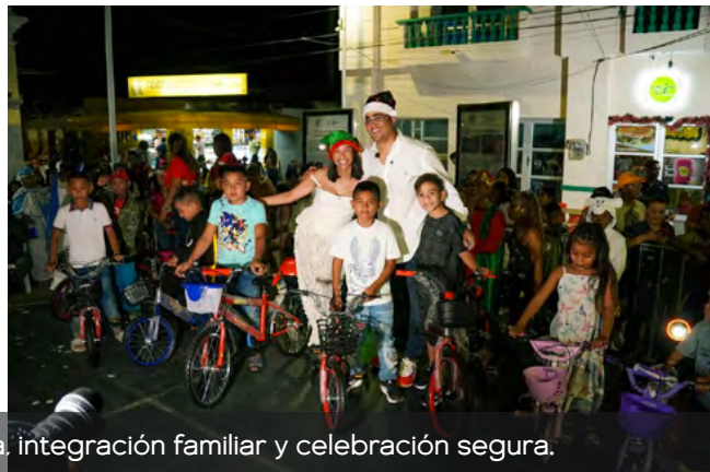
Más de mil familias disfrutaron la Ruta Navideña del Tren de la Magia en Riohacha, uniendo alegría, integración familiar y celebración segura.