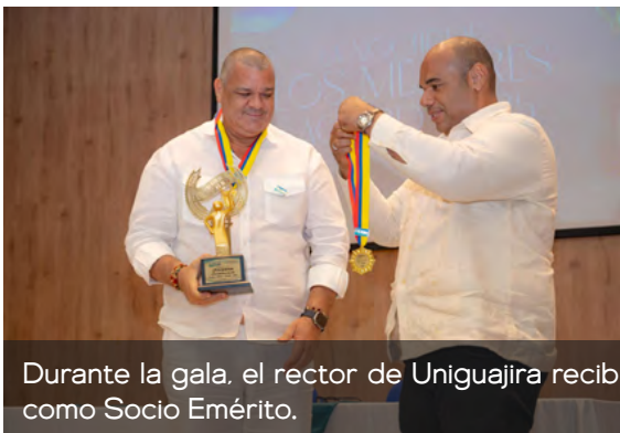
Durante la gala, el rector de Uniguajira recibió dos estatuillas, dos medallas y una credencial como Socio Emérito.

"Estas distinciones son parte de los frutos que recogemos por los esfuerzos realizados en pro