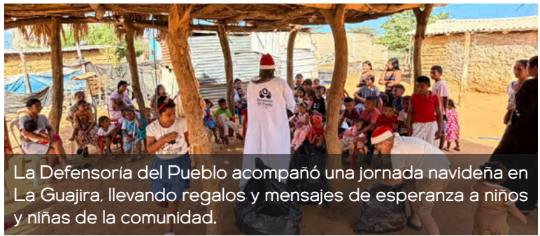
La Defensoría del Pueblo acompañó una jornada navideña en La Guajira, llevando regalos y mensajes de esperanza a niños y niñas de la comunidad.

firma su compromiso con las comunidades guajiras, promoviendo la garantía de los derechos, la empatía, la solidaridad y, sobre todo, el acompañamiento permanente a quienes representan el futuro de la región.