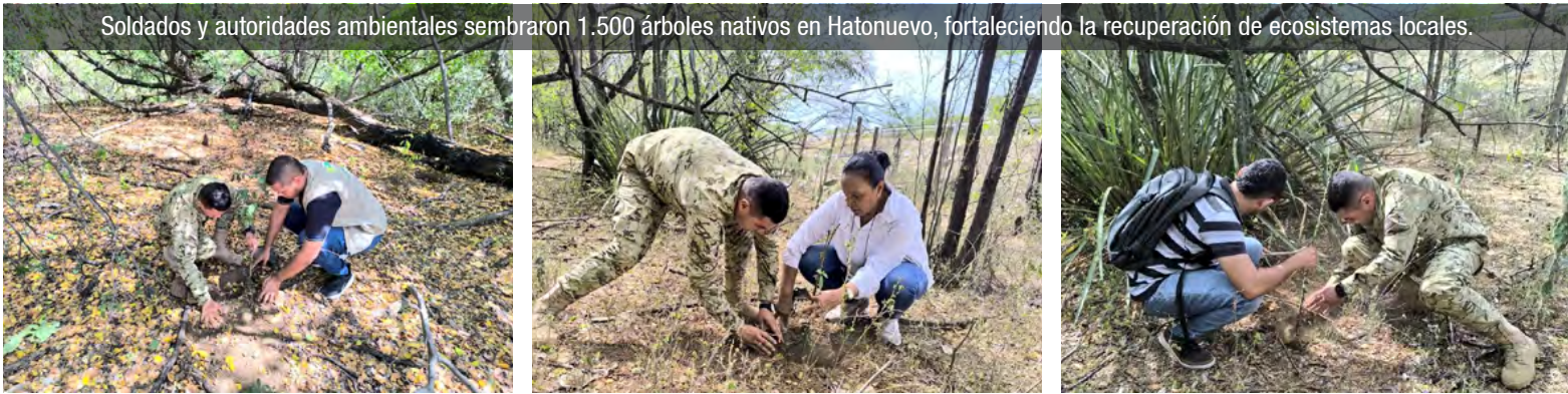
Soldados y autoridades ambientales sembraron 1.500 árboles nativos en Hatonuevo, fortaleciendo la recuperación de ecosistemas locales.

Según informó la Primera División del Ejército, la jornada tuvo lugar en la cuenca del Arroyo Gritador, donde fueron sembrados 1.500 árboles nativos,