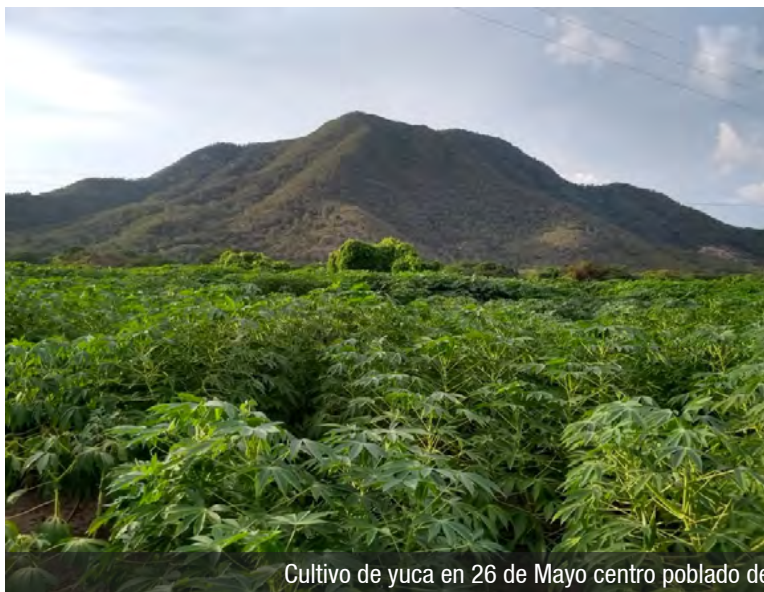
Cultivo de yuca en 26 de Mayo centro poblado de Zambrano municipio de San Juan del Cesar Guajira.

El algodón fue, quizá, el cultivo más emblemático. Llegada la temporada de vacaciones, los campos se cubrían de blanco "como copos de nieve". Las jornadas empezaban de madrugada, cuando las familias