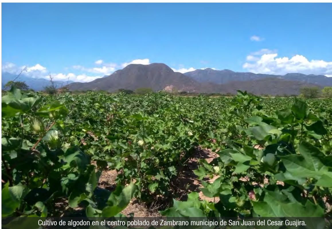
Cultivo de algodón en el centro poblado de Zambrano municipio de San Juan del Cesar Guajira.