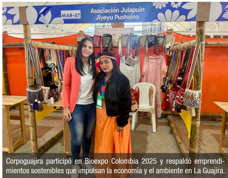
Corpoguajira participó en Bioexpo Colombia 2025 y respaldó emprendimientos sostenibles que impulsan la economía y el ambiente en La Guajira.