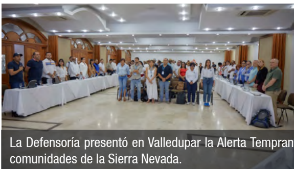
La Defensoría presentó en Valledupar la Alerta Temprana 020 de 2025, destacando la urgencia de proteger a las comunidades de la Sierra Nevada.