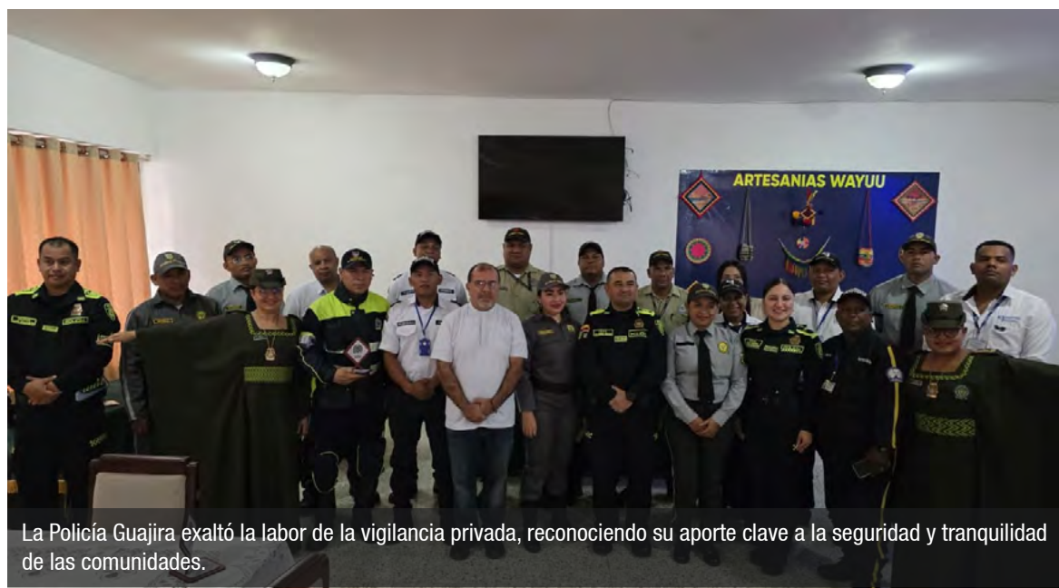
La Policía Guajira exaltó la labor de la vigilancia privada, reconociendo su aporte clave a la seguridad y tranquilidad de las comunidades.

Evento que se desarrolla del 2 al 5 de diciembre en Pasto