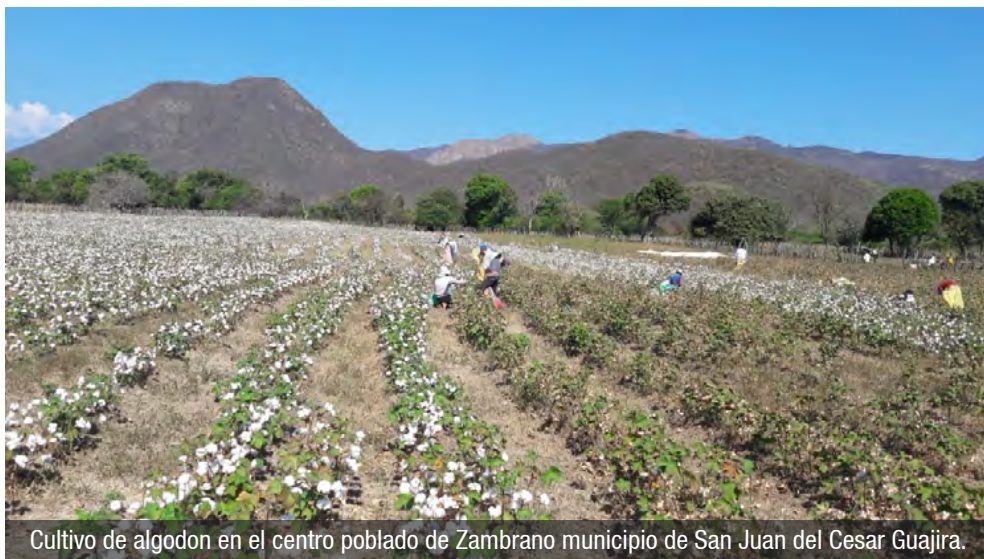
Cultivo de algodón en el centro poblado de Zambrano municipio de San Juan del Cesar Guajira.