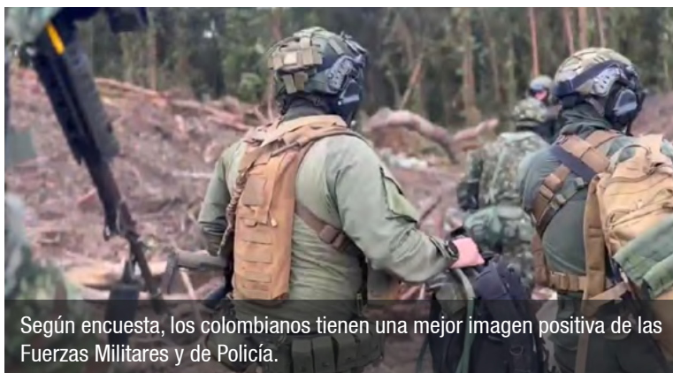
Según encuesta, los colombianos tienen una mejor imagen positiva de las Fuerzas Militares y de Policía.

Para el ministro es claro que esto "es producto del