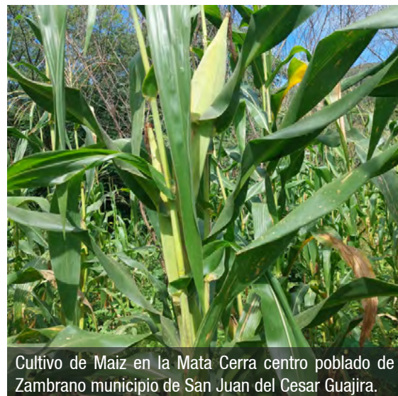
Cultivo de Maiz en la Mata Cerra centro poblado de Zambrano municipio de San Juan del Cesar Guajira.