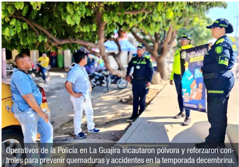
Operativos de la Policía en La Guajira incautaron pólvora y reforzaron controles para prevenir quemaduras y accidentes en la temporada decembrina.

Las autoridades señalaron que estas acciones se enfocan en prevenir casos