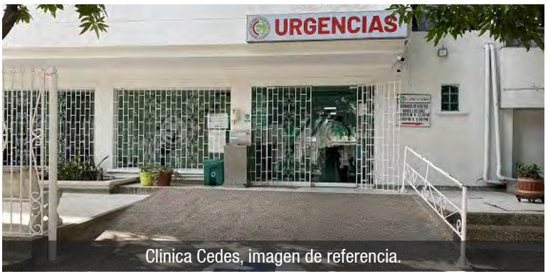
Clínica Cedés, imagen de referencia.

acompañaban no entregaron mayores detalles sobre lo ocurrido ni accedieron inicialmente a explicar las circunstancias en las que la mujer fue trasladada al centro asistencial. Según el reporte, manifestaron que querían llevarse el cuerpo sin que se realizara el procedimiento judicial correspondiente.