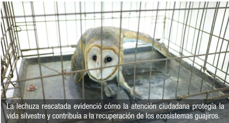
La lechuza rescatada evidenció cómo la atención ciudadana protegía la vida silvestre y contribuía a la recuperación de los ecosistemas guajiros.

El ave fue hallada por trabajadores de la empresa constructora del malecón, quienes notaron que presentaba una herida en una de sus garras. De inmediato, decidieron trasladarla a