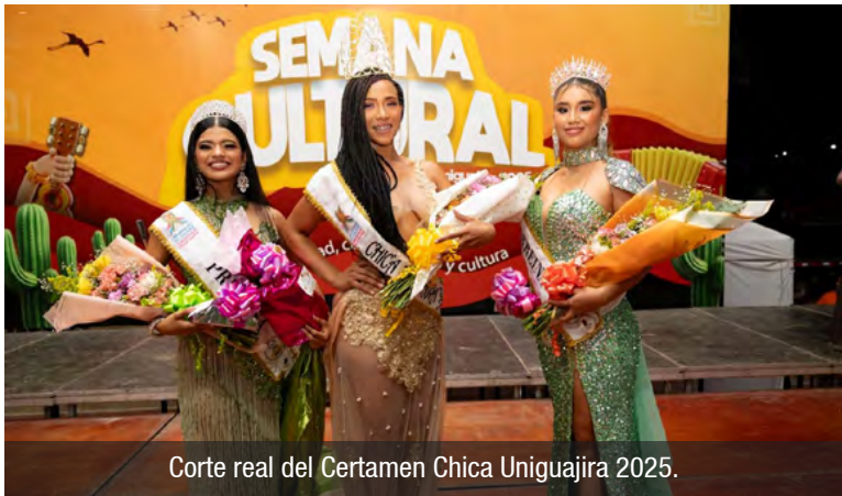
Corte real del Certamen Chica Uniguajira 2025.