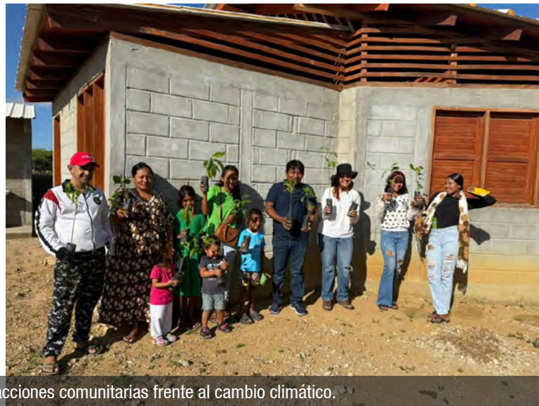
La Cachaca II sembró esperanza junto a Corpoguajira, impulsando conciencia ambiental y acciones comunitarias frente al cambio climático.