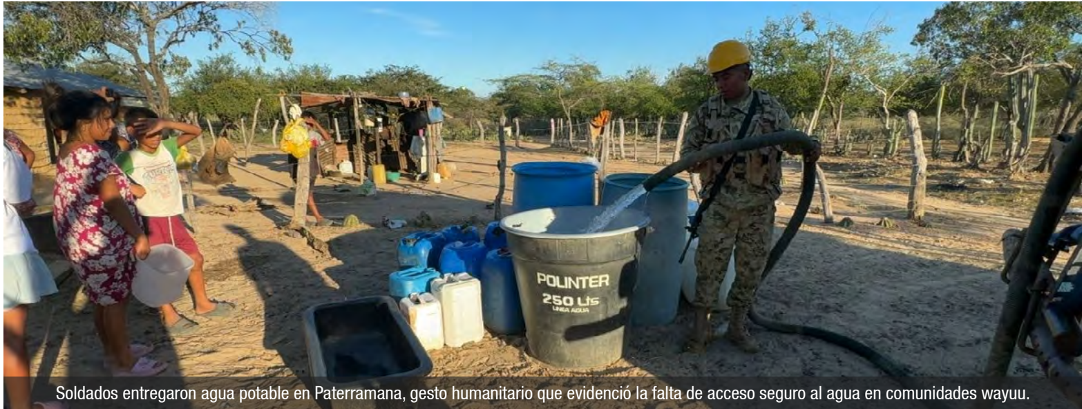
Soldados entregaron agua potable en Paterramana, gesto humanitario que evidenció la falta de acceso seguro al agua en comunidades wayuu.

Con esta labor humanitaria, el Ejército reafirma su compromiso social con las poblaciones indígenas del territorio guajiro.