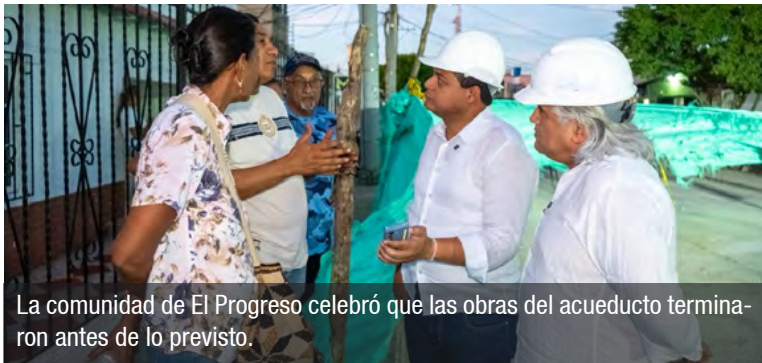
La comunidad de El Progreso celebró que las obras del acueducto terminaron antes de lo previsto.

“Es una pequeña gran victoria, porque ya instala-