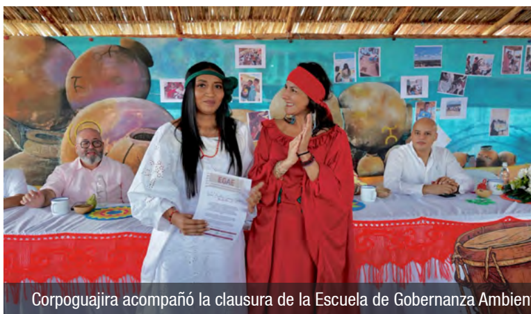
Corpoguajira acompañó la clausura de la Escuela de Gobernanza Ambiental Étnica, fortaleciendo liderazgo Wayúu para una transición energética justa.

Sostenible, en articulación con la Autoridad Nacional de Licencias Ambientales (ANLA), el Ministerio de Minas y Energía, el SENA, la Alcaldía de Uribia, entre otras instituciones.