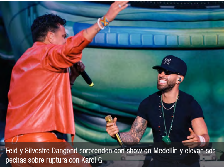
Feid y Silvestre Dangond sorprenden con show en Medellín y elevan sospechas sobre ruptura con Karol G.

La elección de este tema, solicitada expresamente por Feid, fue interpretada por numerosos seguidores como una alusión directa a su situación sentimental con Karol G. La ausencia de la cantante en la inauguración del nuevo negocio de Feid en Medellín también fue motivo de