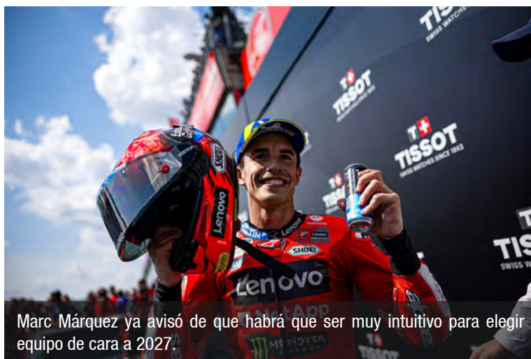
Marc Márquez ya avisó de que habrá que ser muy intuitivo para elegir equipo de cara a 2027.

Algunos no lo están teniendo muy en cuenta, pero la nueva gasolina verde puede ser el factor clave de 2027. Es una tecnología muy poco desarrollada todavía, lo que significa que hay mucha diferencia entre fabricantes. Y se mide en segundos por vuelta. Teniendo en cuenta que cada marca tiene su propio suministrador, tener al más