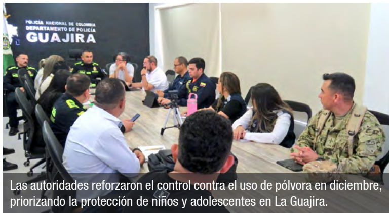
Las autoridades reforzaron el control contra el uso de pólvora en diciembre, priorizando la protección de niños y adolescentes en La Guajira.

La Policía Nacional anunció el fortalecimiento de operativos y estrategias de prevención para garantizar la seguridad y la convivencia ciudadana en el departamento de La Guajira durante el mes de diciembre.