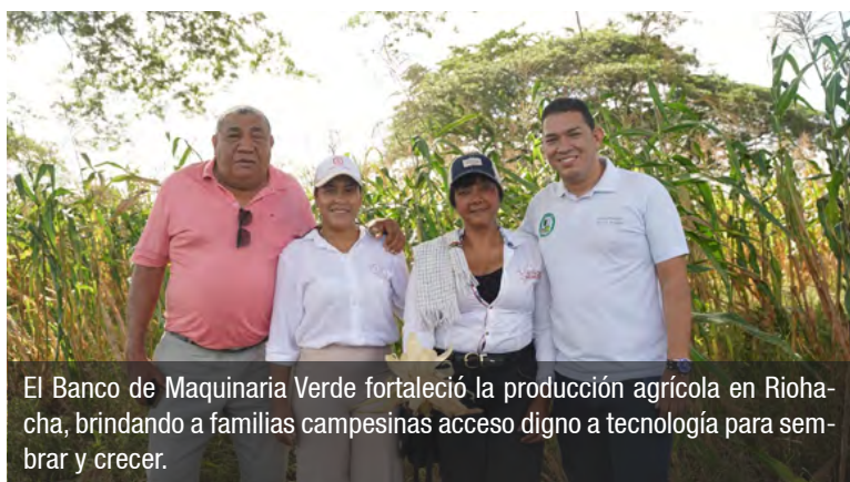
El Banco de Maquinaria Verde fortaleció la producción agrícola en Riohacha, brindando a familias campesinas acceso digno a tecnología para sembrar y crecer.

tores, promoviendo prácticas solidarias y sostenibles.