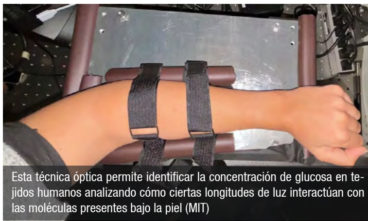
Esta técnica óptica permite identificar la concentración de glucosa en tejidos humanos analizando cómo ciertas longitudes de luz interactúan con las moléculas presentes bajo la piel (MIT)