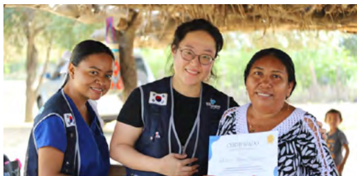
El SENA Regional Guajira certificó a 105 artesanas y artesanos Wayuu en tejido y fortalecimiento productivo, en articulación con la Fundación sureana Cultivo de Amor, impulsando su autonomía económica y la preservación cultural en cinco comunidades del territorio.

Este proceso se llevó a cabo de acuerdo a un memorando de entendimiento suscrito entre ambas entidades, el cual establece fortalecer las capacidades artesanales y empresariales de las mujeres Wayuu y así lograr una mejoría en la calidad de vida y la suficiencia económica de las mujeres. Bajo este propósito, el SENA asumió la operación académica del proceso, brindando espacios de for-