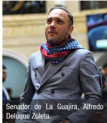
Senador de La Guajira, Alfredo Deluque Zuleta.

y comunidades enteras sin atención primaria, lo que atribuye a falta de gestión