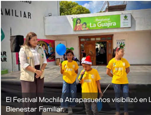
El Festival Mochila Atrapasueños visibilizó en La Guajira los avances culturales y comunitarios de niñas, niños y adolescentes acompañados por Bienestar Familiar.

Durante este periodo, Bienestar Familiar, junto con 29 organizaciones aliadas en los municipios de Dibulla y Fonseca, acompañó a 1.642 niñas, niños y adolescentes en la identificación de riesgos y vulnerabilidades, mientras impulsó sus talentos y habilidades a través de competencias artísticas, musicales, lúdicas y