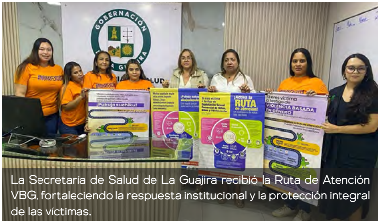
La Secretaría de Salud de La Guajira recibió la Ruta de Atención VBG, fortaleciendo la respuesta institucional y la protección integral de las víctimas.

fundamentales, especialmente de las mujeres y poblaciones en situación de vulnerabilidad, fortaleciendo las políticas públicas orientadas a la prevención y atención de la violencia basada en género.