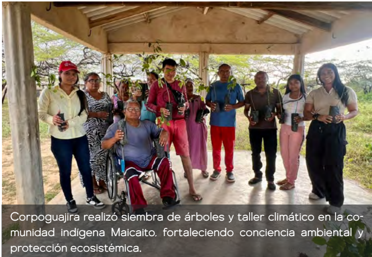
Corpoguajira realizó siembra de árboles y taller climático en la comunidad indígena Maicaito, fortaleciendo conciencia ambiental y protección ecosistémica.

contribuyendo a la preservación de la biodiversidad y a la recuperación de áreas verdes.