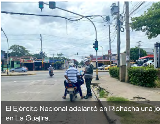
El Ejército Nacional adelantó en Riohacha una jornada de sensibilización para prevenir el reclutamiento forzado de niños, niñas y adolescentes en La Guajira.

La información fue proporcionada por la Primera División del Ejército Nacional, que continúa liderando estas estrategias para garantizar la seguridad de los guajiros.