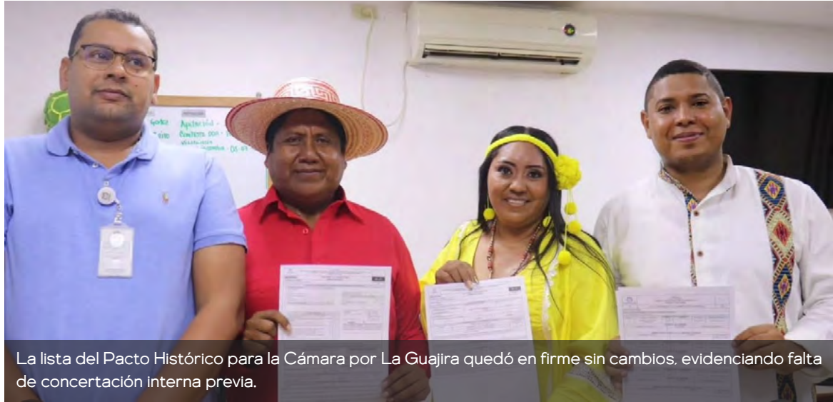
La lista del Pacto Histórico para la Cámara por La Guajira quedó en firme sin cambios, evidenciando falta de concertación interna previa.

mento, existía la posibilidad de fortalecer la propuesta mediante un proceso de mayor concertación interna, que permitiera consolidar apoyos alrededor de uno o dos nombres con mayor opción electoral. Sin embargo, esa alternativa no se materializó.