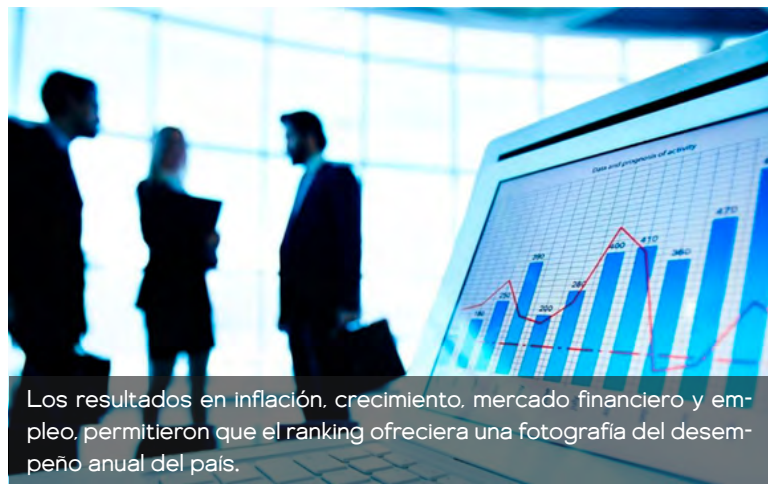
Los resultados en inflación, crecimiento, mercado financiero y empleo, permitieron que el ranking ofreciera una fotografía del desempeño anual del país.

El ranking también tiene en cuenta el empleo. No se trata solo de crecer, sino de hacerlo sin destruir puestos de trabajo. Colombia no aparece entre los países con deterioro grave del mercado laboral, lo que indica que el crecien-