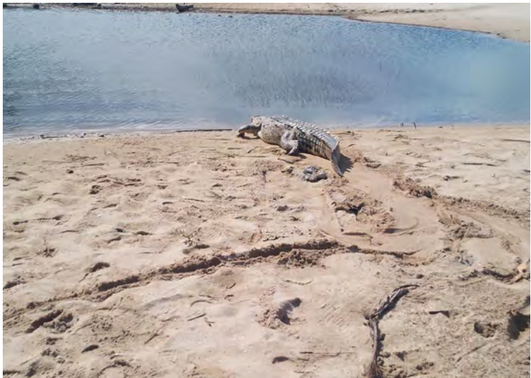
Corpoguajira reubicó de forma segura un caimán aguja en Mingueo, protegiendo a la comunidad y preservando el equilibrio ecológico del río Cañas.