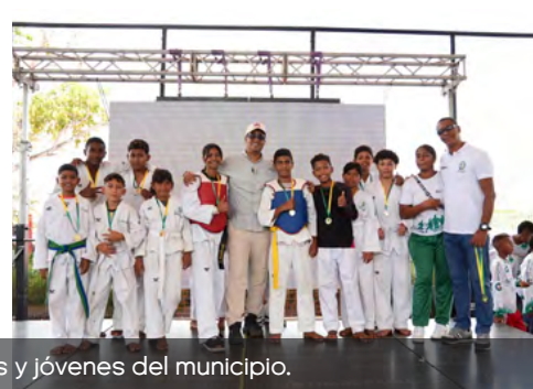
El programa Tu Oportunidad Deportiva cerró en Dibulla fortaleciendo la formación integral de cerca de 2.000 niños y jóvenes del municipio.

Con exhibiciones deportivas, actividades recreativas y muestras culturales, niños, niñas y jóvenes fueron los protagonistas del acto de clausura del programa “Tu Oportunidad Deportiva”, realizado en el Centro Deportivo Cuatro Veredas del municipio de Dibulla, donde se evidenció el proceso formativo desarrollado durante varios meses.