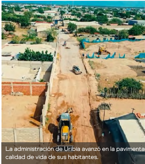
La administración de Uribia avanzó en la pavimentación del barrio La Invasión, mejorando la movilidad y la calidad de vida de sus habitantes.