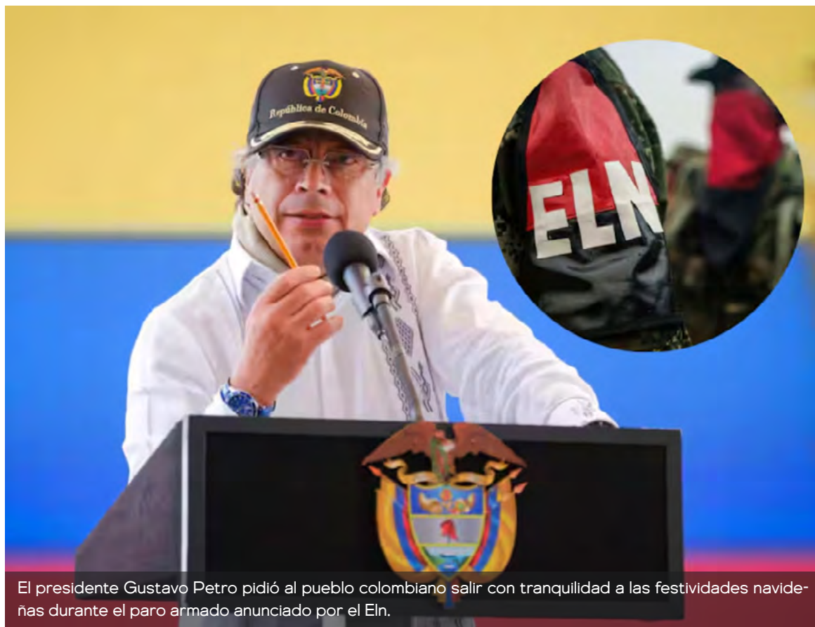
El presidente Gustavo Petro pidió al pueblo colombiano salir con tranquilidad a las festividades navideñas durante el paro armado anunciado por el Eln.

En su declaración, el mandatario señaló que el ELN "nunca entendió que lo más revolucionario que podía hacer era juntar en la práctica el amor eficaz de Camilo Torres Restrepo con la paz del país", y agregó que la organización no comprendió que "ascen-