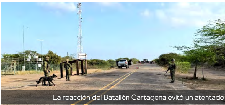
La reacción del Batallón Cartagena evitó un atentado del ELN en Cuatro Vías y reforzó la seguridad en Maicao.

División informó que estos peligrosos elementos fueron hallados y asegurados de manera inmediata, tras el respectivo registro y control del área.