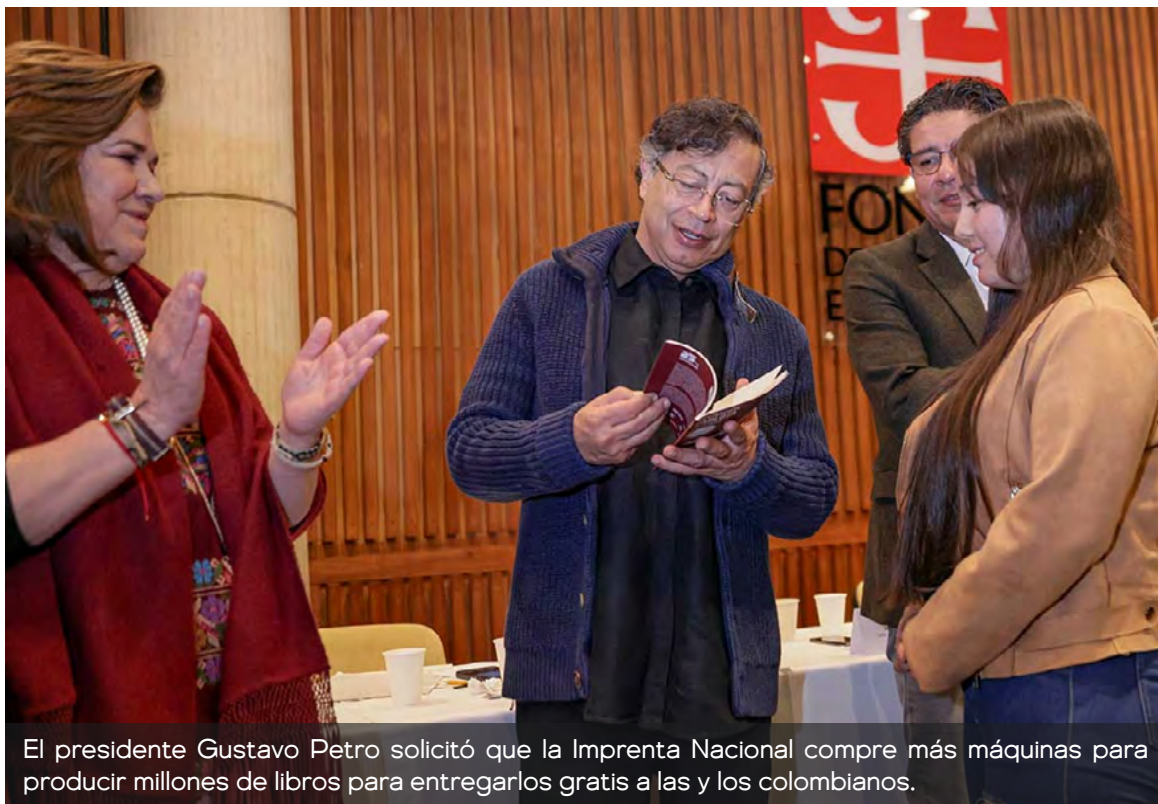
El presidente Gustavo Petro solicitó que la Imprenta Nacional compre más máquinas para producir millones de libros para entregarlos gratis a las y los colombianos.

Destacó que el libro logra, precisamente, estos objetivos, porque logra transformarse en todas estas expresiones artísticas,