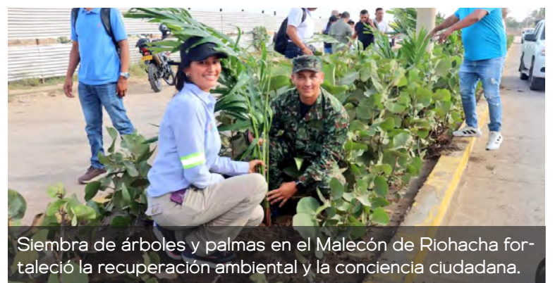
Siembra de árboles y palmas en el Malecón de Riohacha fortaleció la recuperación ambiental y la conciencia ciudadana.