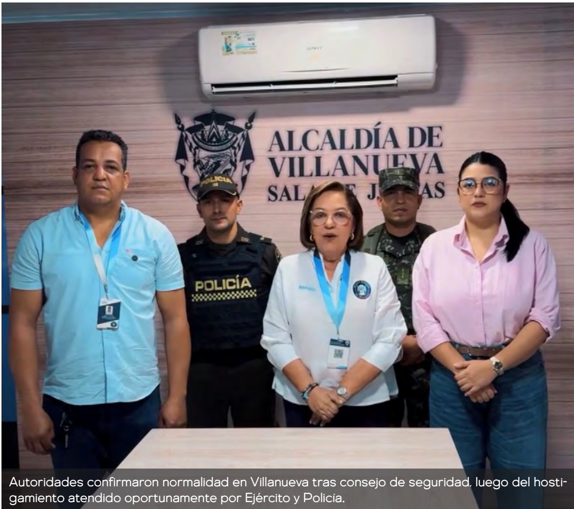
Autoridades confirmaron normalidad en Villanueva tras consejo de seguridad, luego del hostigamiento atendido oportunamente por Ejército y Policía.

Acabamos de salir de un Consejo de Seguridad con un parte de tranquilidad para todas las personas de mi municipio"