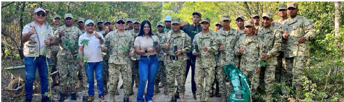
Soldados del Ejército y Corpoguajira adelantaron la siembra de 2.000 árboles en el Fuerte Militar de Buenavista, en zona rural de Distracción.