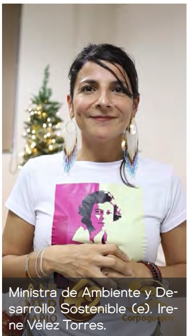
Ministra de Ambiente y Desarrollo Sostenible (e), Irene Vélez Torres.