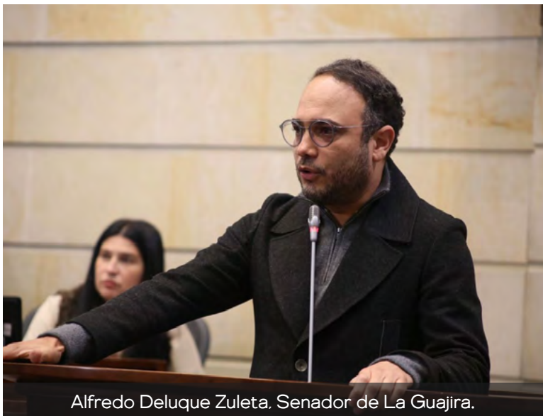
Alfredo Deluque Zuleta, Senador de La Guajira.

dos terroristas que hoy golpean a La Guajira: la quema de un tractocamión, los ataques a la línea férrea de Cerrejón, la instalación de cilindros y banderas del ELN, así como los hostigamientos armados en nuestras vías", aseveró Deluque Zuleta. El congresista señaló que estos hechos no son aislados, sino que obedecen a una problemática estructural de seguridad en el país. "Son la consecuencia directa de un país donde los grupos criminales se fortalecieron, imponen paros armados y de-