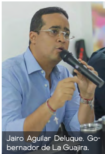
Jairo Aguilar Deluque. Gobernador de La Guajira.

El gobernador de La Guajira, Jairo Aguilar, rechazó de manera categórica los recientes ataques perpetrados por grupos criminales en el territorio y exigió un mayor acompañamiento del Ministerio de Defensa para contrarrestar estos hechos que afectan la seguridad y la tran-