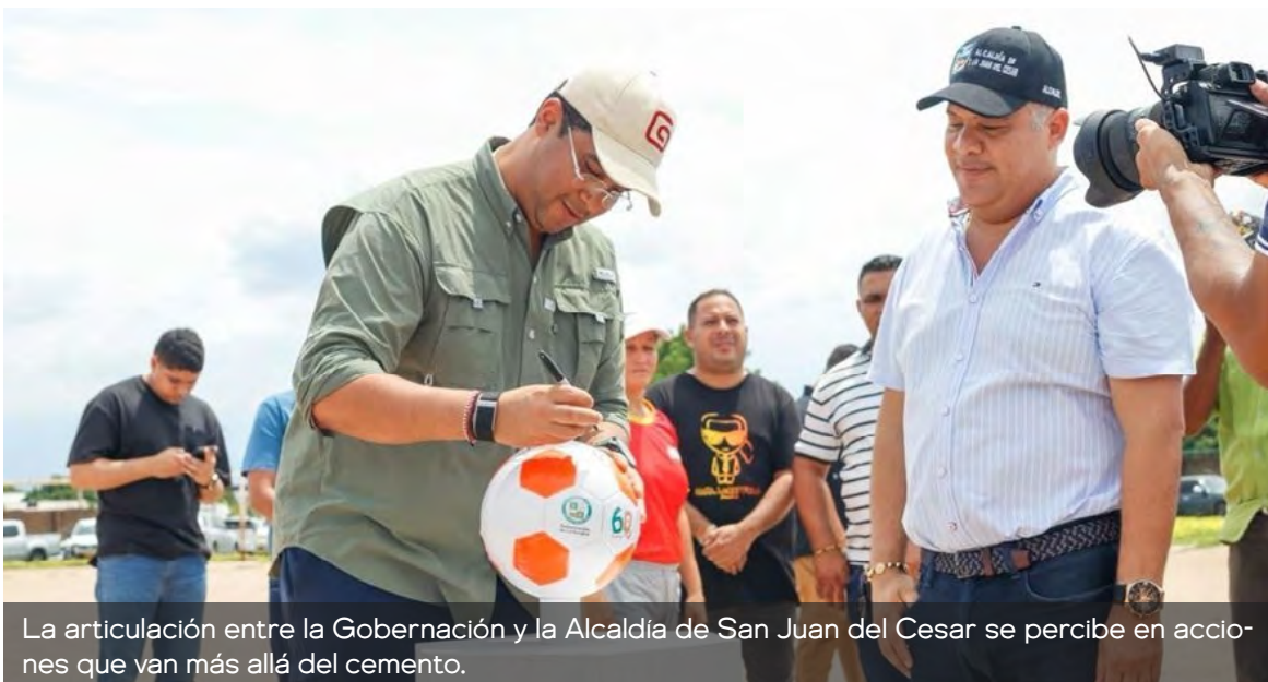
La articulación entre la Gobernación y la Alcaldía de San Juan del Cesar se percibe en acciones que van más allá del cemento.