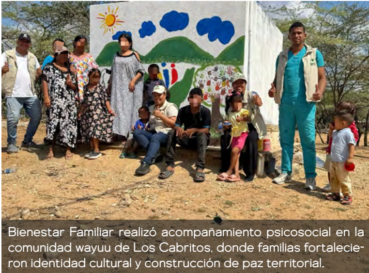
Bienestar Familiar realizó acompañamiento psicosocial en la comunidad wayuu de Los Cabritos, donde familias fortalecieron identidad cultural y construcción de paz territorial.

Como parte de este ejercicio, las familias elaboraron un mural que recoge expresiones culturales