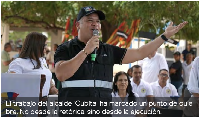
El trabajo del alcalde 'Cubita' ha marcado un punto de quiebre. No desde la retórica, sino desde la ejecución.

La Gobernación de La Guajira, a través de la Empresa de Servicios Públicos ESEPGUA, ejecuta actualmente el proyecto de acueducto que beneficia a los corregimientos de La Junta, La Peña y Curazao, una obra largamente esperada que avanza de manera positiva y conforme al cronograma establecido. El proyecto contempla la instalación de más de 24.000 metros lineales de tubería, la implementación de macromedidores y la construcción de un tanque de almacenamiento de 300.000 litros, lo que permitirá garantizar la continuidad del servicio y ampliar la cobertura has-