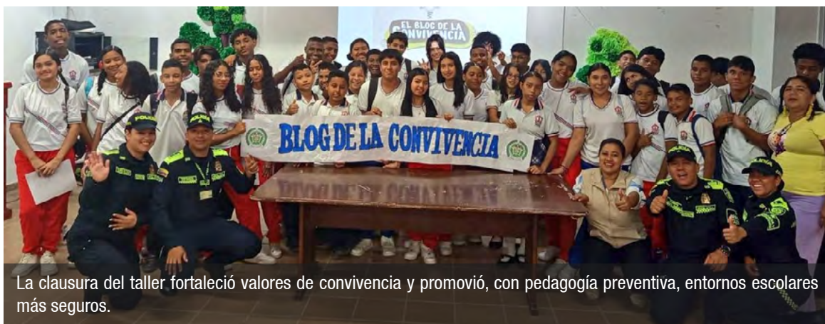
La clausura del taller fortaleció valores de convivencia y promovió, con pedagogía preventiva, entornos escolares más seguros.

Con esta estrategia, la Policía busca prevenir delitos como hurto, extorsión, secuestro, homicidio, lesiones personales y delitos sexuales, entre otros, reforzando la seguridad y la convivencia en las comunidades educativas del departamento.