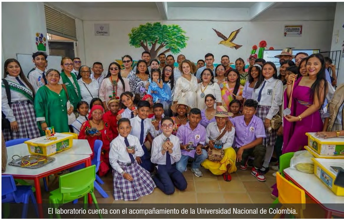
El laboratorio cuenta con el acompañamiento de la Universidad Nacional de Colombia.

con profundo sentido de pertenencia y arraigo cultural. “Qué mejor lugar para sembrar la semilla de la ciencia y la tecnología que en el corazón de la educación de nuestro pueblo”, afirmó.