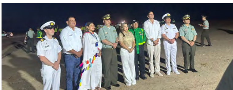
El reconocimiento institucional destacó el liderazgo defensorial y exaltó, con una figura Wayuu, el vínculo cultural que fortaleció su labor comunitaria.