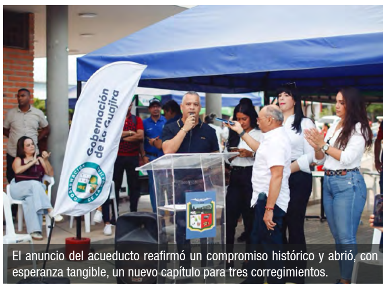
El anuncio del acueducto reafirmó un compromiso histórico y abrió, con esperanza tangible, un nuevo capítulo para tres corregimientos.

El alcalde agregó que "ver a las familias de estos corregimientos mirar el futuro con ilusión nos recuerda por qué trabajamos día a día. Este proyecto simboliza dignidad, bienestar y la oportunidad de vivir mejor". Finalmente, agradeció el