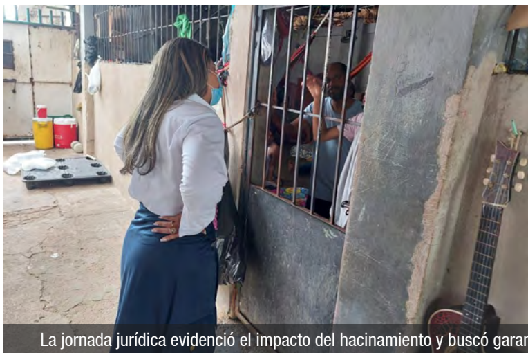
La jornada jurídica evidenció el impacto del hacinamiento y buscó garantizar, con acciones urgentes, justicia y condiciones dignas para los internos.

defensora regional sostuvo una reunión con el alcalde del municipio, quien manifestó disposición para atender la problemática. Como resultado, se gestionó la construcción de dos nuevas baterías sanitarias y dos duchas, obras que buscan mejorar las condiciones de habitabilidad de los internos.