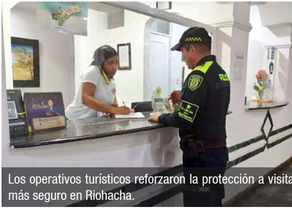
Los operativos turísticos reforzaron la protección a visitantes y promovieron, con controles articulados, un turismo más seguro en Riohacha.

Los operativos fueron desarrollados por uniformados de la Seccional de Protección al Turismo, en articulación con la Dirección de Turismo, la Secre-