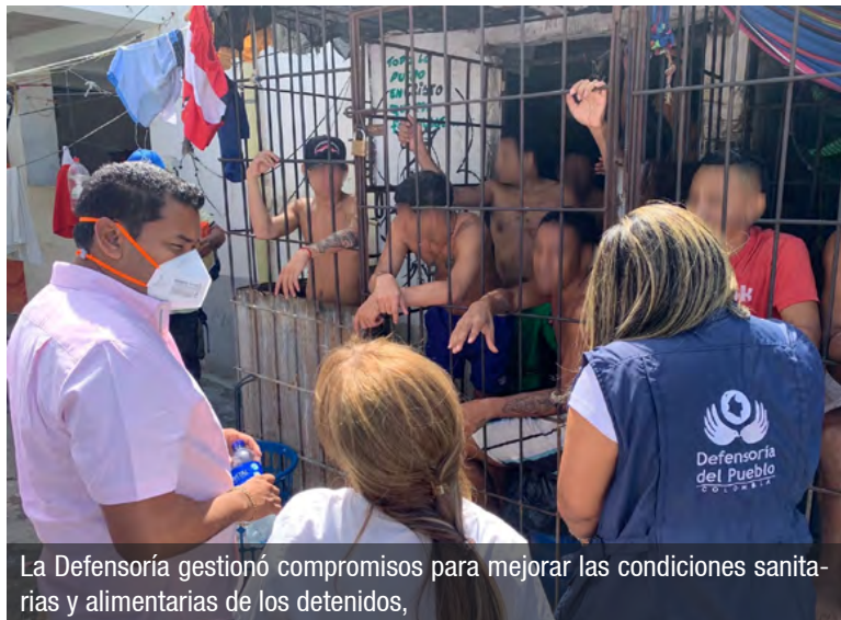
La Defensoría gestionó compromisos para mejorar las condiciones sanitarias y alimentarias de los detenidos,

La presencia coordinada de las entidades contribuye a mejorar la calidad de vida de quienes fueron atendidos y a avanzar hacia una política penitenciaria más humana y preventiva.