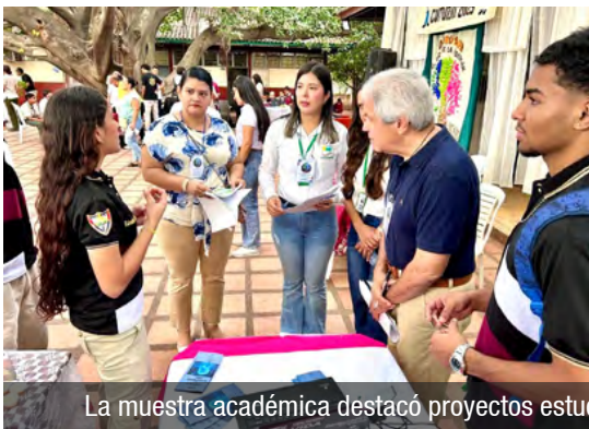
La muestra académica destacó proyectos estudiantiles y fortaleció, con creatividad sostenible, la investigación ambiental en el sur de La Guajira.

La jornada reunió 36 proyectos distribuidos en las categorías de Ciencia y Tecnología y Medio Ambiente y Salud, presentados por estudiantes de la institución anfitriona y por delegaciones invitadas de