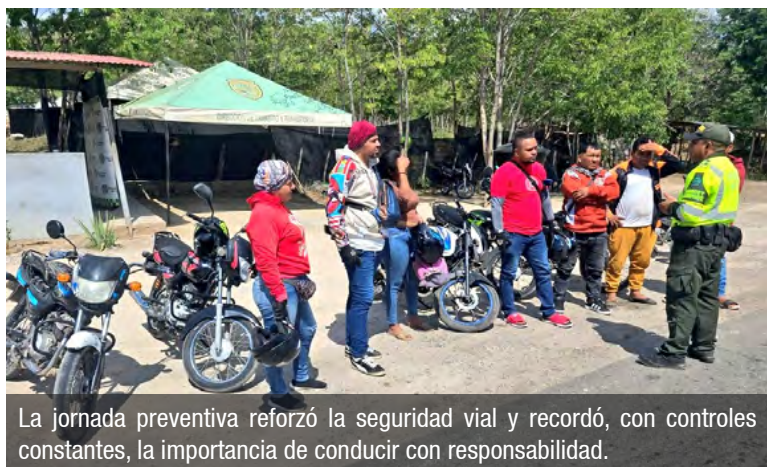
La jornada preventiva reforzó la seguridad vial y recordó, con controles constantes, la importancia de conducir con responsabilidad.

La Seguridad Vial es tarea de todos, recordaron las autoridades de la Policía Nacional de La Guajira, que continúan adelantando acciones preventivas en las vías del departamento.