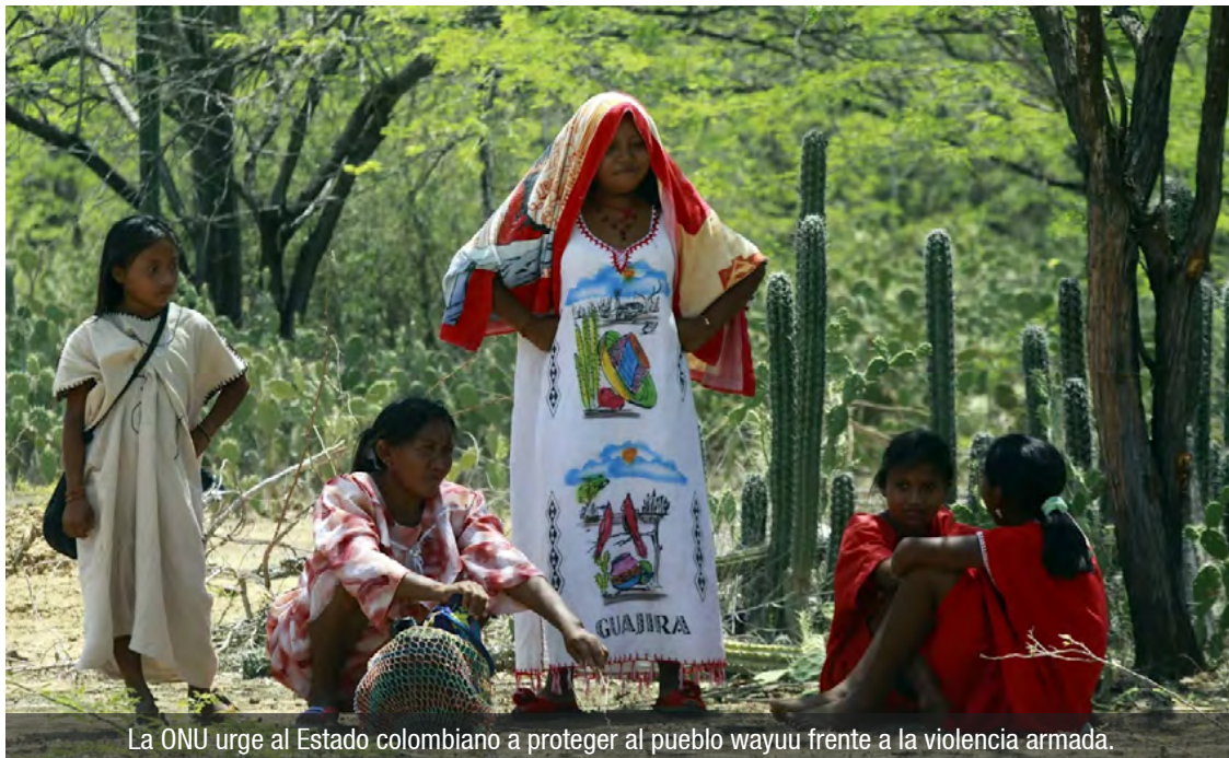
La ONU urge al Estado colombiano a proteger al pueblo wayuu frente a la violencia armada.

La Oficina de la ONU para los Derechos Humanos condenó la incursión violenta perpetrada por un grupo armado no estatal en la comunidad de Cusinajain, en la Alta Guajira, habitada por el pueblo indígena Wayuu, el pasado 27 de octubre.