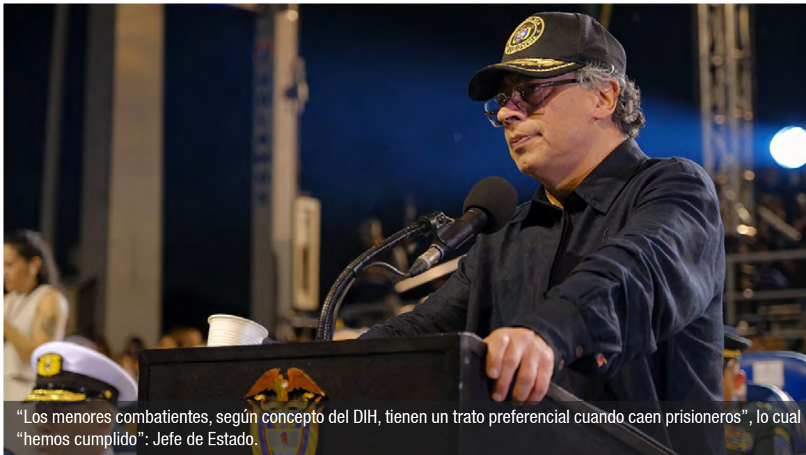
“Los menores combatientes, según concepto del DIH, tienen un trato preferencial cuando caen prisioneros”, lo cual “hemos cumplido”: Jefe de Estado.

Agregó que esto “no es comparable con el bombardeo a las columnas de ‘Mordisco’, armadas y en plena ofensiva”, ya que “en las columnas de ‘Mordisco’ solo tenían combatientes, y