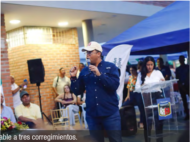
El inicio de la obra de acueducto devolvió esperanza y acercó, tras décadas de espera, agua potable a tres corregimientos.

La solución que durante años esperaron los corregimientos de La Junta, La Peña y Curazao comenzó a hacerse realidad.