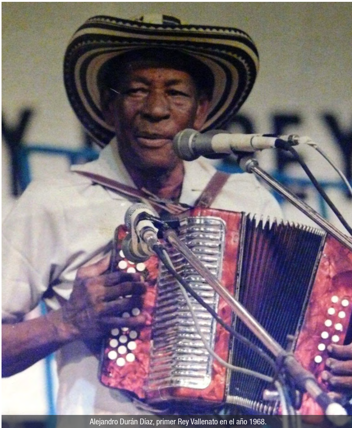
Alejandro Durán Díaz, primer Rey Vallenato en el año 1968.

Al Alejo Durán, el primer Rey Vallenato, recibir ese latigazo directo al corazón y saber que todo no sería igual, optó por hacerle una canción que tituló: 'Donde andaré'. Es así como cantó. "Ya sé acabó la alegría, se la llevó aquella ingrata. Ahora bebo de noche y día, porque el guayabo me mata. Alejo, no había llorado por ninguna en esta vida, ahora la pasa llorando porque tiene el alma herida". Aquella vez de esa relación sentimental quedaron sombras donde los besos y los abra-