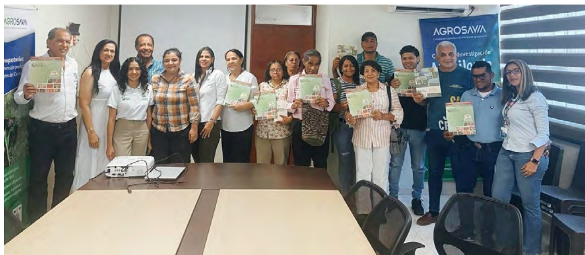
Corpoguajira y Agrosavia impulsan certificación de negocios verdes en La Guajira con enfoque en agroecología y equidad de género.