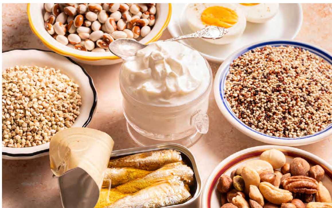
Los expertos recomiendan alternativas saludables para reemplazar las carnes rojas

sostenibles, ya que son una de las fuentes de proteínas que menos recursos consumen del planeta, dijo Herforth.