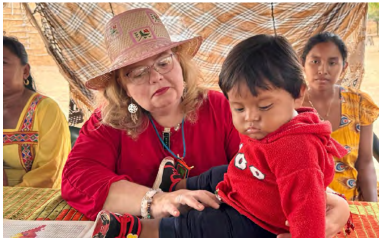
Astrid Cáceres, directora general del Instituto Colombiano de Bienestar Familiar (ICBF).

La directora general del Instituto Colombiano de Bienestar Familiar (ICBF), Astrid Cáceres, fue enfática al anunciar sanciones para las asociaciones u organizaciones que pongan en riesgo el bienestar de la niñez, específicamente en relación con el traslado de niñas y niños urbanos a la atención brindada en el área rural, en el marco del piloto dirigido al pueblo wayuu