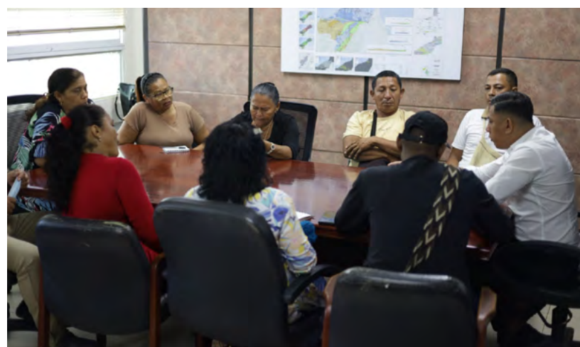
Corpoguajira y comunidades de Dibulla unen esfuerzos para restaurar ecosistemas y proteger la cuenca del Río Lagarto-Maluisa.