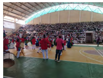
El Colegio San José Campestre celebra 60 años de historia en Maicao con una agenda cultural, académica y religiosa.