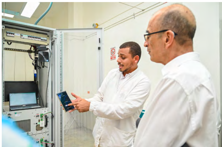
Evaluadores visitan el laboratorio Power-to-Gas, primer laboratorio móvil de generación de energía en La Guajira.

Con esta nueva especialización, la Universidad de La Guajira consolida su liderazgo en la formación de profesionales que contribuyen al desarrollo sostenible y al fortalecimiento del sector de la energía, con un enfoque en la innovación y la competitividad en el ámbito local y nacional.