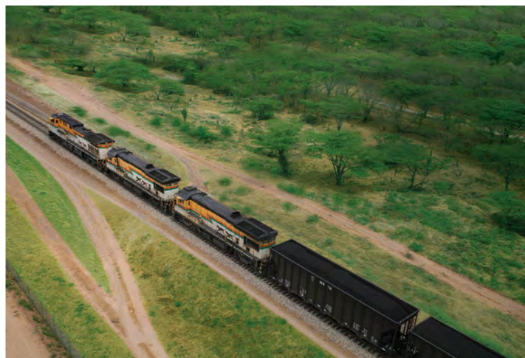
Cerrejón condena atentado con explosivos en su línea férrea en Albania, el quinto en tres meses, e insta a reforzar la seguridad.