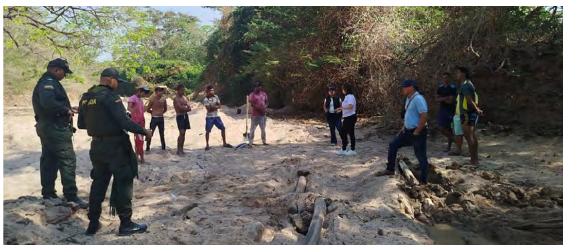
Alcaldía de San Juan del Cesar realiza inspección sorpresa en el río Cesar para garantizar su protección y cumplimiento de fallo judicial.

Según el gobierno que lidera Enrique Camilo Urbina, esta inspección obedece al cumplimiento del fallo de la acción popular, interpuesta el ex procurador ambiental y agrario, Hugues Lacouture Danies.