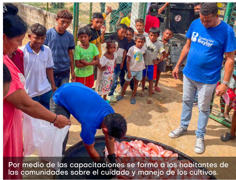
Por medio de las capacitaciones se formó a los habitantes de las comunidades sobre el cuidado y manejo de los cultivos.

alimentaria y se ofrece una alternativa de producción frente a actividades tradicionales como la cría de ovinos y caprinos. Lo que permite que la Universidad de La Guajira reafirme su compromiso con el bienestar y el desarrollo de la región.