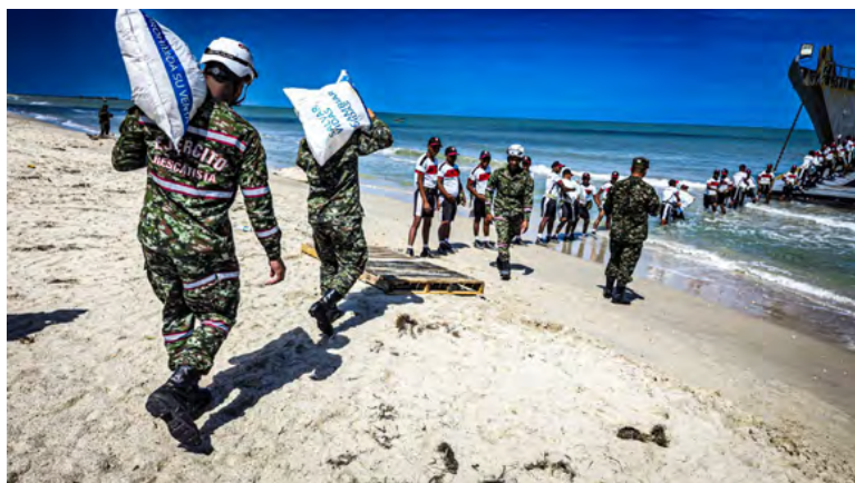
La misión humanitaria Akaliya 2 avanza con 134 toneladas de ayudas para la Alta Guajira, apoyada por el Ejército, la Armada y el ICBF.

La Primera División del Ejército Nacional confirmó su compromiso con la comunidad guajira tras el anuncio del gobernador Jairo Aguilar para seguir entregando ayudas humanitarias.