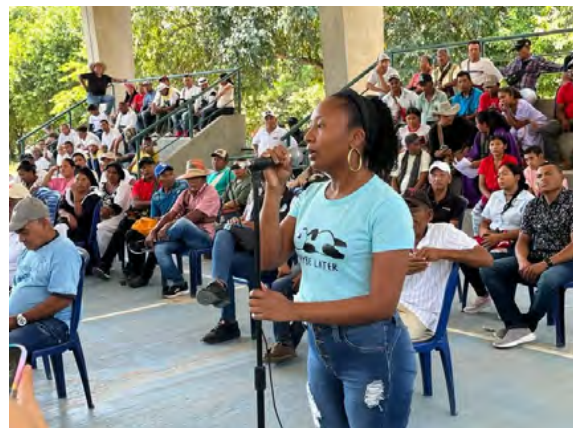
El Viceministro de Agua anuncia avances en acueductos para Mayabangloma y Conejo, impulsando el acceso a agua potable en la zona rural de Fonseca.

En una visita oficial al municipio de Fonseca, el Viceministro de Agua y Saneamiento Básico, Edward Libreros Mamby, anunció dos importantes avances en materia de infraestructura para el acceso al agua potable en la zona rural.