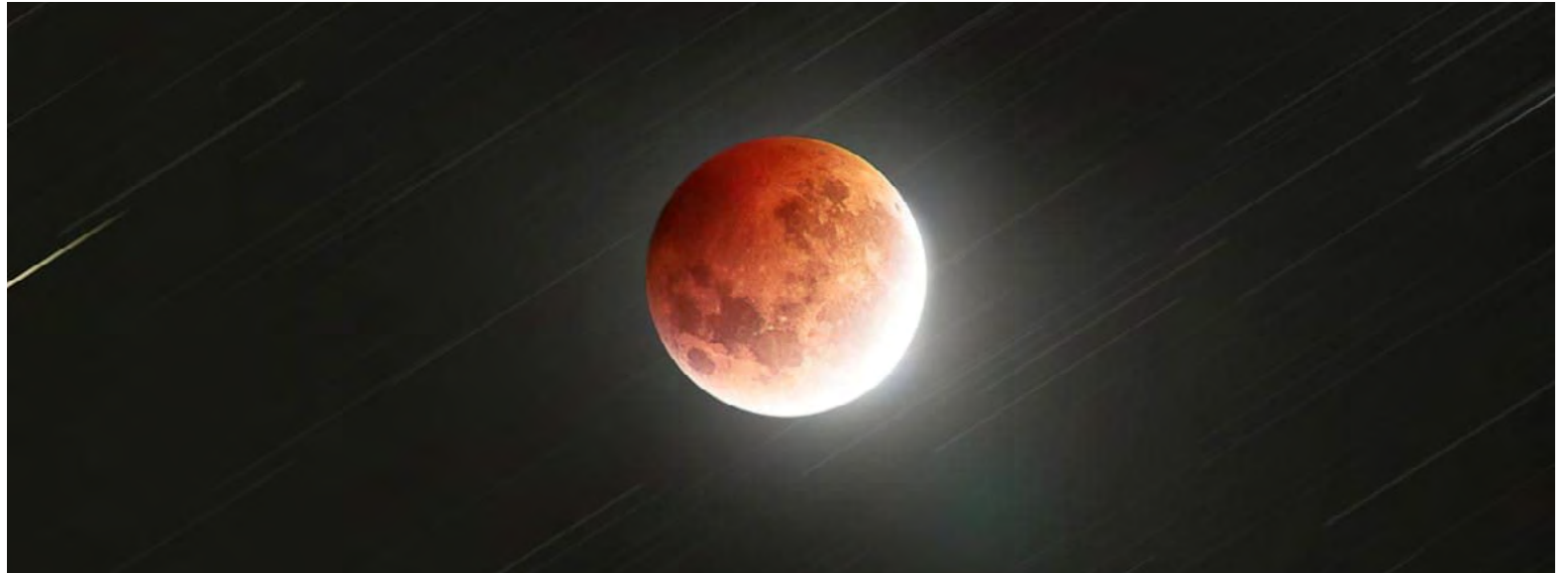
La Guajira se alista para la 'Luna de Sangre' el 13 y 14 de marzo, con cielos despejados ideales para su observación.

Este fenómeno no requiere equipos especiales para su observación; sin embargo, el uso de binoculares o telescopios puede enriquecer la experiencia al permitir apreciar detalles adicionales de la superficie lunar durante el eclipse.