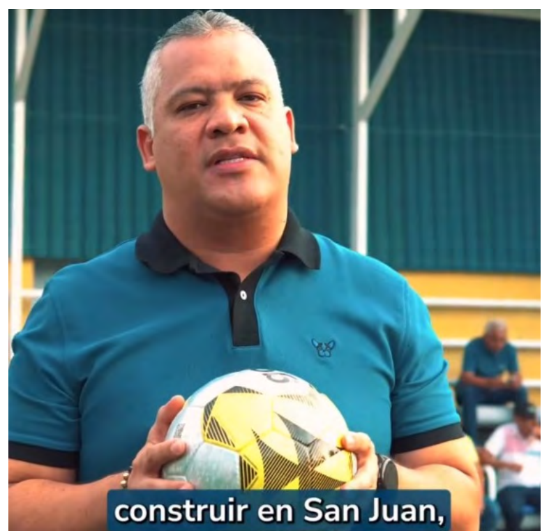
construir en San Juan,