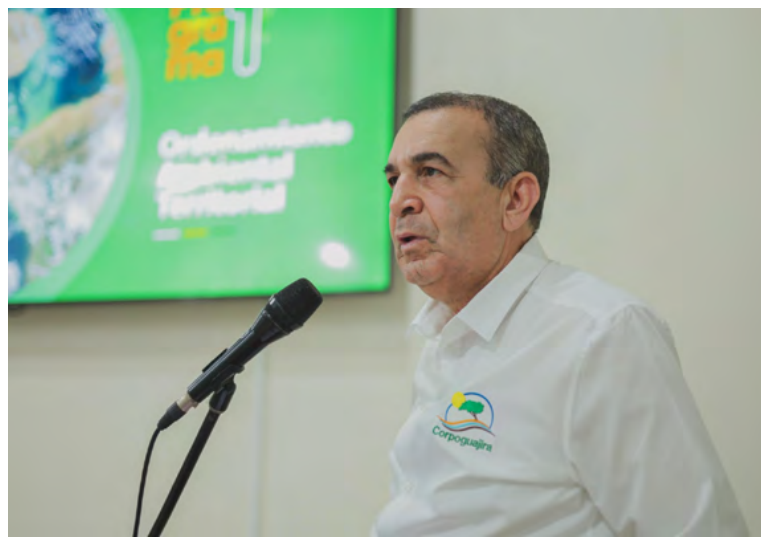
Samuel Lanao Robles, director general de Corpoguajira.

Ante la presencia de la temporada seca y el aumento del riesgo de incendios forestales en el departamento, Corpoguajira entrega una serie de recomendaciones dirigidas a la ciudadanía y a las autoridades con el objetivo de prevenir la ocurrencia de estos desastres naturales que afectan gravemente los ecosistemas y comunidades.