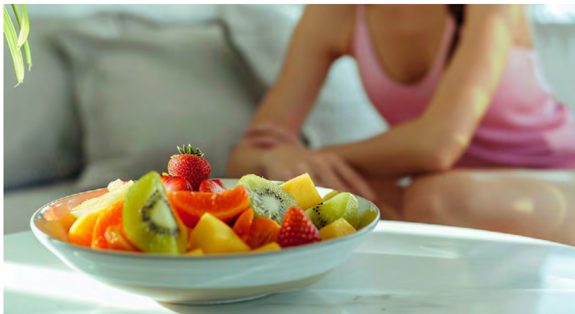
La fatiga extrema y la pérdida de motivación pueden ser señales de una ingesta calórica insuficiente

mascotas, llevar las bolsas de las compras y demás.