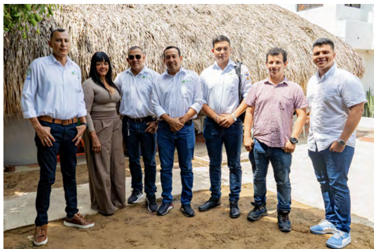
Investigadores del proyecto participaron en la socialización de la plataforma, compartiendo sus avances y perspectivas para su implementación.

Como parte del estudio, se han documentado los avances del sector en tres libros denominados: Buenas prácticas de ordeño (BPO) y buenas prácticas de manufactura (BMP) para la elaboración y manejo del queso costeño; Gestión empresarial y asociatividad productiva para la cadena de suministro del queso costeño en el Caribe colombiano e Higiene y manipulación de alimentos: queso fresco y queso costeño.