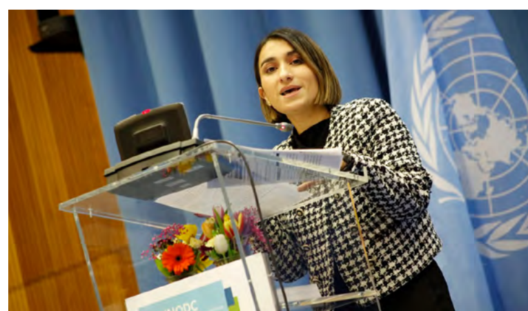
Laura Sarabia, ministra de Relaciones Exteriores.

"No podemos permitir que las comunidades queden atrapadas en la violencia y el abandono. Debemos llevar recursos y proyectos de transformación territorial a quienes más lo necesitan", señaló la ministra al referirse a la importancia de generar alternativas económicas para las regiones más afectadas por el