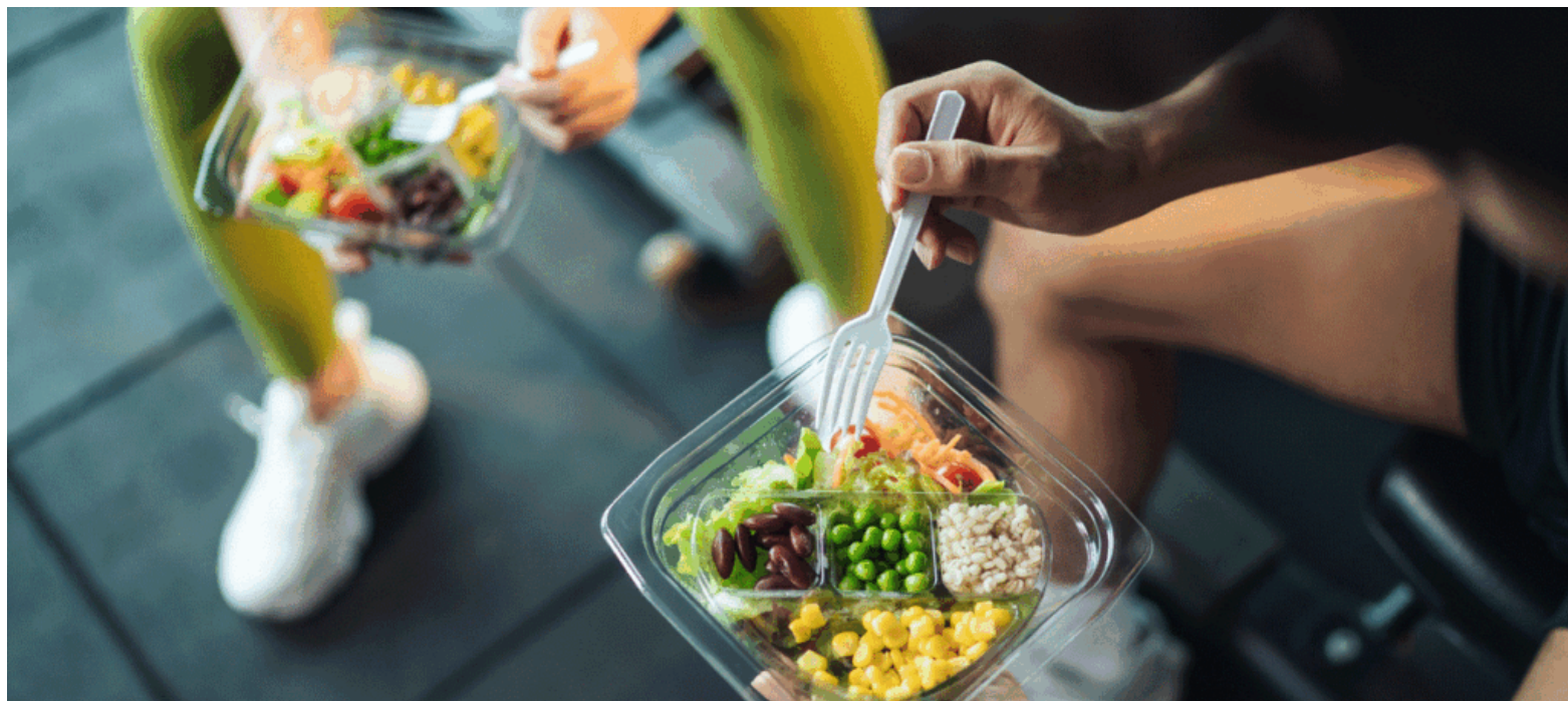
La deficiencia energética relativa en el deporte (RED-S) afecta funciones biológicas clave como la regulación hormonal y la densidad ósea

Al finalizar el ejercicio uno se siente cansado y eso está bien y es normal. Lo que no debe ocurrir es sentirse sin energía para realizar tareas cotidianas como jugar con hijos,