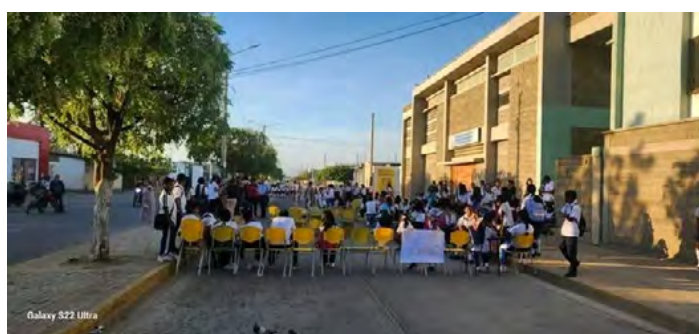
Institución Etnoeducativa Eusebio Septimio Mari