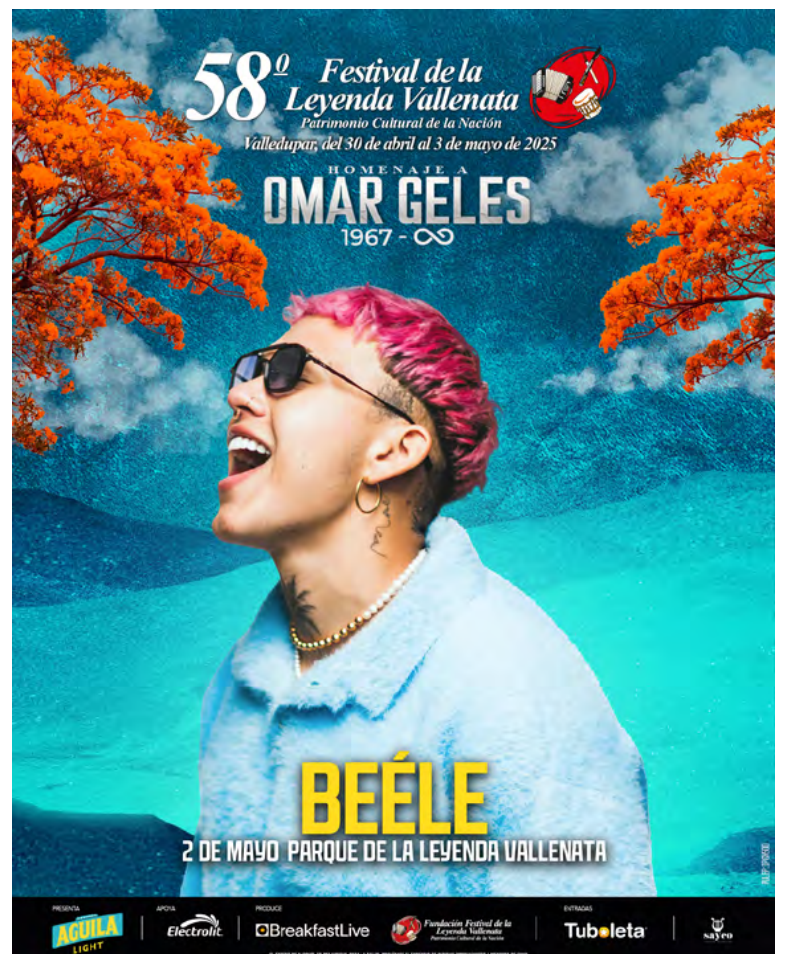
Beéle, artista que estará presente en el 58 Festival de la Leyenda Vallenata

No te pierdas la oportunidad de ser parte de esta gran celebración cultural y disfrutar del talento de Beéle en el escenario más emblemático del vallenato.