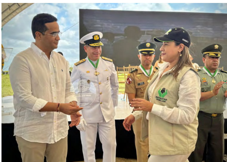
El ICBF recibió un reconocimiento por su labor en la Misión Humanitaria Akalii'ja, que llevó ayuda vital a comunidades de la Alta Guajira.