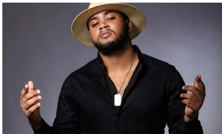
Chris Lebrón es un nuevo fenómeno de la música dominicana.