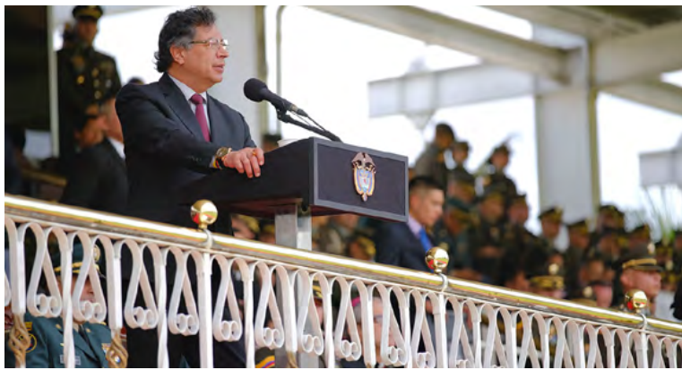
El presidente Gustavo Petro.

que en este y otros puertos del país se ha presentado desde tiempo atrás un régimen de corrupción con participación de servidores públicos, políticos, 'traquetos' y contrabandistas, el cual “se acaba o es Colombia la que se acaba”.