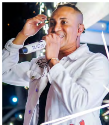
Él es el cantante herido en Medellín

Sorprendentemente, no había más personas en el lugar. Los asistentes, al parecer, hu-