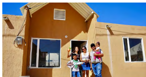
La Gobernación de La Guajira entregó 58 viviendas en Manaure, reafirmando su compromiso con la dignidad y estabilidad de las familias.