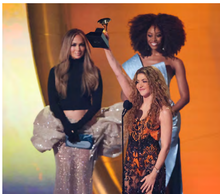
Shakira, que ganó previamente el Grammy a mejor álbum pop latino, se presentó en la gala de los premios.

show, que sin duda quedará para la posteridad, Shakira vivió un incómodo momento por cuenta del presentador de la gala, el humorista y escritor sudafricano Trevor Noah, que en una rutina para romper el hielo al inicio de la premiación se refirió al país en términos desobligantes y, de nuevo, asociados con la ilegalidad.