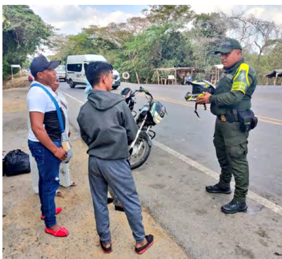
La Policía refuerza controles en vías de La Guajira para mejorar la seguridad vial y prevenir accidentes entre motociclistas.

“A través de actividades de prevención y control Tránsito de la Policía de La Guajira se avanza con planes preventivos a favor de la Seguridad Vial de nuestros motociclistas, implementando medidas para la