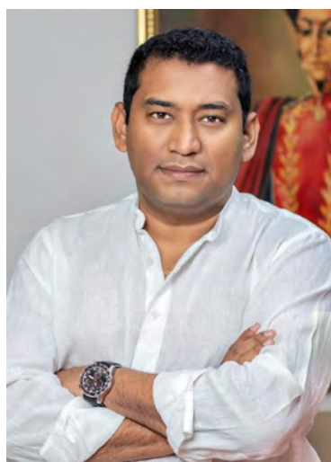
Miguel Felipe Aragón González, alcalde de Maicao.

El alcalde de Maicao, Miguel Felipe Aragón González, expresó su inquietud ante esta situación, enfatizando en que el municipio carece de los recursos necesarios para atender a la numerosa población migrante que ha buscado refugio allí. "El municipio de Maicao no cuenta con los recursos necesarios para asumir el costo de atender a la población migrante.