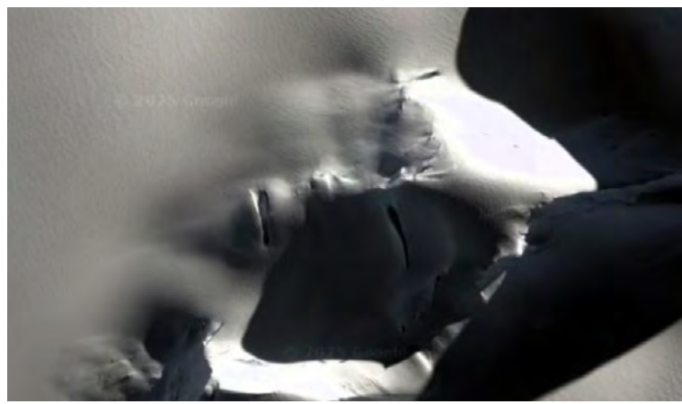
La figura hallada en la nieve parece asemejarse a un rostro humano con ojos, nariz y boca.

Sin embargo, los más escépticos se apresuraron a desacreditar estas suposiciones, argumentando que la formación en la Antártida no es más que un caso de pareidolia, el fenómeno psicológico que lleva al cerebro humano a identificar patrones familiares, como rostros, en elementos aleatorios.