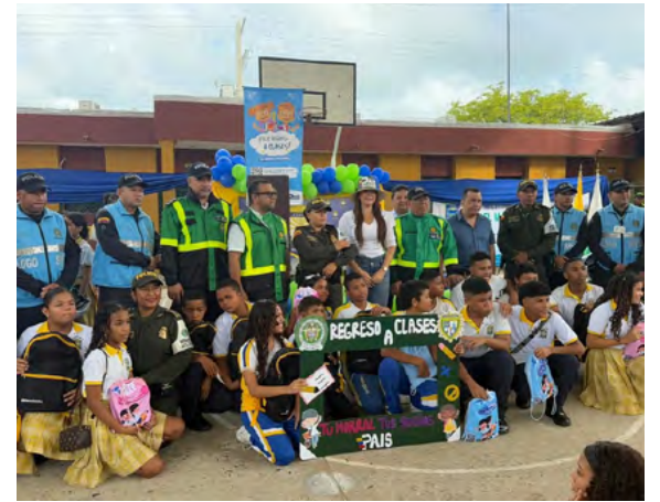
La Gestora Social de Riohacha y la Policía Nacional entregaron kits escolares y promovieron entornos seguros en el regreso a clases.

clases 2025. Renovamos nuestro compromiso con la educación de nuestros niños, niñas y adolescentes”, afirmó la Policía Nacional de La Guajira.