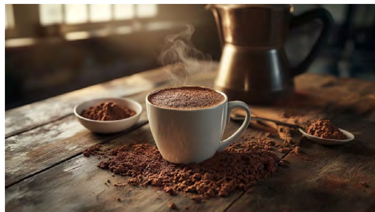
Los flavonoides y compuestos fenólicos del cacao impulsan la neuroplasticidad y la memoria

hipocampo, un proceso en el que se generan nuevas neuronas, esencial para la memoria y el aprendizaje. También se observó un aumento en la expresión del factor neurotrófico derivado del cerebro (BDNF), una proteína clave para la supervivencia neuronal, el crecimiento dendrítico y la plasticidad sináptica. Estos resultados sugieren que el cacao puede ser un aliado para mantener la función cognitiva.