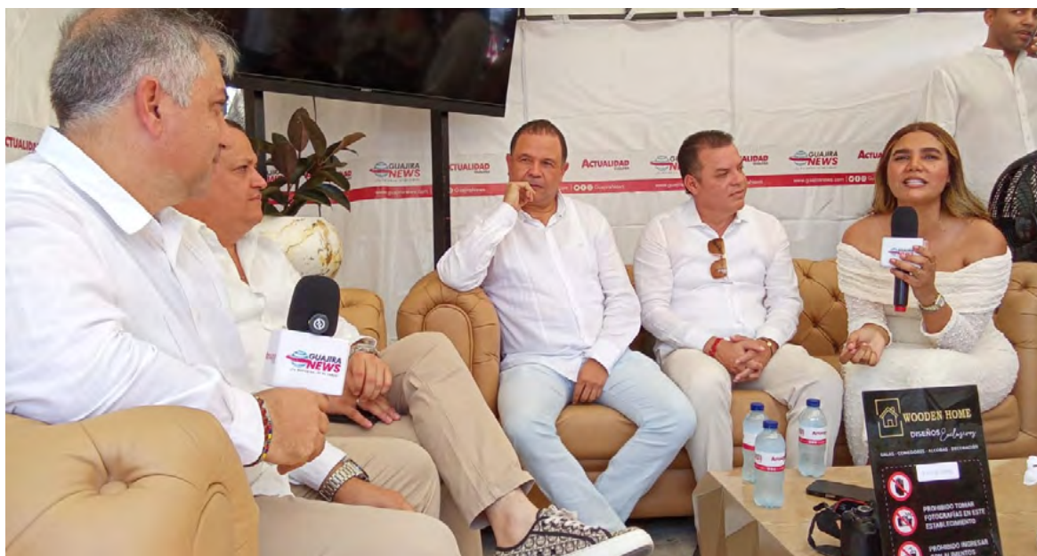
Cuatro exalcaldes de La Guajira exploran la creación de una fuerza política con miras a las elecciones legislativas de 2026.

El encuentro de estos exalcaldes en el set de Guajira News mostró un interés común por consolidar una nueva corriente política en La Guajira, con la premisa de generar una representación fuerte para el departamento en el Congreso y, eventualmente, en las elecciones regionales futuras.