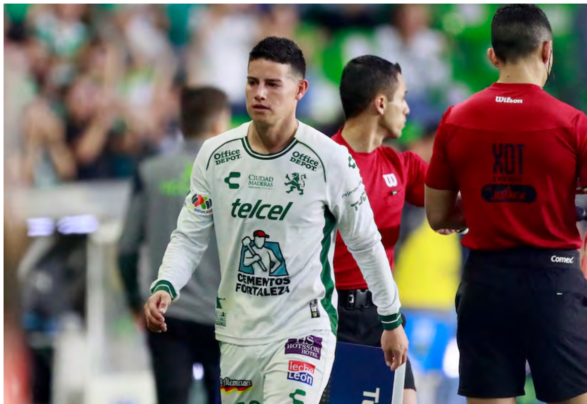
James Rodríguez es la figura del León de México en la Liga MX, con un gol y una asistencia en tres partidos

“Liga Deportiva Alajuelense eleva caso Mundial de Clubes al TAS. Ante la inacción por parte de la FIFA a la gestión presentada por Liga Deportiva Alajuelense se interpuso una demanda formal ante el Tribu-