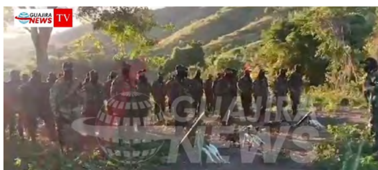
Toque la imagen para ver video.

A través de un video, las Autodefensas Conquistadores de la Sierra (ACSN) anunciaron la ejecución de lo que denominan “limpieza social” en Riohacha, Maicao y Albania. El vocero del grupo indicó que sus objetivos serán atracadores, fleteros, secuestradores, sicarios, robadores de vehículos, teléfonos y motos, así como colaboradores del Clan del Golfo.