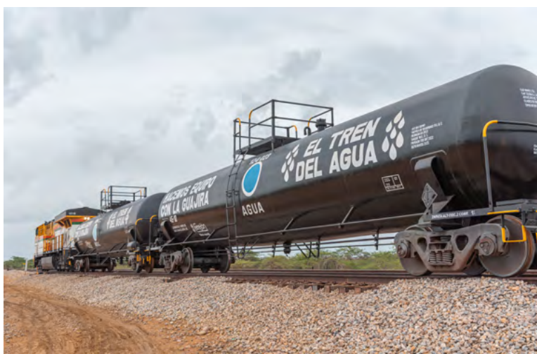
El Tren del Agua: 10 años llevando esperanza y más de 368 millones de litros de agua potable a las comunidades wayuu.

“Quiero manifestar mi agradecimiento a la empresa Cerrejón que siempre está pendiente de las necesidades de la comunidad. Siempre hemos sido beneficiarios del agua, que para