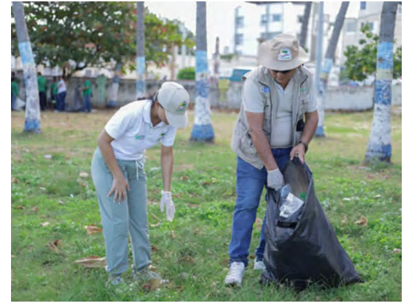
Voluntarios y organizaciones unen esfuerzos en Riohacha para limpiar playas y fomentar la conciencia ambiental en el Día Mundial de la Educación Ambiental.

del departamento que la iniciativa busca embellecer las playas y también generar conciencia sobre la importancia de cuidar nuestros ecosistemas costeros y promover prácticas sostenibles entre la comunidad.