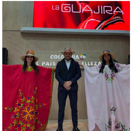
En FITUR 2025, La Guajira fortaleció su posicionamiento turístico con la marca 'Descubre Guajira' y alianzas estratégicas globales.