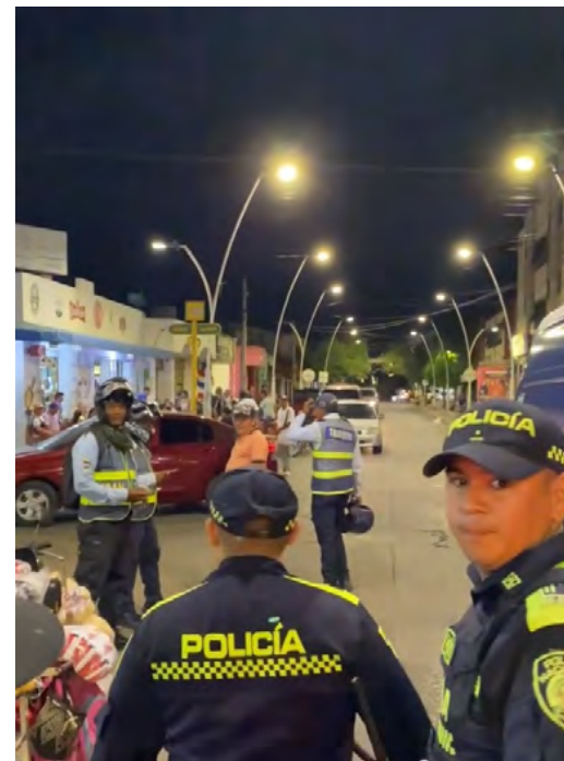
Operativos en Maicao inmovilizan motocicletas irregulares; buscan reducir accidentes y reforzar la seguridad vial en el municipio.