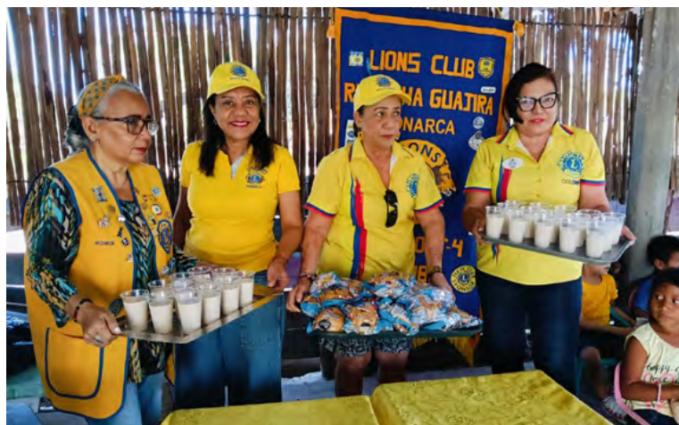
El Club de Leones Riohacha Monarca y la gobernadora Glenda Arias Jara unen esfuerzos para llevar alimentos y esperanza a la comunidad Waipe.

Durante la actividad, los niños recibieron alimentos y apoyo en un ambiente de unión y esperanza. La gobernadora, junto con los integrantes del Club de Leones, participó activamente en la entrega de raciones, resaltando la importancia de estas iniciativas para mejo-