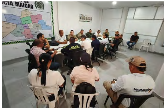
En el Segundo Consejo de Seguridad de 2025 en Maicao, se definieron estrategias clave para reforzar la seguridad y combatir el crimen organizado.

También se resaltó en este Consejo de Seguridad el contundente golpe propiciado por la Policía Nacional con la captura de un sujeto vinculado al asesinato de un patrullero de