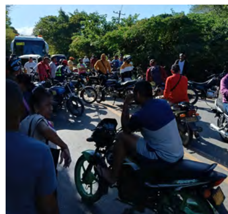
La Cabellona, Cuestecitas