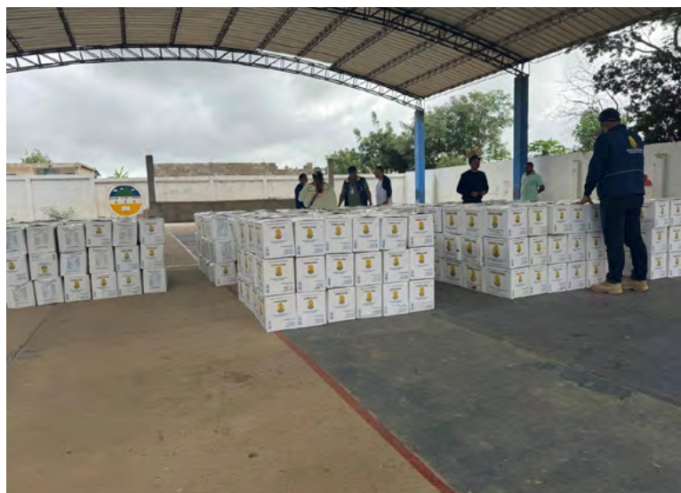
Operación Guajira: La UNGRD distribuye ayuda humanitaria a comunidades afectadas por las lluvias, reafirmando su compromiso con la región.

Esta Asistencia Humanitaria hace parte de la denominada 'Operación Guajira' que permitió la instalación de un hospital de campaña para atender a más de 10.000 personas de la zona norte extrema del depar-