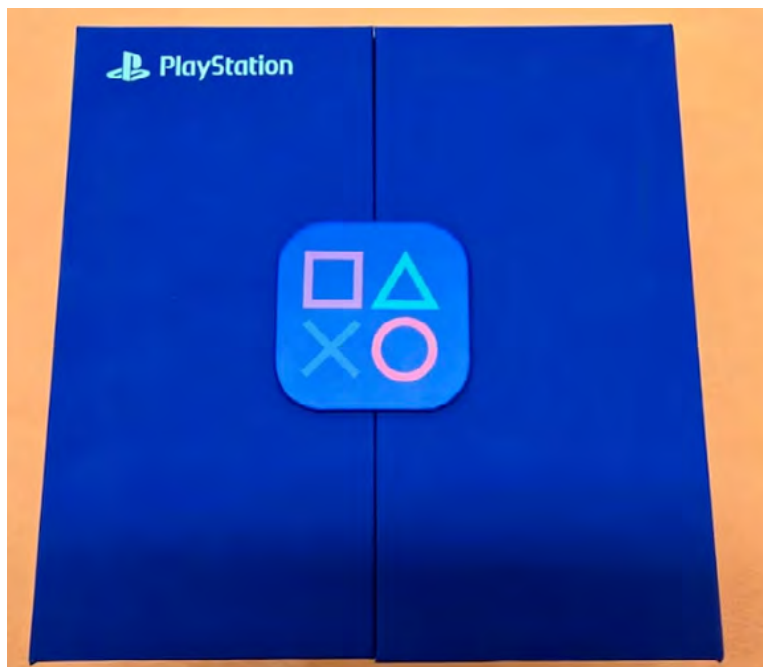
El diseño de la edición especial incluye una correa azul con el logo de PlayStation y los icónicos botones del mando.

Además, el packaging de este dispositivo ha sido personalizado para la ocasión. La caja es de color azul, en sinto-