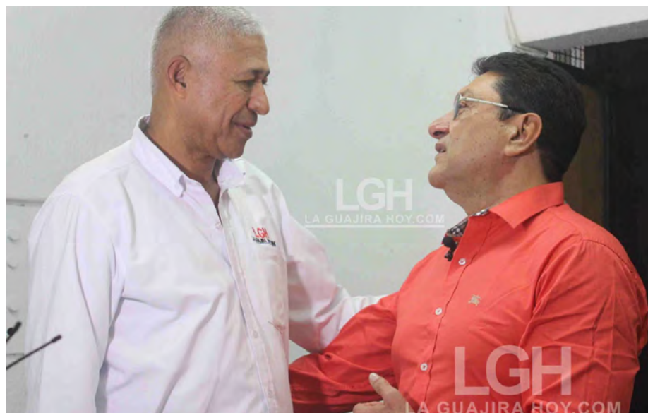
Toque las imágenes para ver entrevista en el canal de YouTube de LaGuajiraHoy.com

compartió su visión sobre el futuro de la región, destacando el potencial de la agroindustria, el turismo y la infraestructura vial, además de un llamado enfático contra la corrupción.