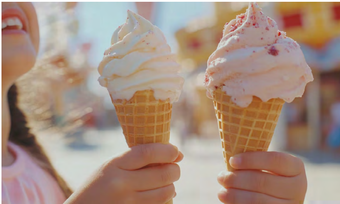
En Estados Unidos, el helado genera aproximadamente 13 mil millones de dólares anuales como motor económico.

Además del calcio, el helado también aporta vitaminas A, D y B12. La vitamina A es fundamental para la salud ocular y la función inmune, mientras que la vitamina D ayuda en la absorción del calcio. La vitamina B12 es esencial para la formación de glóbulos rojos y el mantenimiento del sistema nervio-