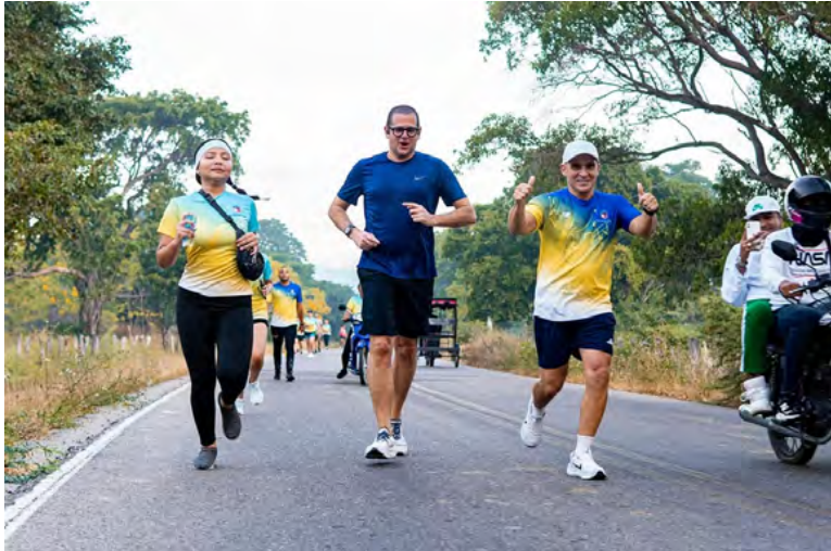
Atletas participan en la carrera 'Luna Sanjuanera' organizada por la alcaldía de San Juan del Cesar.

Centenares de atletas se dieron cita en el municipio de San Juan del Cesar para participaron en una maratónica jornada deportiva y cultural.