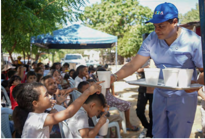
El alcalde de Riohacha participa en la preparación de alimentos durante el almuerzo comunitario en la comuna 10.