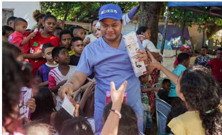
El alcalde y la Gestora Social entregan regalos y comparten momentos de emoción y espíritu navideño con las familias.

Entre conversaciones con las familias y la entrega de re-