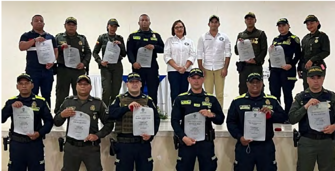
Funcionarios de la Policía Nacional de La Guajira son homenajeados por su labor en Villanueva.

"Reconociendo su dedicación y compromiso a través de un almuerzo especial, que además permitió compartir un momento cargado de unión y espíritu navideño", afirmó la administra-