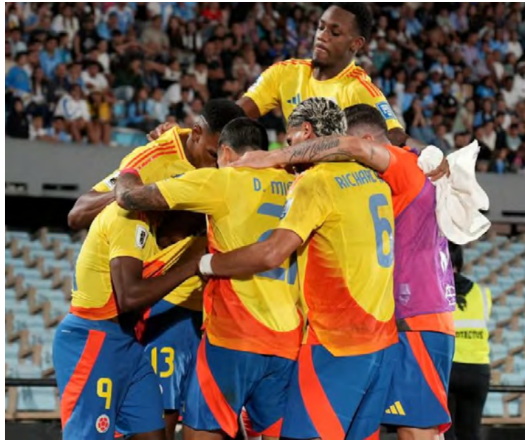
Fijo de Néstor Lorenzo podría cambiar de aires en la próxima temporada.

El interés de clubes como el Manchester City no es casualidad, dado que el equipo dirigido por Pep Guardiola podría estar buscando un reemplazo a largo plazo para Kyle Walker, que, a sus 34 años, ha visto reducido su protagonismo en la presente temporada. Cabe recordar que, el defensor estuvo