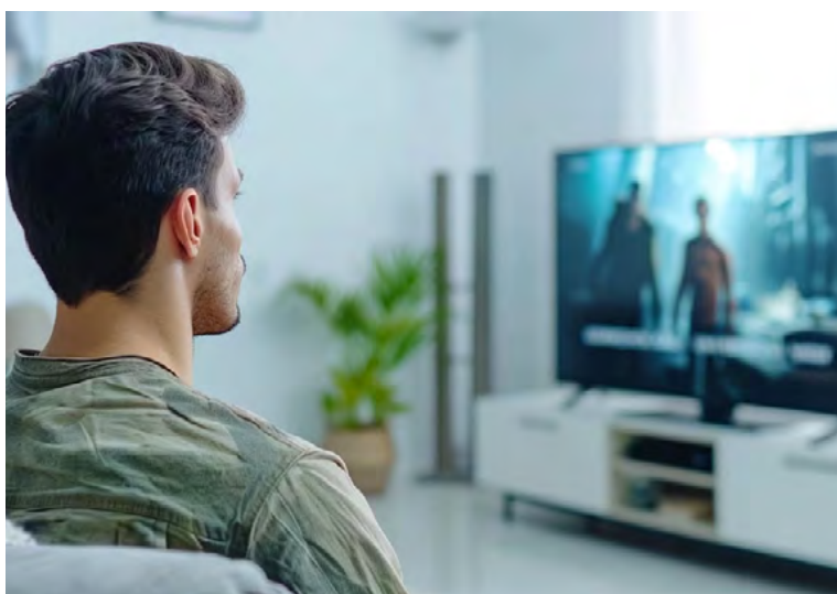
MagisTV ofrece un catálogo grande de producciones, pero hay muchos riesgos de seguridad.

MagisTV es una aplicación de IPTV (Protocolo de Televisión por Internet) que permite transmitir televisión en vivo y acceder a un catálogo extenso de películas y series. Este tipo de tecnología no es inherentemente ilegal, pero su uso en MagisTV se basa en la piratería, al retransmitir contenido protegido por derechos de autor sin la debida autorización.