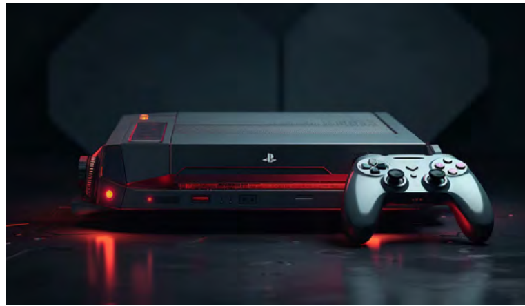
Sony cree que la PS5 todavía tiene mucho tiempo para existir, pero que la PS6 no sufrirá retrasos.

Desde su lanzamiento en 2020, la PS5 ha enfrentado numerosos desafíos, principalmente relacionados con problemas de abastecimiento en