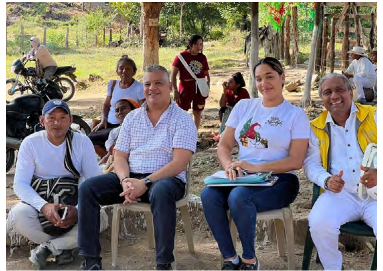
La comunidad indígena Wiwa de Potrerito, San Juan del Cesar, recibe apoyo agrícola y pecuario para fortalecer su seguridad alimentaria y tradiciones.

maíz, la Unidad Nacional para las víctimas, entregó insumos a 26 familias, víctimas del de la comunidad de la comunidad indígena wiwa de Potrerito, zona rural de San Juan del Cesar, con la coordinación de la alcaldía municipal. Esta dotación cons-