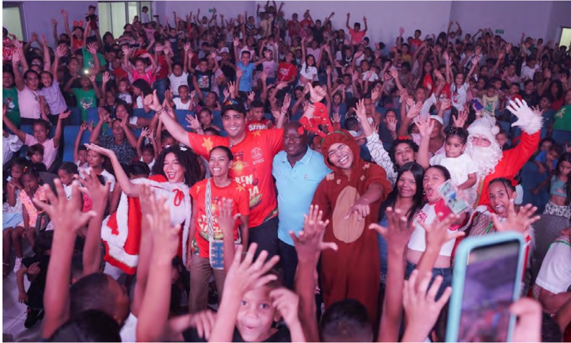
Este recorrido navideño tuvo como objetivo brindar a los niños y niñas de La Guajira una experiencia única llena de sonrisas, premios y un gran show navideño.