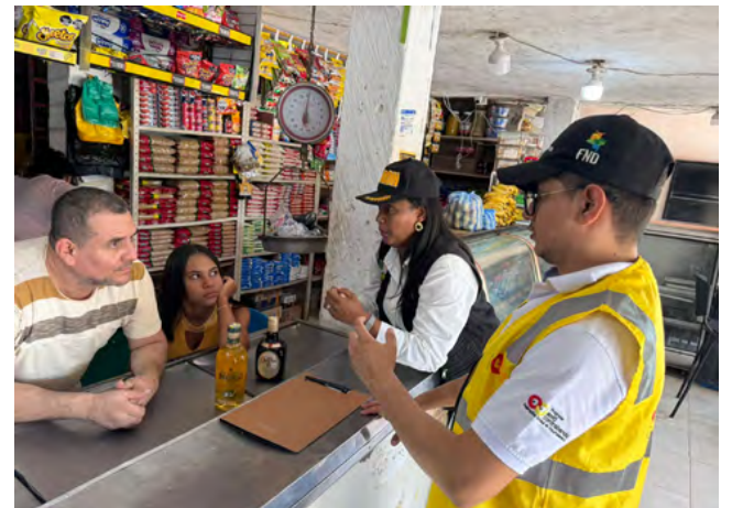
El Grupo Operativo Anticontrabando de La Guajira aprehendió más de 2,400 productos ilegales en 2024, reforzando controles en eventos y municipios del departamento.

Importantes y contundentes fueron los resultados obtenidos por el Grupo Operativo Anticontrabando de la Gobernación de La Guajira, en la que 1,470 cajetillas de cigarrillos extranjeros, es decir, 29,400 unidades fueron aprehendidas durante el año 2024.