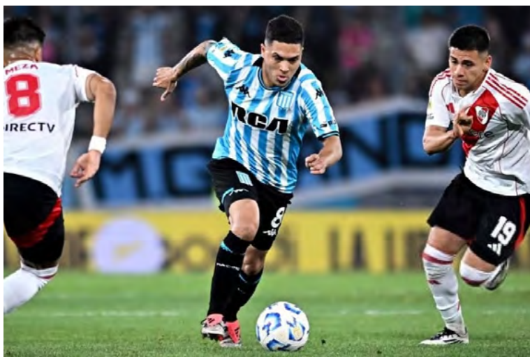
Juanfer Quintero estaría muy cerca de regresar al fútbol colombiano