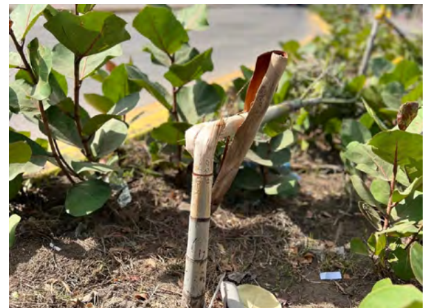
Corpoguajira llama a proteger el paisajismo de la Avenida Primera en Riohacha, clave para embellecer la ciudad y mejorar el ambiente.