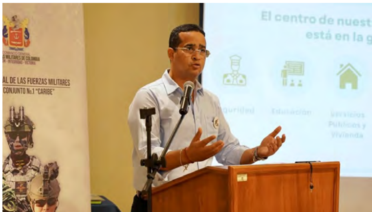
Jairo Aguilar, Gobernador de La Guajira.

productos aprehendidos de 2,446, en 61 visitas de control en ciudad capital y municipios realizadas durante el año 2024.