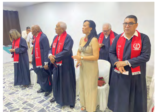
Entre homenajes y nuevos retos, el Colegio de Abogados de Riohacha reafirma su propósito de representar y fortalecer la profesión.

destacados fue la entrega del Doctorado Honoris Causa a distinguidos abogados de la región Caribe, quienes fueron re-