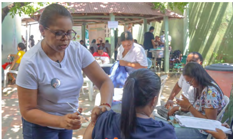
El alcalde Genaro Redondo lidera una Jornada Integral de Salud y servicios en Camarones, fortaleciendo el bienestar comunitario, la limpieza de playas y la reactivación económica local.

aquí de la Boca de Camarones. Esto significa también estar cerca de la gente”.