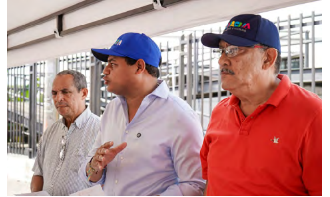
Riohacha se une contra el VIH/SIDA: prevención, educación y acción comunitaria.

En el marco de la conmemoración del Día Mundial del VIH/SIDA, la Alcaldía de Riohacha, a través de la Secretaría de Salud y el Programa de Intervenciones Colectivas (PIC), llevaron a cabo una jornada de tamizaje, con el objetivo de promover la prevención, detección temprana y concientización sobre el VIH/SIDA.