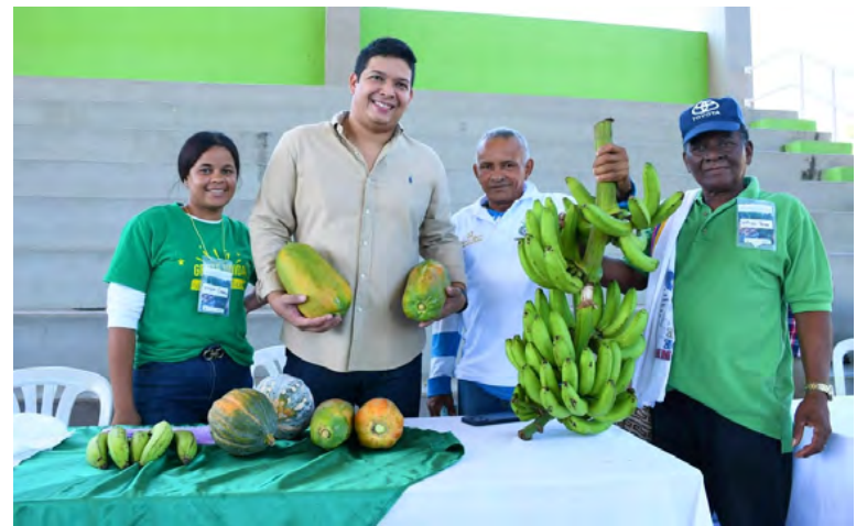
Agricultores locales protagonizan el Mercado Campesino en Barrancas, promoviendo la seguridad alimentaria, el derecho a la alimentación y el fortalecimiento de la economía agrícola regional.

En la apertura de comité el alcalde Vicente Berardinelli, expresó que “quiero agradecer a las familias barranqueras que han demostrado su voluntad de mostrar la representatividad de Barrancas como un municipio de vocación agrícola. Esto es evidencia en cada evento en el que participan, ofreciendo sus