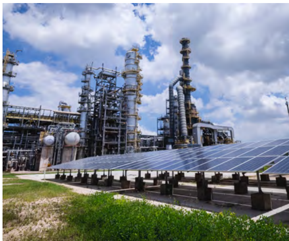
En la Refinería de Cartagena se instalará un electrolizador de 5 megavatios, con capacidad para producir 800 toneladas de hidrógeno verde al año.

De esta manera, el Grupo Ecopetrol se posicionará entre las compañías líderes internacionales en producción de hidrógeno de bajas emisiones, convirtiéndose en la instala-