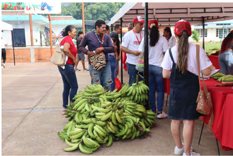
Mercados campesinos: un impulso a la economía local y la soberanía alimentaria en Maicao.

se reduce la dependencia de los productos industrializados y procesados.