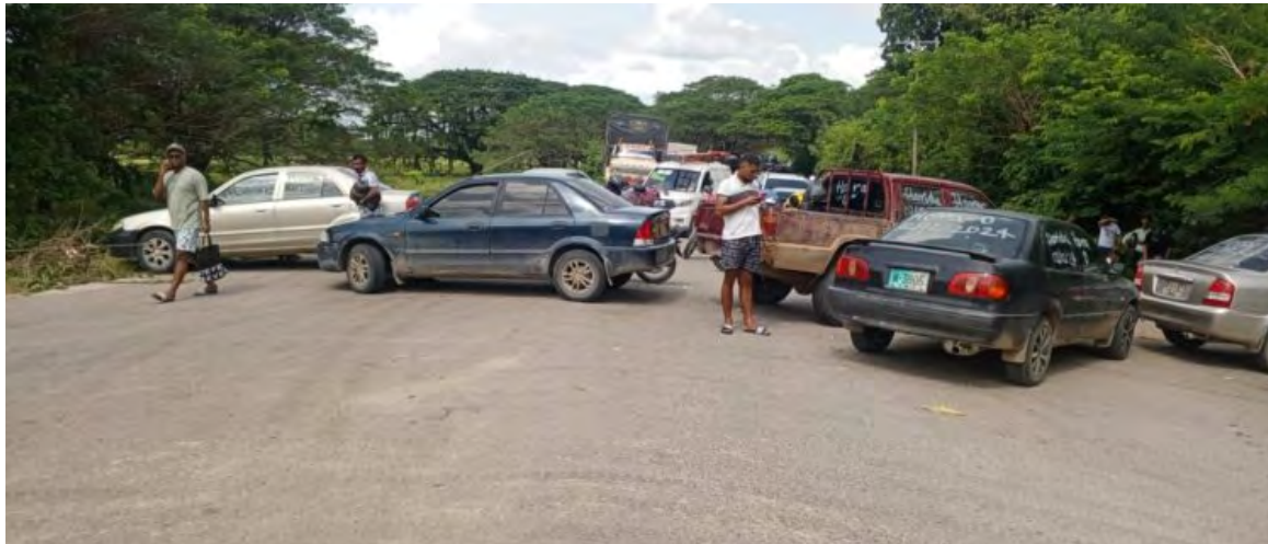
Transportadores bloquean la vía Riohacha-sur de La Guajira, exigiendo reparaciones urgentes tras el deterioro agravado por la ola invernal.

El cierre se realizó a pesar de los diálogos que sostuvieron hasta tarde en la noche del domingo con la Alcaldía, donde no lograron llegar a ningún acuerdo, reiniciando las con-