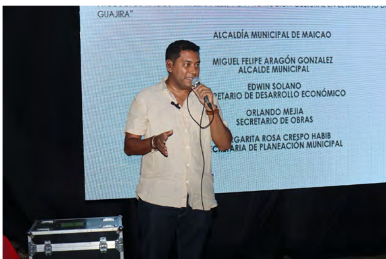
Alcalde de Maicao, Miguel Felipe Aragón

En el lugar que es emblemático para los maicaeros, se proyecta la construcción de un espacio para la comercialización de productos típicos y artesanales y la promoción cultural del municipio.