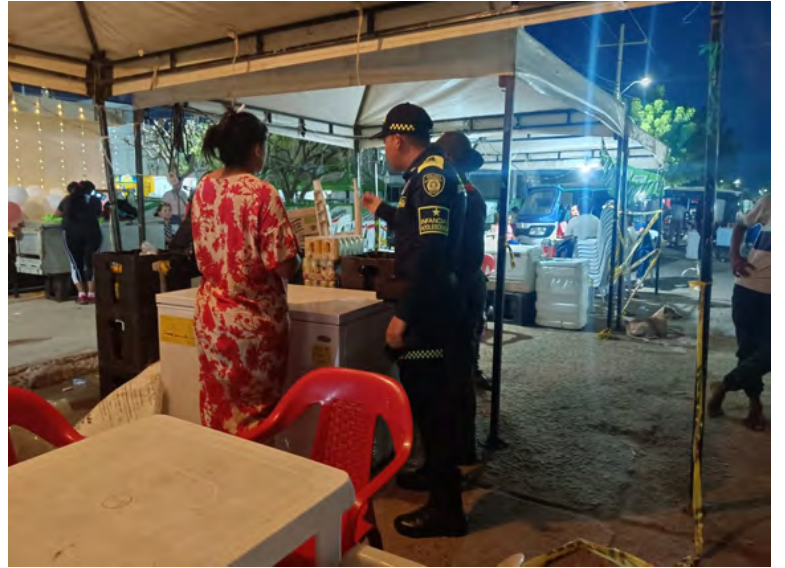
El trabajo infantil roba sueños, infancia y futuro. Erradicarlo es una responsabilidad de todos.

El Grupo de Protección a la Infancia y Adolescencia re-