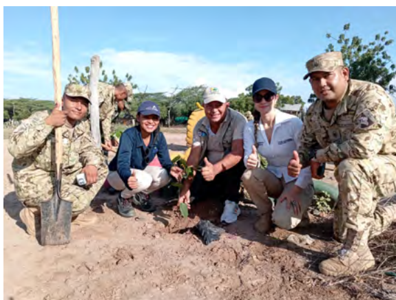
La jornada de arborización en la vereda El Confuso busca fortalecer las áreas verdes y contribuir con el cuidado del recurso hídrico de la comunidad, como parte de las acciones ambientales de Corpoguajira.

Estas acciones son encaminadas por el director general