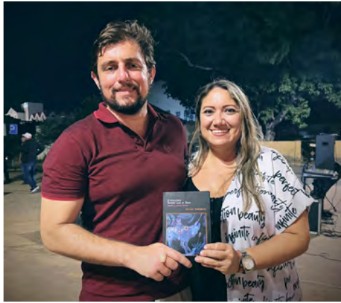
Con el poeta, escritor y artista visual arubiano Arturo Desimone en la velada musical y culinaria en la sede de Stichting Rancho.