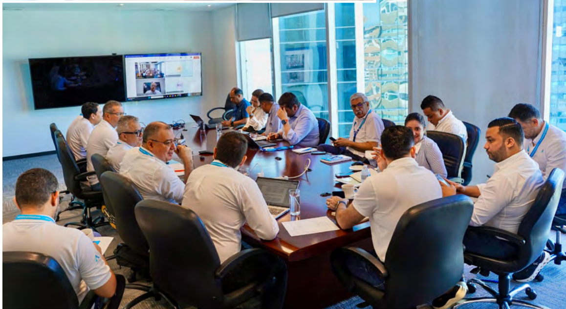
Durante el encuentro, se discutieron temas clave como las dificultades financieras, el impulso de las comunidades energéticas para reducir tarifas y mejorar las relaciones con la comunidad.

servicio de energía a más de 1 millón 300 mil usuarios de los departamentos del Magdalena, Atlántico y Guajira, mientras que la empresa Afinia tiene sus servicios en Sucre, Córdoba, Cesar, Bolívar y 11 municipios del sur del Magdalena, con cerca de 1 millón 500 mil usuarios.