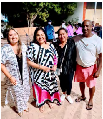
En la velada musical y gastronómica en la sede de Rancho.