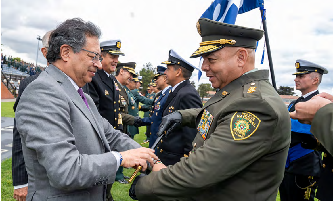
Presidente Gustavo Petro presentó el balance en la lucha contra las drogas durante ceremonia de ascensos militares.

En cualquier caso, concluyó “Colombia no puede seguir siendo centro y antro de la muerte, y por eso profundizar en los procesos de paz se vuelve importante”.