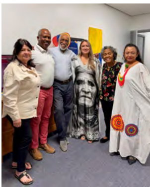
Con asistentes al evento en la Casa del Papiamento el 10 de diciembre.