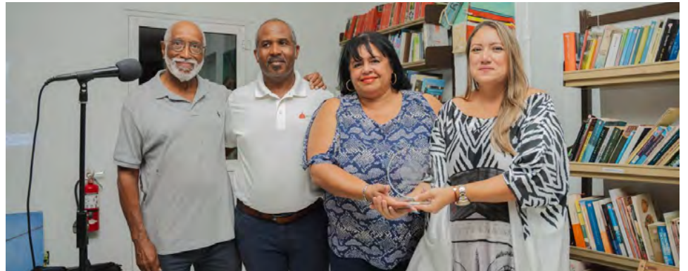
Recibiendo el reconocimiento de Stichting Rancho por las contribuciones culturales a la celebración de los 200 años de Oranjestad.