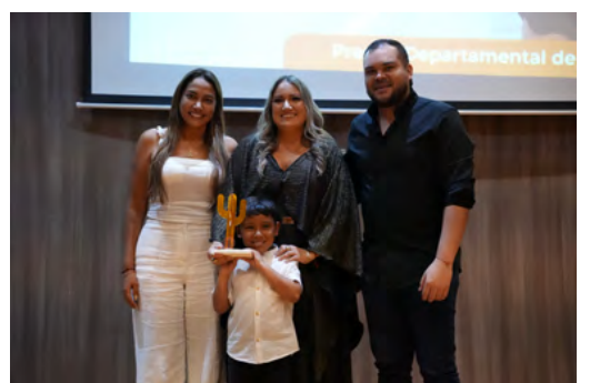
La Gala de Premiación de los Premios Departamentales de Cultura 2024 se llevó a cabo en la Biblioteca Héctor Salah Zuleta, con la presencia de más de 200 invitados y la premiación a los artistas más destacados del departamento.