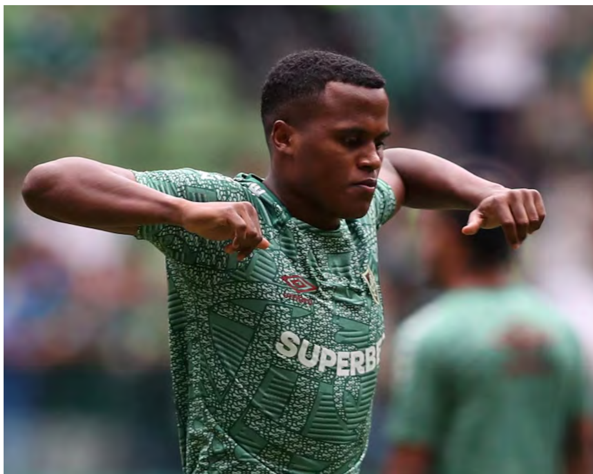
on Arias saldría de Fluminense en el mercado invernal - con destino a Europa.

ranking, es seguido de cerca por Arias y el uruguayo Federico Valverde del Real Madrid, quien ha acumulado 5.573 minutos en 66 partidos. Estos jugadores no solo demuestran resistencia física, sino también su papel crucial en equipos de alto nivel. La presencia de futbolistas experimentados como Virgil van Dijk, Nicolás Otamendi y Granit Xhaka en los primeros lugares del ranking, según el CIES, destaca la importancia de la experiencia en el fútbol moderno.