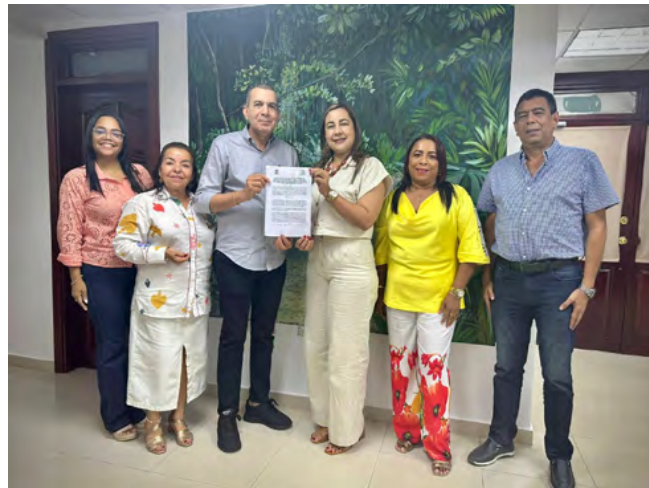
La alianza entre el ICBF y Corpoguajira se enfoca en aplicar procesos pedagógicos diferenciados para los adolescentes en conflicto con la ley, con énfasis en la reparación del daño y la reintegración social.

y mejorando su calidad de vida. El acuerdo también busca asegurar un enfoque restaurativo que promueva la reparación del daño y la reintegración social involucrando las familias.