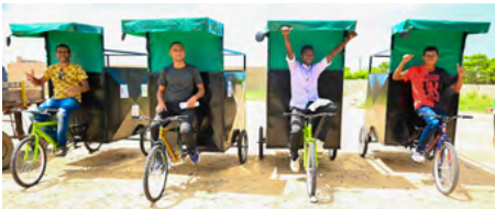
Uniguajira lidera proyecto para reemplazar vehículos de tracción animal por unidades sostenibles