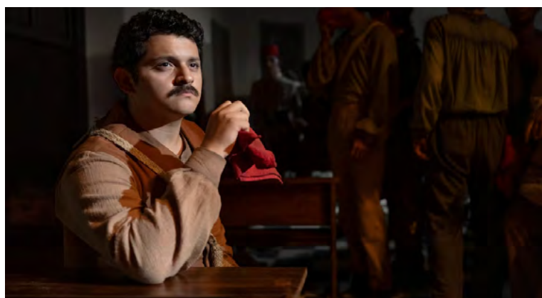
En el séptimo capítulo de Cien años de soledad en Netflix, Arcadio, obsesionado con el poder, es representado en uniforme inspirado en Napoleón, un detalle ausente en la novela que refuerza su autoritarismo y decadencia

Mientras tanto, Aureliano intenta rescatar al coronel Carmona, capturado por los conservadores y mantiene contacto epistolar con Úrsula. En un