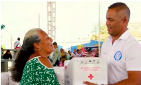
Alcalde de Uribe realizó entrega de ayudas humanitarias a afectados por la ola invernal