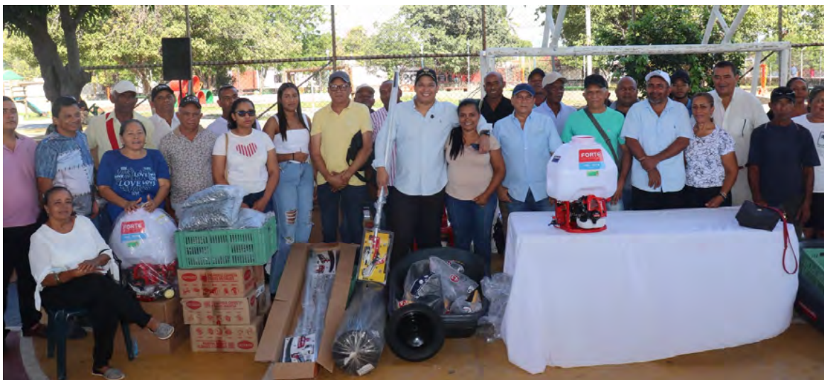
Agricultores de Barrancas reciben implementos para fortalecer su producción de cacao, impulsando la economía local y la diversificación de cultivos.