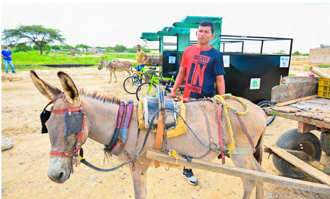
Los animales que impulsaban los vehículos eran sometidos a largas horas de trabajo afectado su bienestar

Desarrollo (Fupad) y la Corporación Socioambiental de Recicladores de la Costa Reciclemos Amor (Corprecam). Así como docentes y estudiantes de la Facultad de Ingeniería, quienes hicieron aportes técnicos y formativos a través de capacitaciones en reciclaje, diseño y soldadura.