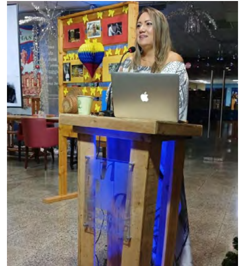
Durante la conferencia en la Biblioteca Nacional de Aruba