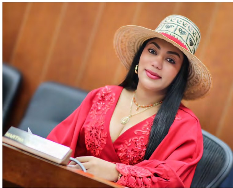
Martha Peralta Epieyú, senadora guajira.

La Guajira no pide privilegios, sino justicia. Las comunidades locales han solicitado