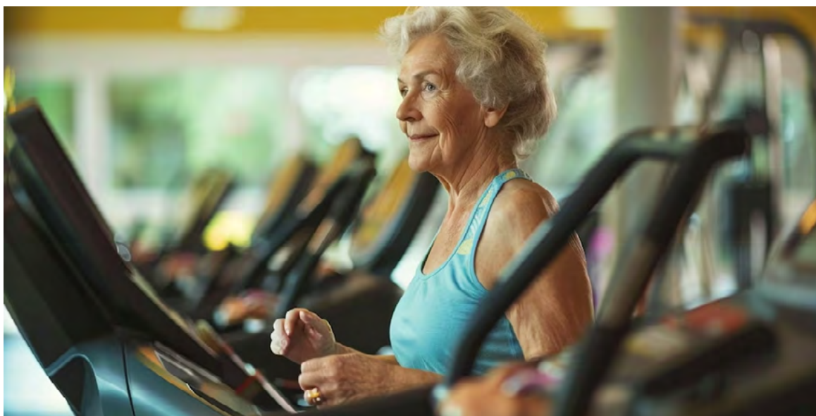
Los participantes realizaron pruebas online para evaluar memoria, atención y velocidad de procesamiento.