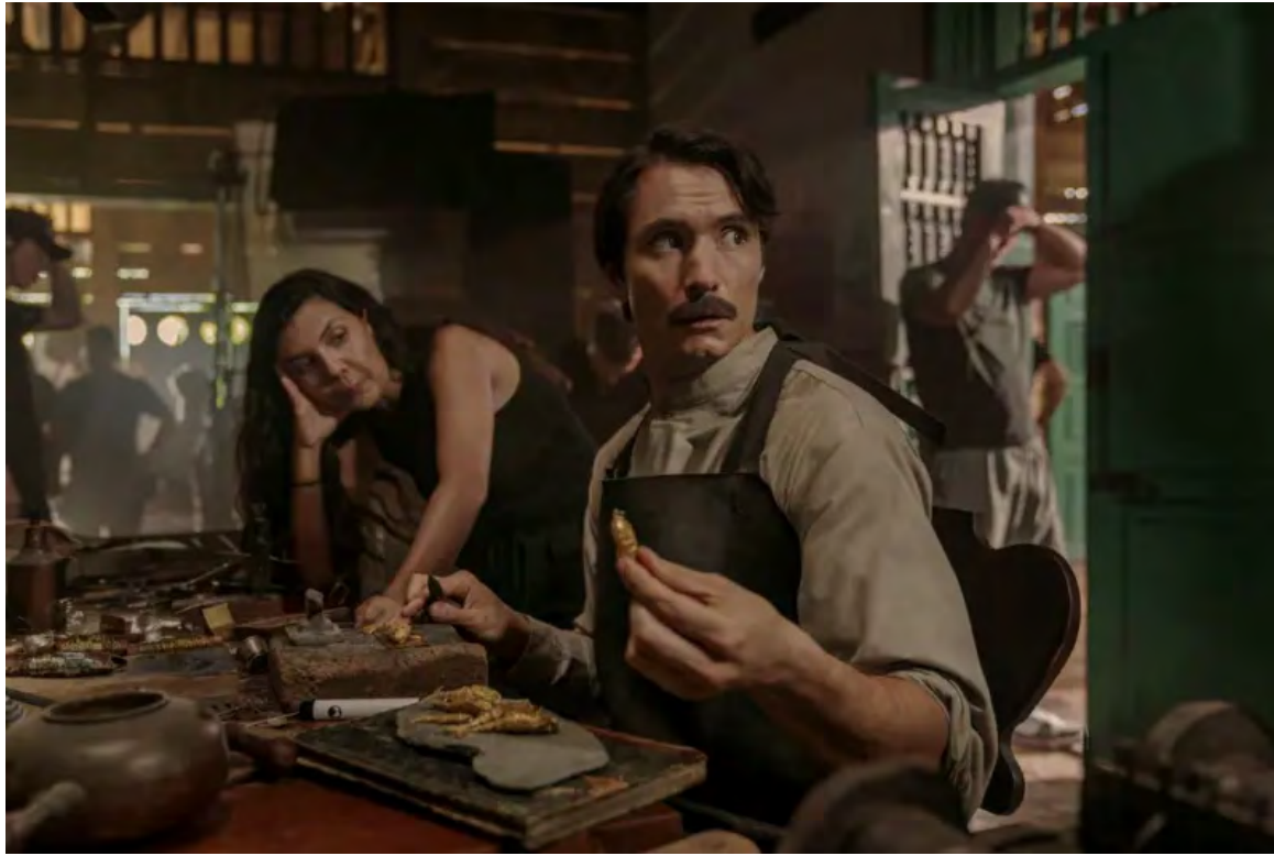
El actor Claudio Cataño interpreta al coronel Aureliano Buendía en la serie.