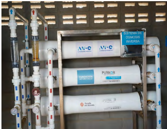
El Proyecto Territorios de Equidad de Air-e Intervenida transforma el acceso al agua potable en Yotojorotshi, La Guajira.

Hace un año, las familias de Yotojorotshi y tres comunidades más de la zona rural del municipio de Maicao, pueden abrir la llave y acceder al agua potable gracias al programa 'Territorios de Equidad', liderado por Air-e Intervenida en