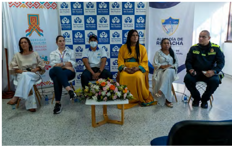
Riohacha avanza hacia la inclusión: un espacio de diálogo y reflexión para garantizar los derechos de todas las orientaciones e identidades.

de dicho sectores y agremiaciones en la capital de La Guajira. "Seguimos trabajando para