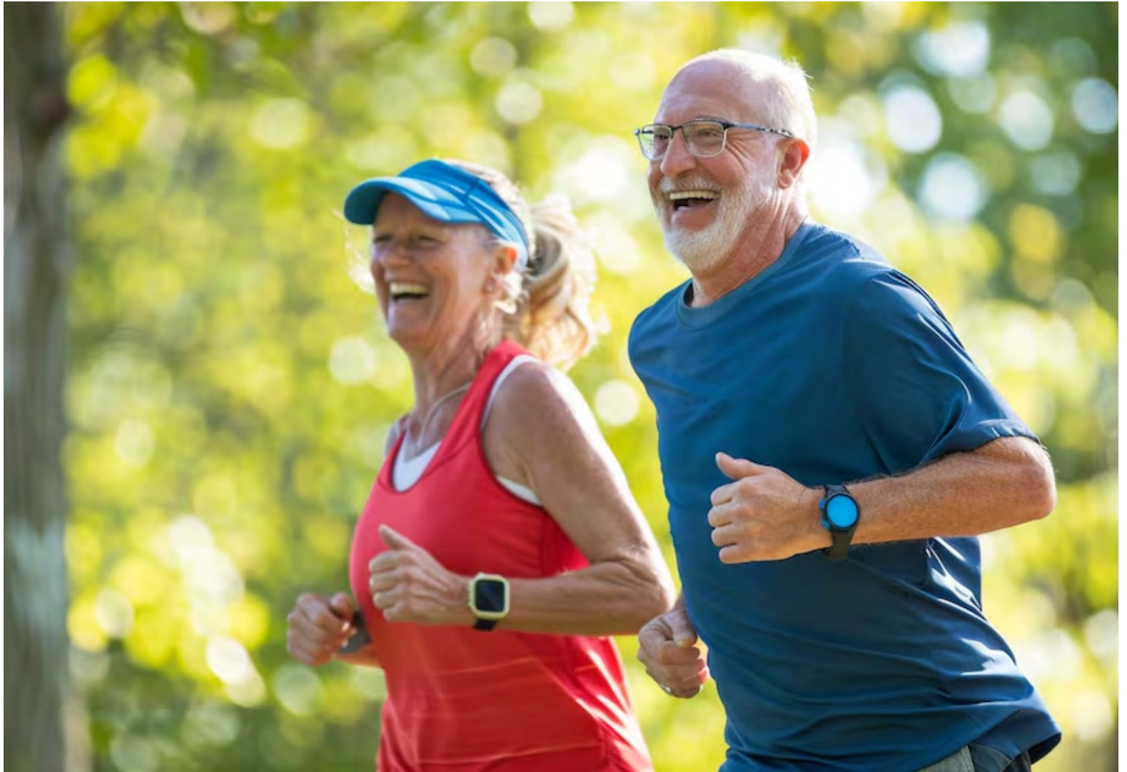
Un estudio del University College London analizó los efectos a largo plazo del ejercicio en la memoria y atención.

A diferencia de investigaciones anteriores, realizadas en entornos controlados de laboratorio, este análisis se llevó a cabo en la vida cotidiana de