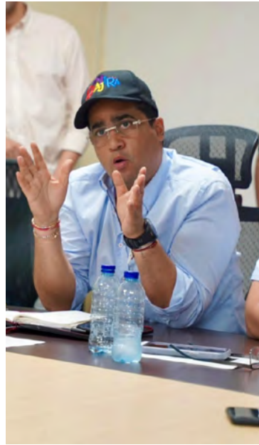
Gobernador de La Guajira, Jairo Aguilar.

Cuestionó la “ambivalencia” en el discurso del Gobierno Nacional, que ha señalado a La Guajira como epicentro de las políticas de transición energética, pero que en este caso estaría dejando de lado al departamento como base de operaciones. “¿Cómo es posible que se hable de La Guajira como eje