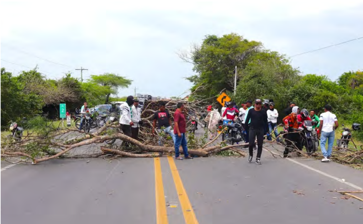
"Bloqueos en La Guajira afectan la movilidad, seguridad, turismo y economía de la región.