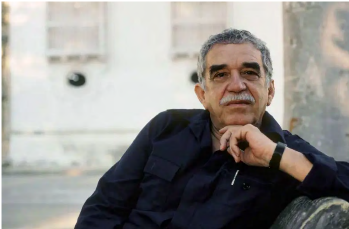
Gabriel García Márquez no quiso que su obra maestra fuera adaptada al cine.