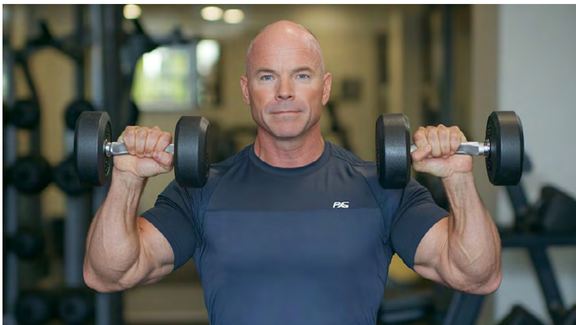
Expertos proponen que el ejercicio puede mantener la mente activa con el envejecimiento poblacional creciente

los participantes. Esto permitió a los científicos observar el impacto real del ejercicio diario.