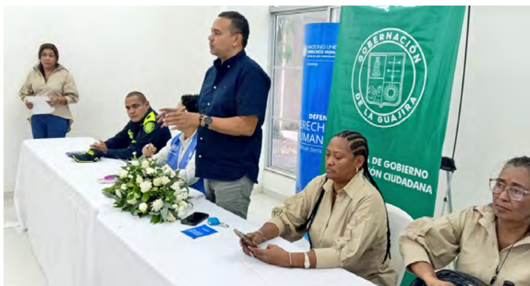
En La Guajira, instituciones y comunidades se unieron en el Día Internacional de los Derechos Humanos, reafirmando su compromiso con la vida, la libertad y la dignidad de todos.

También la Policía Nacional del departamento afirmó que