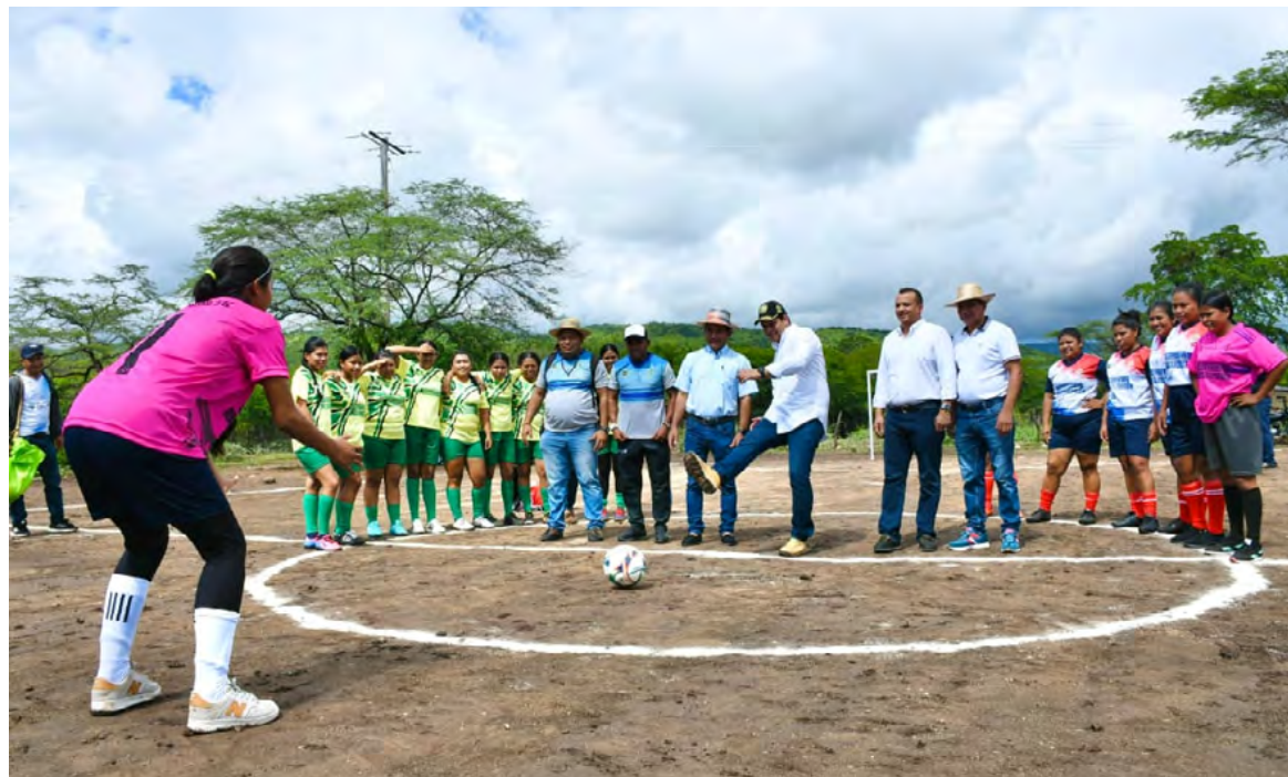
Barrancas honra la herencia Wayuu en los Juegos Ancestrales, promoviendo el deporte y la identidad cultural entre 13 comunidades.

“La Administración Municipal de Barrancas, reafirma su compromiso con la unión de los pueblos y territorios indígenas a través del deporte, la cultura y la tradición. Estos juegos ancestrales son una oportunidad para celebrar la riqueza cultural y deportiva de nuestra comunidad, y para fortalecer la identidad y la unidad entre nuestras comunidades”, finalizó la administración.