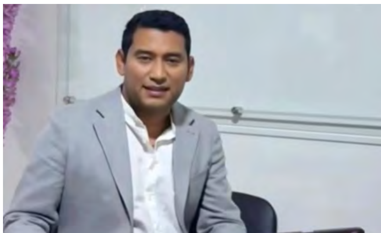
Miguel Felipe Aragón, alcalde de Maicao

Más de 1.000 familias maicaeras serán beneficiadas en el proyecto de las granjas solares, que presentó la alcaldía de Maicao ante el Ministerio de Minas y Energías.