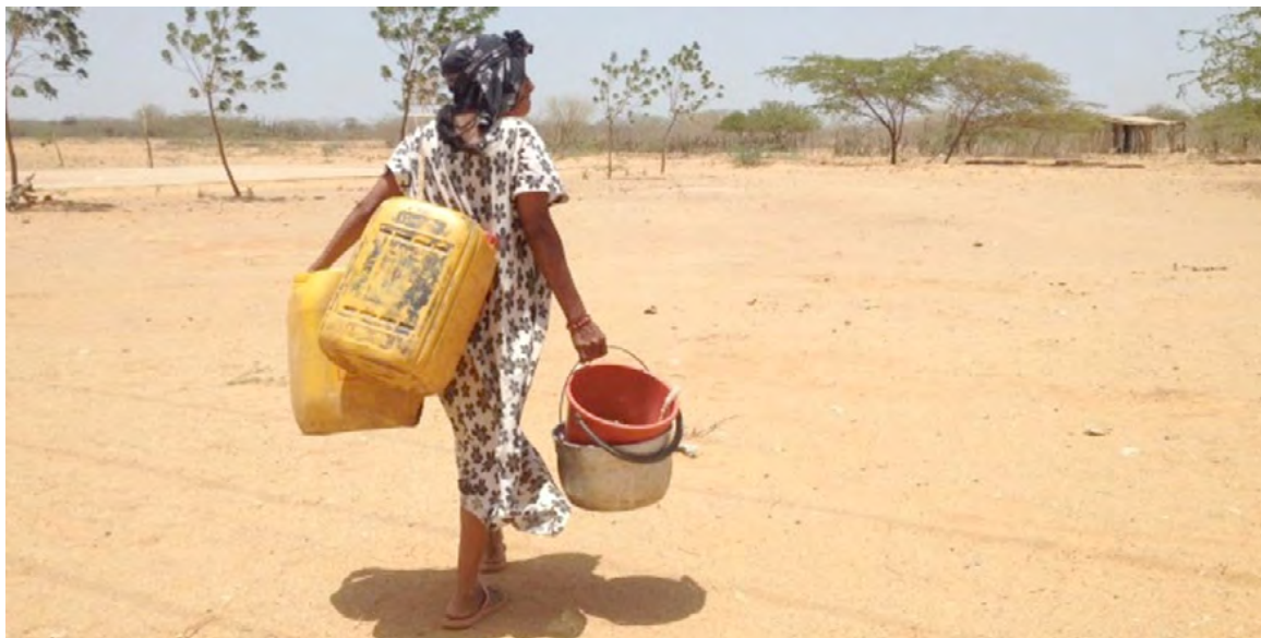
Así es la realidad de los wayuu, a pie o en burro

Es más fácil que bloqueen la vía de Cerrejón. No les interesa el impacto interno y externo que esto genera en la empresa; su misión es que sus cuentas no se cierren y que el dinero que obtienen siga multiplicándose.