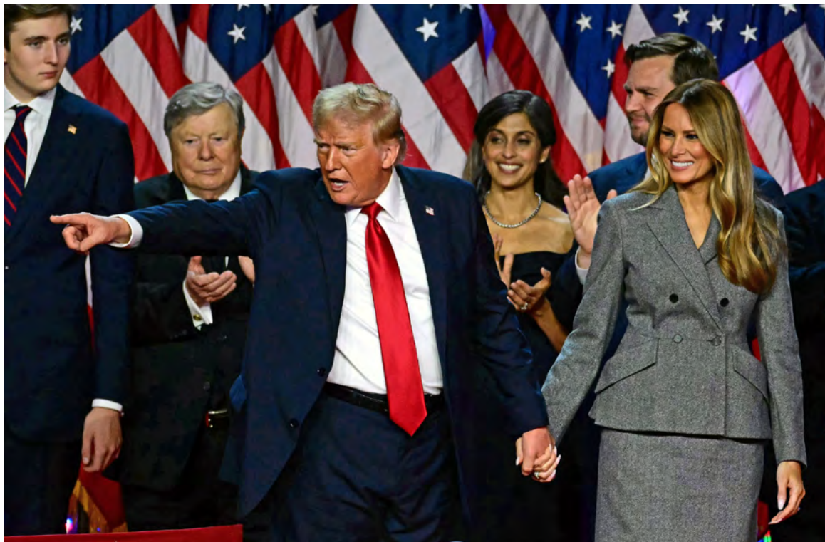
Donald Trump gana el decisivo estado de Pensilvania y se asegura la presidencia de EE.UU. por segunda vez

El sistema de elección estadounidense, basado en el Colegio Electoral, mantiene una representación indirecta en la elección presidencial. Aunque este modelo tiene orígenes históricos, algunos cuestionan su