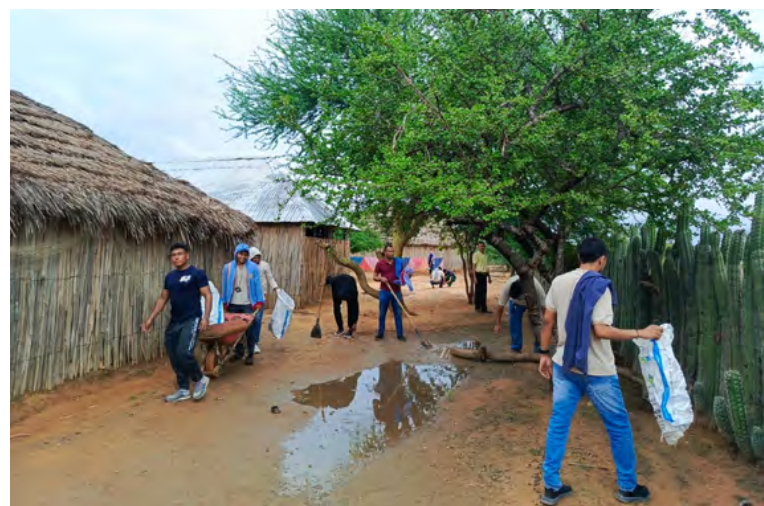
Corpoguajira embellece el ecoparque en Mapuain, Uribia, fortaleciendo la educación ambiental en La Guajira.

Hay que indicar que este tipo de actividades buscan generar impacto en el entorno ambiental, teniendo como base a los estudiantes de las instituciones educativas en La Guajira.