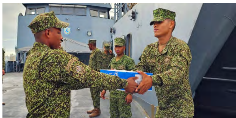
La Guajira activa Fondo de Seguridad Alimentaria junto al PMA para socorrer a familias afectadas por la ola invernal

La Gobernación de La Guajira, en alianza con el Programa Mundial de Alimentos (PMA), ha activado por primera vez el Fondo de Seguridad Alimentaria y Nutricional para atender de manera urgente a las familias afectadas por la ola invernal. Este fondo garantiza asistencia