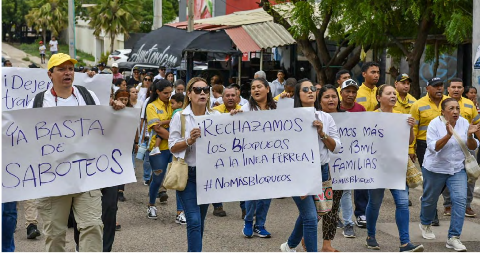
Familias de los trabajadores de cerrejon pidiendo respeto

Hoy existen pocas poblaciones indígenas que, con el tiempo, han ganado lo que no perdieron. Las pocas que quedan siguen siendo usadas y esclavizadas para la conveniencia de los "más vivos". Triste realidad. Las pocas que se mantienen, como los wayuu, no lo logran porque la mayoría de los que supuestamente luchan por sus derechos así lo desean. Claro que no. Muchos saben que el tiempo tiene una deuda con los indígenas y ven la oportunidad de esclavizarlos para sus propios intereses, buscando revertir el desastre que crearon, al igual que la Iglesia en tiempos pasados condenó a Jesús en la cruz y luego lo usó para ganar los privilegios que hoy tiene. Así ocurre con las pocas poblaciones indígenas que aún existen. Luego de casi ser exterminadas, hoy se han creado miles de asociaciones y fundaciones, supuestamente luchando porque estas se mantengan, cuando en realidad sucede lo contrario. Es una paradoja. Estas entidades prosperan de la ignorancia y necesidad del paisano wayuu, ya que, si se hace un balance, podemos ver cómo siguen los paisanos con hambre, sin futuro, sin agua, sin educación, sin oportunidades, mientras los de las fundaciones y asociaciones viven cómodamente, con cuentas bancarias llenas.