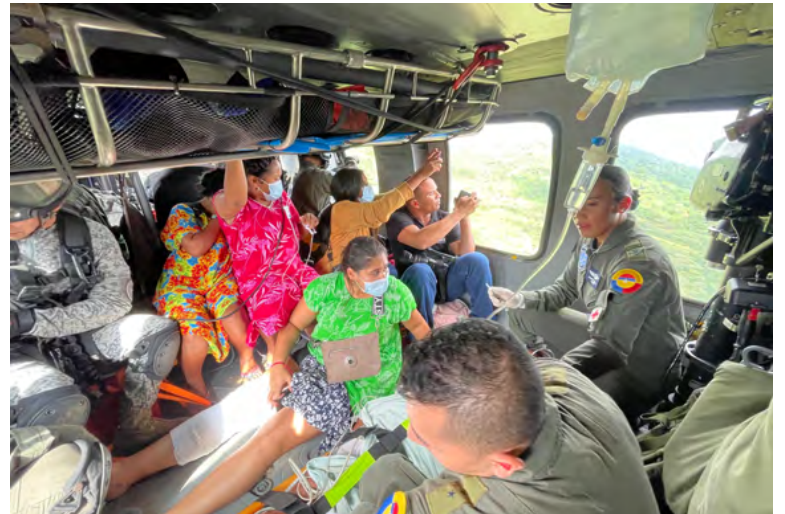
Apoyo aéreo y humanitario en La Guajira: Gobernación y fuerzas militares trasladan a siete pacientes wayuu y coordinan ayuda alimentaria a comunidades afectadas por las lluvias.