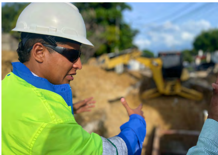
Aqualia realiza reparación temporal de colector en Riohacha para mitigar rebosamientos de aguas residuales en Las Tunas.

Los trabajos incluyeron demolición del pavimento, remoción de materiales y reparación de 12 metros de tubería de asbesto cemento de 27 pulgadas de diámetro. El colector está ubicado a 6 metros de profundidad, y la labor se completó