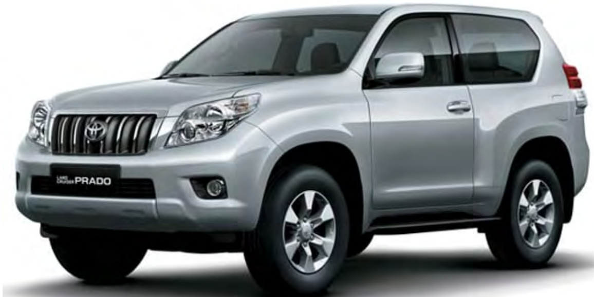
El carro de los defensores de los derechos humanos wayuu también