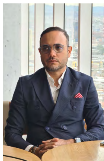
Senador Alfredo Deluque

El senador enfatizó en la necesidad de dar respuesta inmediata a los reclamos ciudadanos, destacando que, si