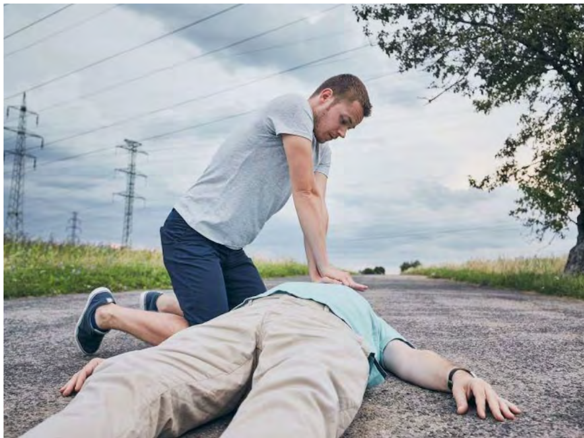
El estudio destaca la importancia crucial de la rapidez con la que se realiza la RCP en un paro cardíaco fuera del hospital

ridos en Estados Unidos entre 2013 y 2022. La investigación se centró en evaluar cómo el tiempo de inicio de la RCP por transeúntes influye en la supervivencia y el estado neurológico de los pacientes tras el alta hospitalaria. De la muestra, la edad promedio fue de 64 años y, aunque más del 9 % de los casos involucraban a mujeres, la mayoría eran hombres.