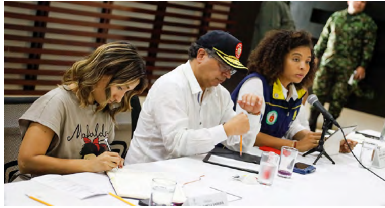
El presidente Gustavo Petro lidera el puesto de Mando Unificado en Quibdó, Chocó.

- 1.666 eventos climáticos, entre incendios forestales (60%), vendavales (14%), deslizamientos (11,2%) e inundaciones (10,4%), afectando a los