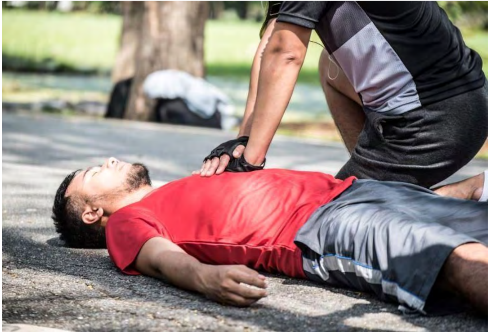
Según una investigación, la velocidad con la que un testigo inicia la RCP puede marcar la diferencia entre la vida y la muerte

Este análisis abarca un total de 160.822 casos de paros cardíacos extrahospitalarios ocu-