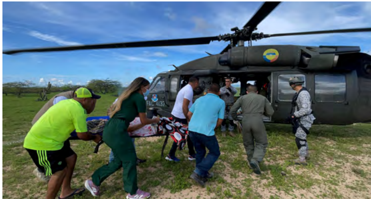
La Guajira evacúa a pacientes wayuu en helicóptero de la Fuerza Aérea para atención médica prioritaria, mientras se distribuyen 120 toneladas de alimentos a damnificados por emergencia invernal.