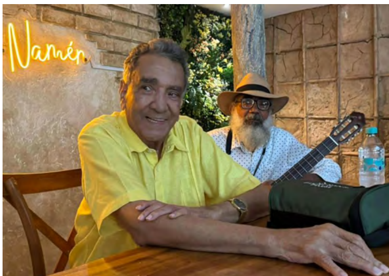
Camilo Namén presentó en Valledupar un interesante trabajo musical que incluye 13 canciones