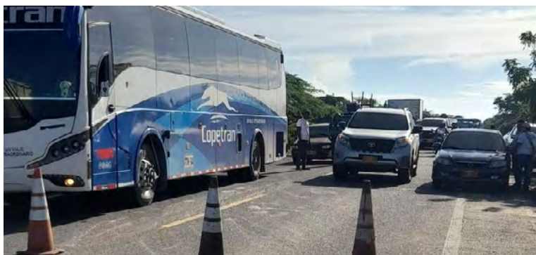
Los bloqueos en las diferentes vías del departamento de La Guajira, son el pan de cada día.

gobierno departamental para que establezcan un protocolo especial y diferencial que permita atender la conflictividad en La Guajira de manera efectiva.