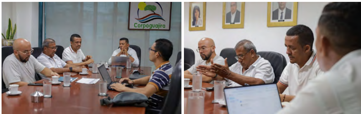
Corpoguajira liderará la Décima Mesa de Erosión Costera en Palomino para presentar avances en la protección del litoral guajiro.

Recursos Acuáticos del ministerio de Ambiente y Desarrollo Sostenible; de la Unidad Nacional de Gestión del Riesgo; de la Gobernación de La Guajira; de la alcaldía de Dibulla; de la Universidad Nacional; de la Red Universitaria de las