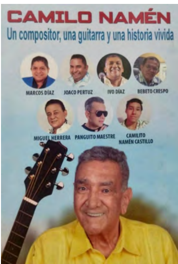
Carátula producción musical de Camilo Namén