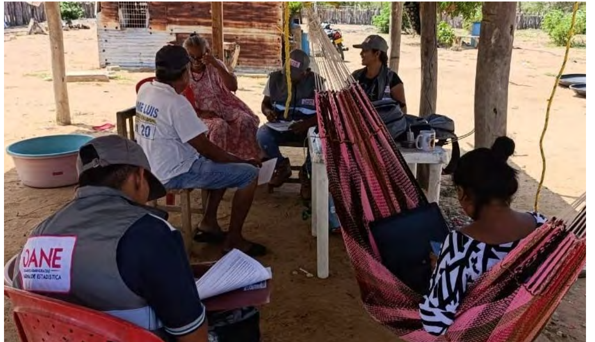
Después de intensas jornadas de recolección del Registro Wayúu en los cascos urbanos de Riohacha, Manaure, Maicao y Uribia, marcando la implementación de la Sentencia T-302 de 2017, el DANE alcanzó un hito importante: comienza la operación en las zonas rurales de estos municipios.

del Registro. La participación de la comunidad, respondiendo al cuestionario, es esencial para contribuir a una comprensión más completa y detallada de sus condiciones de vida. Esta información será invaluable para la formulación de políticas y programas que atiendan efectivamente las necesidades de la población wayuu”, finalizó la entidad.