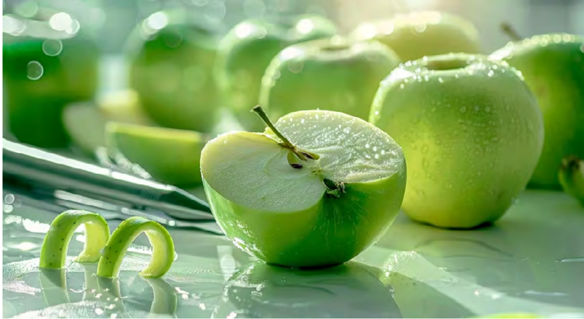
La fibra soluble en las manzanas ayuda a reducir el colesterol LDL

La manzana es eficaz para reducir los niveles de colesterol gracias a su alto contenido de fibra soluble, principalmente la pectina. Esta fibra se une al colesterol en el tracto digestivo y lo expulsa del cuerpo, reduciendo la cantidad de colesterol LDL (colesterol malo) en la sangre. Además, los antioxidantes presentes en las manzanas, como