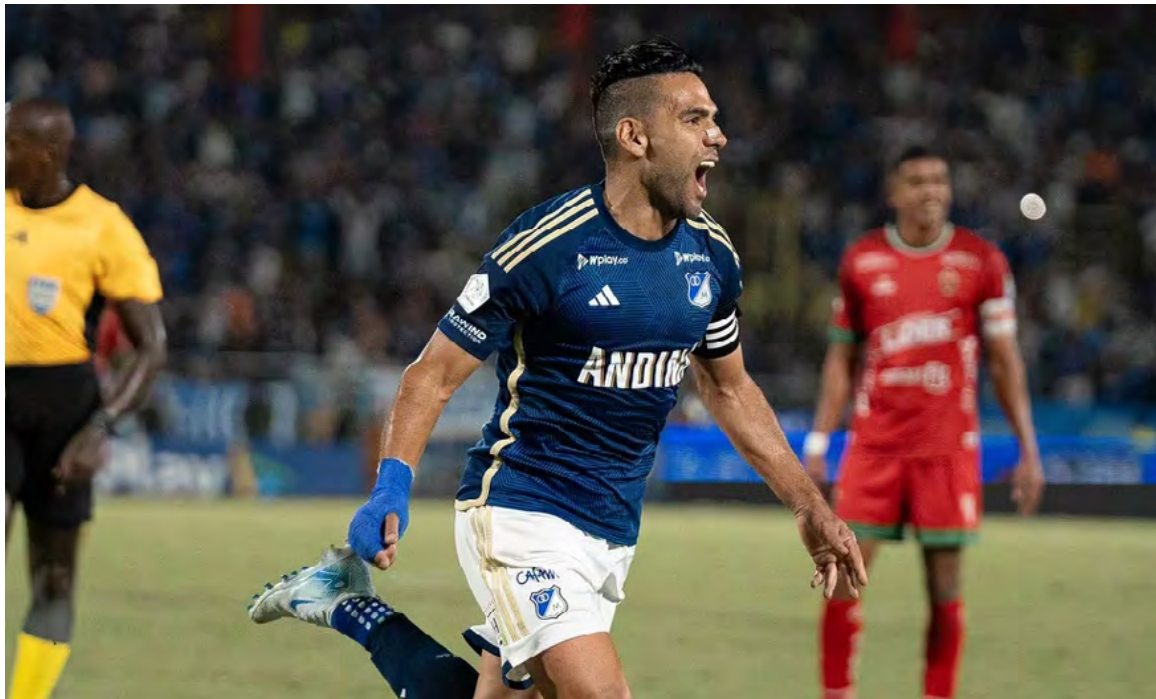
Falcao García llegó como figura a Millonarios en 2024 y suma un gol en seis juegos

En el momento en que Falcao fue anunciado con los azules, buena parte del acuerdo se dio por la gestión no solo de la institución, sino de sus patrocinadores para cumplir el sueño de los aficionados y el delantero, que negoció por tercera ocasión