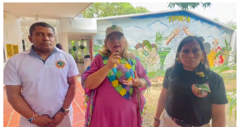
Astrid Cáceres Cárdenas, directora general del Instituto Colombiano de Bienestar Familiar (ICBF).

“Esta alianza permitirá mostrar al país un trabajo consensuado que se viene realizando hace un año en este departamento con las comunidades, así como sistematizar los aprendizajes de su cultura y ancestralidad, en el que hemos realizado un ejercicio demostrativo que refuerza la respuesta integral”,