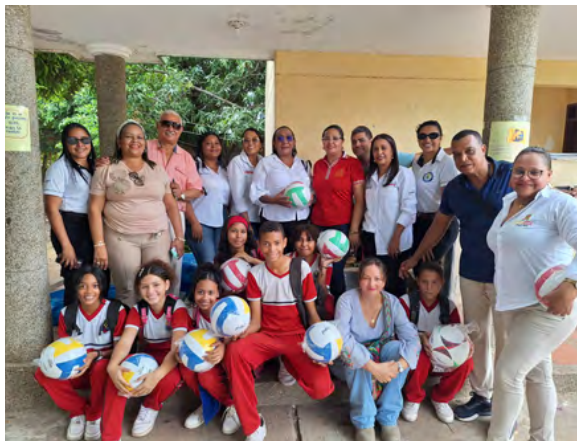
La ART entregó dotaciones educativas en 9 instituciones, mejorando la calidad escolar en áreas urbanas y rurales del municipio.

Casi como en prosa, el líder comunitario añadió: "Yo me siento asombrado que, por primera vez en la historia de mi