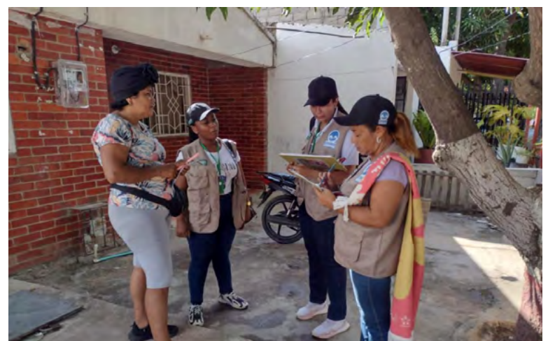
Equipos de salud realizan jornadas para controlar el mosquito transmisor y educar a las comunidades sobre medidas de prevención casa a casa.

autoridades en la identificación y eliminación de posibles criaderos de mosquitos en sus hogares.