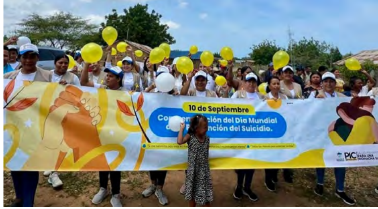
Autoridades locales y profesionales de la salud realizan jornada integral para prevenir el suicidio, con un enfoque étnico wayuu y el apoyo de diversas entidades.