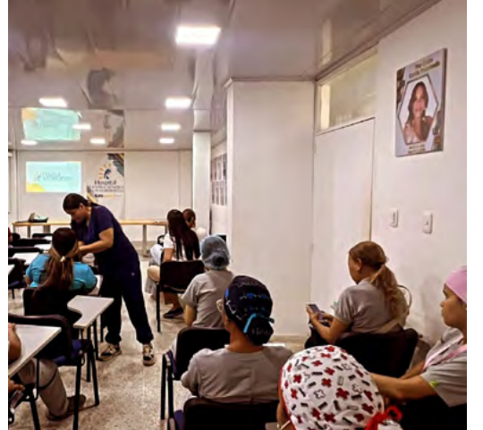
Riohacha avanza en el apoyo a víctimas del conflicto con nuevas acciones del Programa Papsivi, liderado por la ESE Hospital Nuestra Señora de los Remedios.

El objetivo es garantizar la correcta elección de candidatos para el año 2024