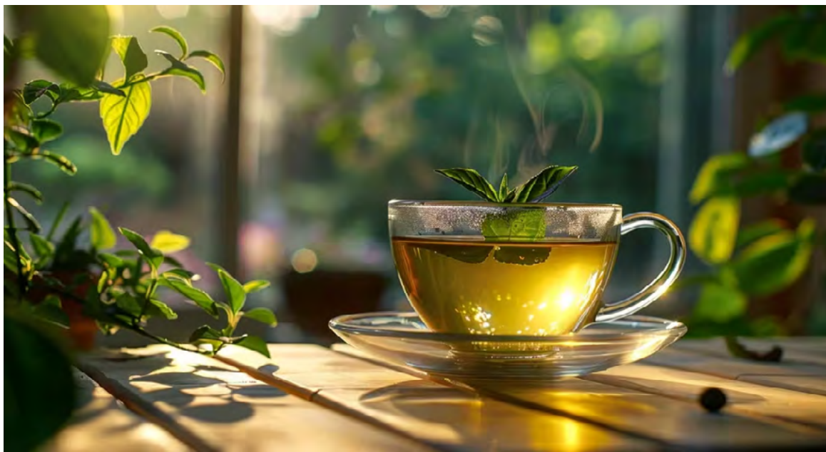
Investigaciones recientes destacan que ciertos alimentos y bebidas, como bayas y té verde, pueden reducir el riesgo de demencia

La investigadora principal del estudio, la profesora Aedin Cassidy, afirmó: "La prevalencia mundial de la demencia sigue aumentando rápidamente. En este estudio de cohorte basado en la población, analizamos datos dietéticos de más