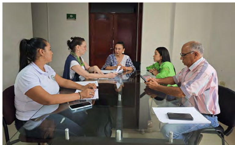
La Jagua del Pilar y El Plan reciben nuevas colecciones y tecnología a través del Programa Nacional de Bibliotecas Itinerantes, impulsando el acceso a la cultura y la lectura en zonas rurales.

El municipio de La Jagua del Pilar y El Plan fueron seleccionados entre las 30 comunidades rurales beneficiadas por el Programa Nacional de Bibliotecas Itinerantes (PNBI) 2024, impulsado por el Ministerio de Cultura y la Biblioteca Nacional de