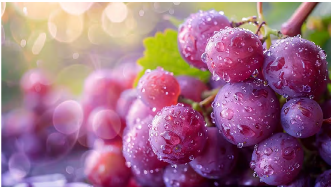
Alimentos como uvas, cítricos, brócoli y té verde contienen altos niveles de flavonoides beneficiosos

de 120.000 adultos de entre 40 y 70 años del Biobanco del Reino Unido. Nuestros hallazgos muestran que consumir seis porciones adicionales de alimentos ricos en flavonoides por día se asoció con un riesgo 28% menor de demencia. Los hallazgos fueron más notorios en individuos con un alto riesgo genético, así como en aquellos con síntomas de depresión".