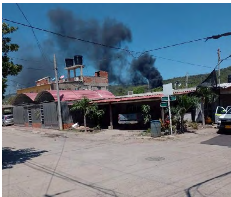
El fuego fue controlado por el personal militar y brigadas de emergencia.

Tras controlar la situación, se estableció que las altas temperaturas pudieron provocar una chispa que encendió la vegetación seca del lugar. Las cuadrillas lograron combatir el fuego, evitando que se extendiera a las laderas cercanas, y evitando así mayores pérdidas.