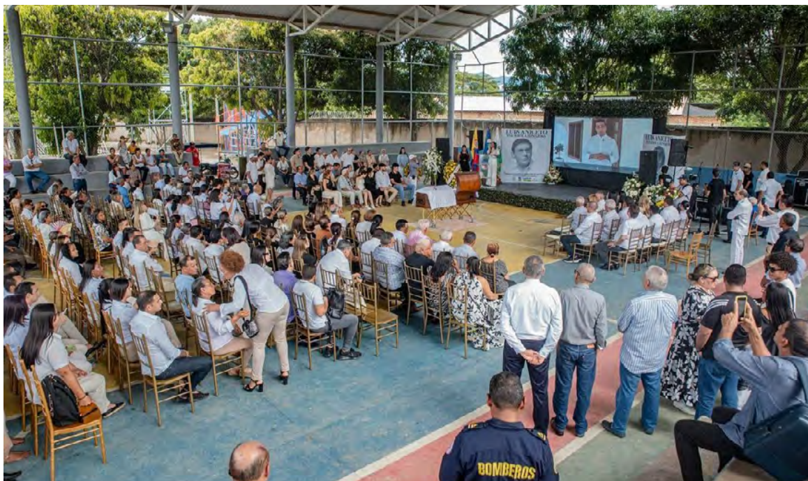
San Juan del Cesar despidió con honores al compositor Luis Egurrola, ícono del vallenato.

"Por siempre en el corazón de tu pueblo Luisón. Gracias por tu legado. Dejas una huella imborrable en la cultura y en nuestros corazones", afirmó el burgo- maestre en sus redes sociales.