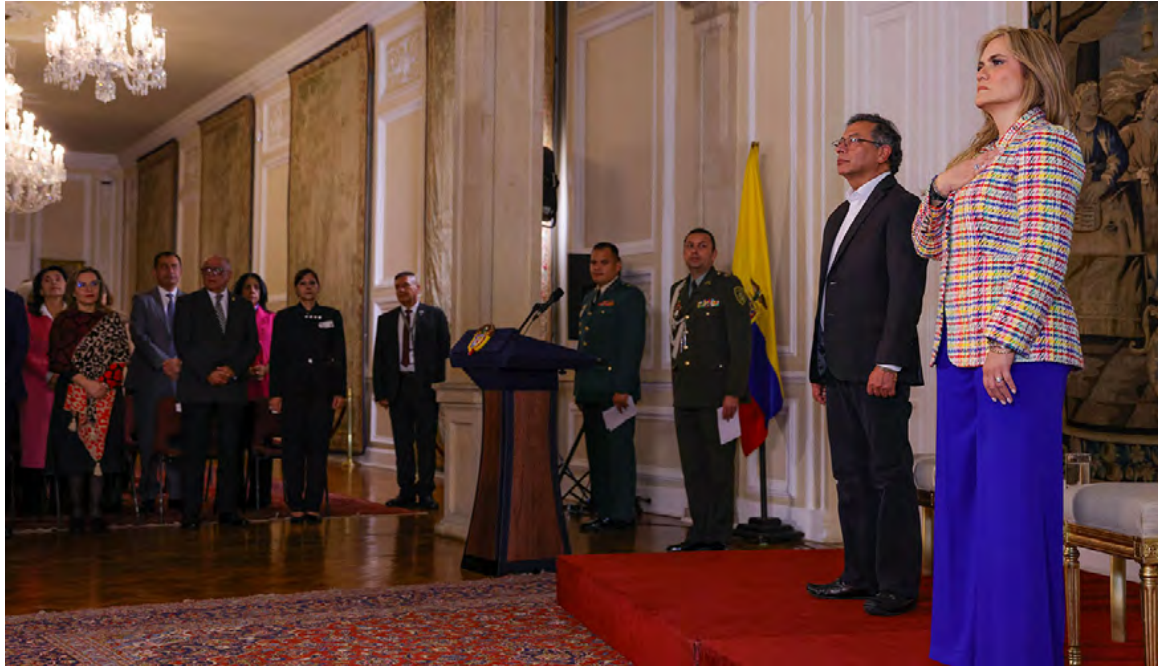
El presidente Gustavo Petro anunció que se trata de uno indígena y otro afrodescendiente.

Uno de los grandes vacíos que señaló el presidente Petro es la ausencia en la Sala de los Presidentes, donde están los retratos de todos los mandatarios del país, de los dos únicos