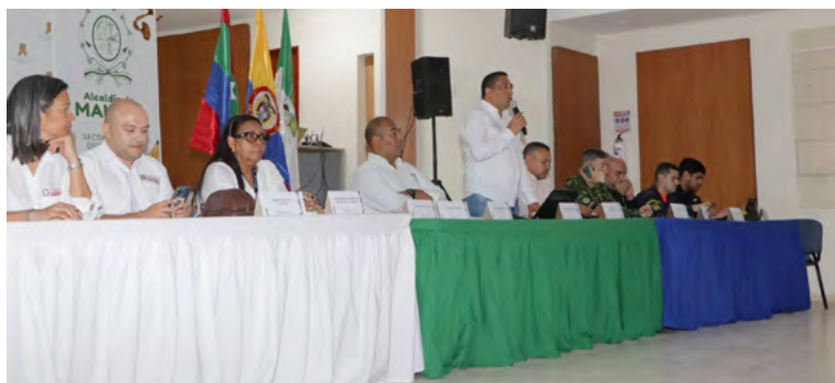
Autoridades locales, departamentales y nacionales se reunieron para hacer seguimiento a los acuerdos de la Subcomisión de Vigilancia Especial para Maicao, destacando temas clave como seguridad, migración y comercio.

Temas como Etnias, Sentencia T302, migración, educación, Régimen Aduanero Especial, comercio, seguridad, economía popular, seguridad en las carreteras que conectan con el municipio y transporte fueron los temas abordados por los asistentes, lo que derivará a mesas