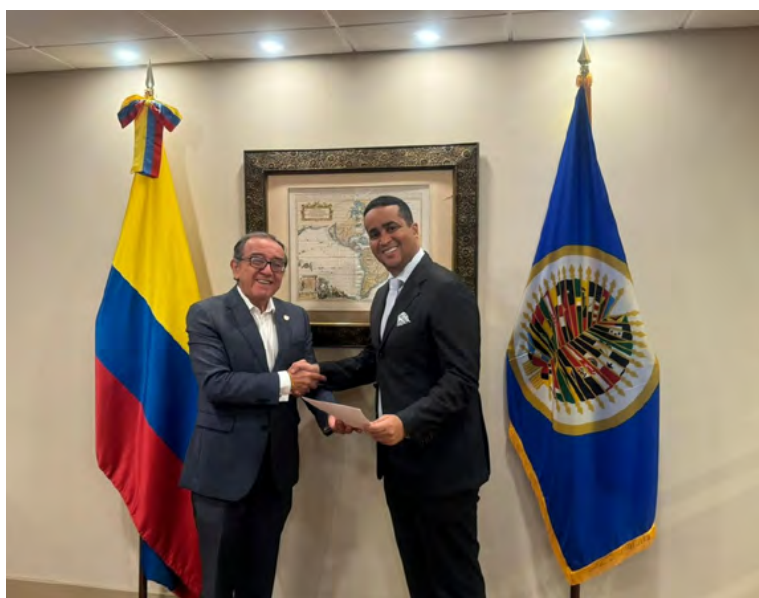
El gobernador Jairo Aguilar gestionó apoyo internacional para el acceso al agua en La Guajira, en alianza con la OEA y en nombre del pueblo wiwa.

De igual manera, advirtió Jairo Aguilar que “durante este encuentro, reforzamos la cooperación internacional en temas vitales para garantizar el acceso al líquido, atendiendo la petición del pueblo wiwa de llevar su voz a este escenario para promover que su territorio sea un espacio de paz y de cuidado del agua”.