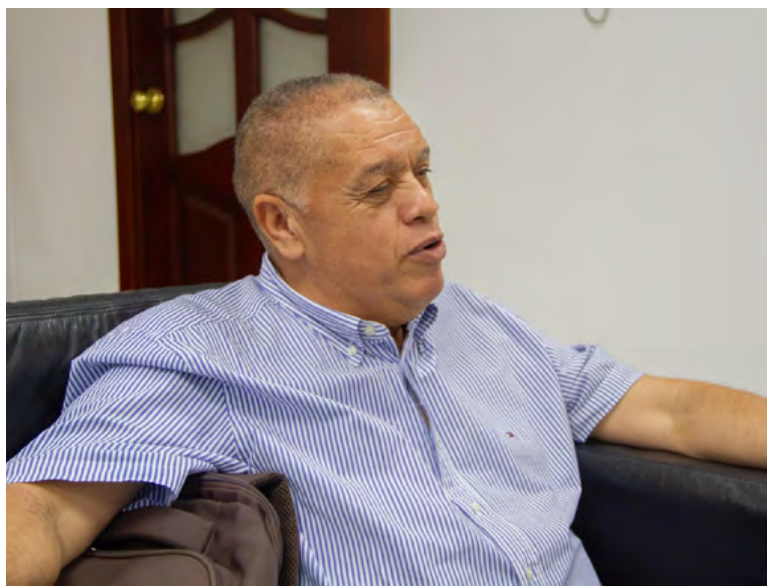
Jacob Arnaldo Brito, alcalde de Distracción.