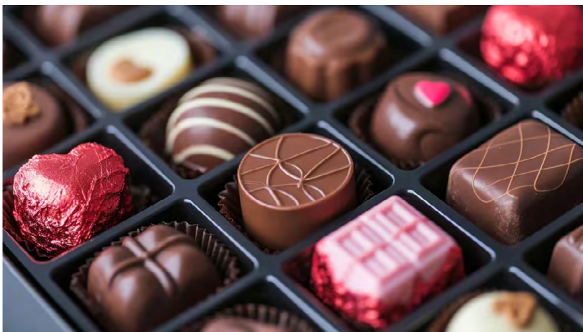
Seis porciones adicionales de alimentos ricos en flavonoides al día, entre los que se encuentra el chocolate, se asocian con menor riesgo de demencia