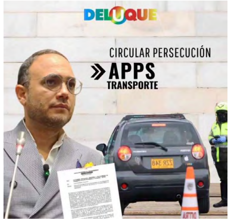
Senador Alfredo Deluque.

adaptarse a las transformaciones sociales que trae la tecnología en lugar de prohibir o sancionar estas plataformas.