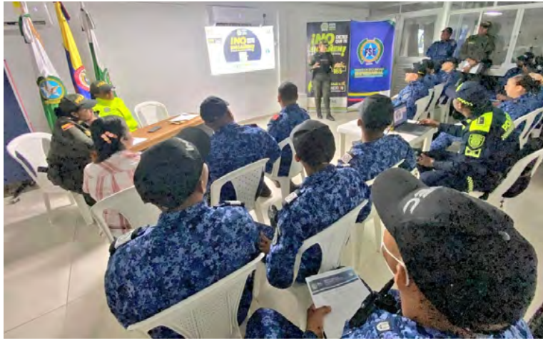
El Gaula de la Policía Nacional refuerza acciones contra la extorsión en La Guajira con la campaña 'No dejes que te engañen, córtale la conexión a la extorsión, cuelga y marca 165'.

De igual manera, los uniformados aprovecharon para