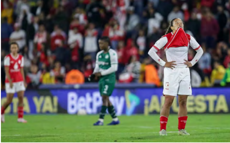
Desde su inicio en 2017, la Liga Femenina ha tenido distintas peticiones y exigencias para que dure más de un semestre

empezó a disputarse en 2017, muchos sectores tanto del fútbol colombiano como de la sociedad pidieron que el torneo se jugara más tiempo, pues en promedio ha tenido una duración de tres a cuatro meses en sus ocho ediciones.