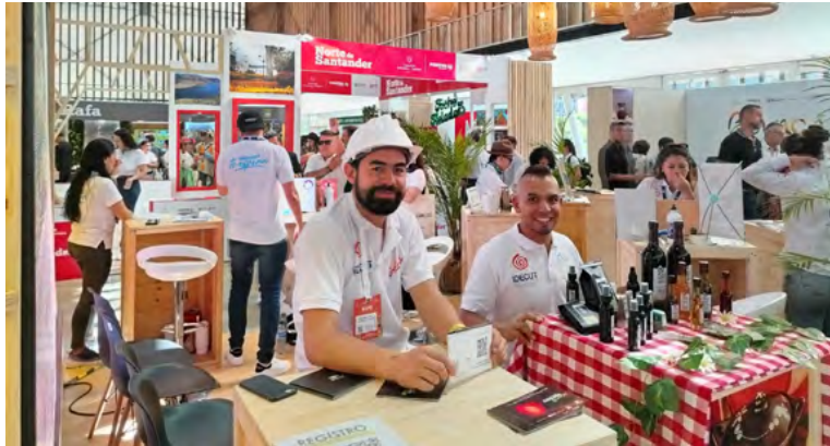
Maicao fortaleció su potencial turístico en la Séptima Feria Expo Travels 2024, destacando su oferta ecoturística y estableciendo alianzas con agencias de varias regiones del país.

Una de las premisas del gobierno de Miguel Felipe Aragón González, es que Maicao, sea un destino turístico nacional e internacional por lo que se aprovechan este tipo de espacios que propician mostrar porque el municipio es un destino