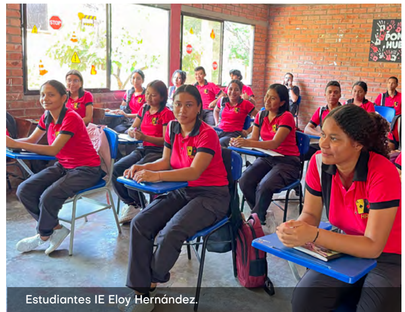
Estudiantes IE Eloy Hernández.

compromiso de fortalecer la permanencia académica el proceso formativo de los jóvenes de la región. De las zonas que más lo necesitan.