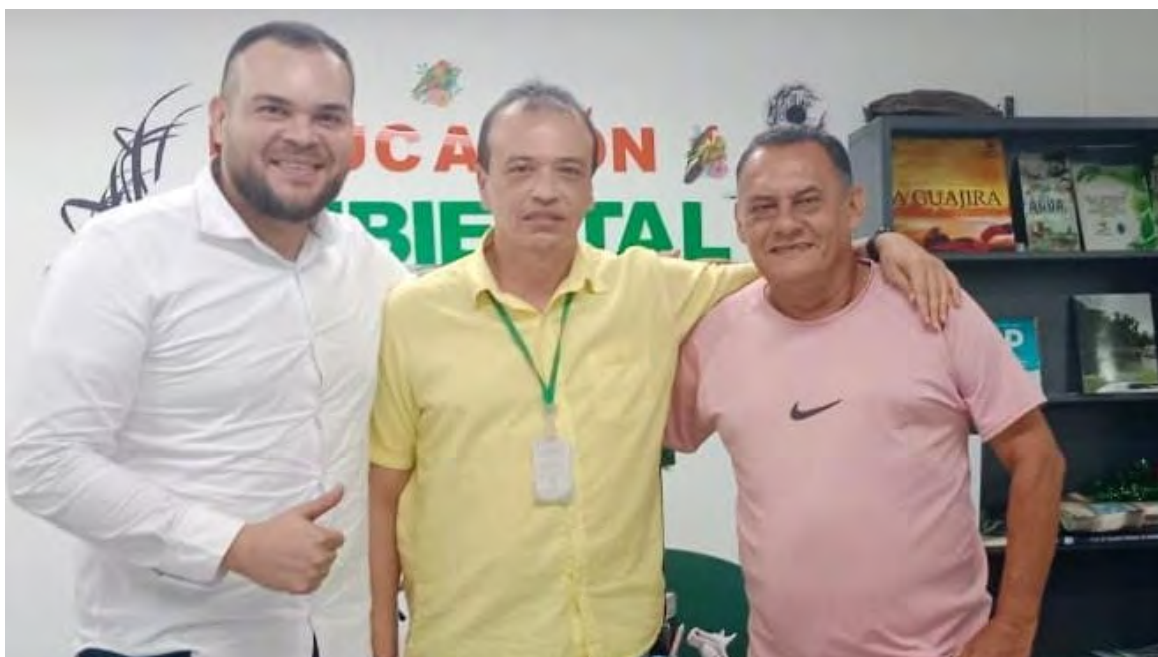
Corpoguajira y Fondo Mixto se unen para promover una cultura ambiental y conservar los recursos naturales en La Guajira.