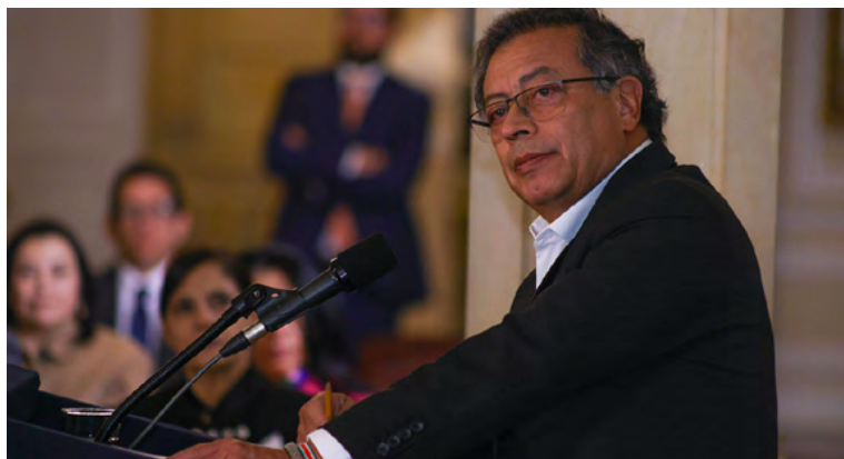
Gustavo Petro, presidente.

Y sostuvo: "Yo lo que siento, y tengo que confesarlo, es que pareciera que si un presidente dice y actúa en función de que un viejo tenga un plato de sopa, en función de que los niños ten-