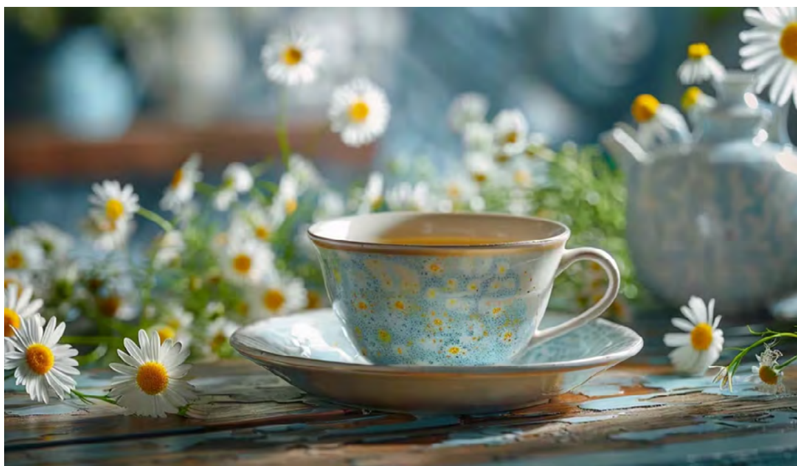
La manzanilla es un aliado poderoso para el hígado, ayudando a eliminar toxinas y bacterias.