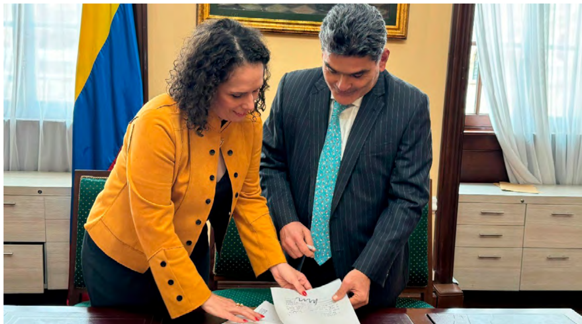
La ministra de Transporte, María Constanza García, radicó el proyecto de Ley Ferroviaria ante el Secretario General del Senado, Gregorio Eljach.

Esta apuesta, liderada desde el Ministerio de Transporte, busca fortalecer la intermodalidad del transporte en Colombia, reducir los costos de operación, mejorar la conectividad de centros de producción y consumo, dinamizar las economías regionales y diversificar la matriz de transporte de carga, promoviendo la complementariedad del modo carretero y férreo.