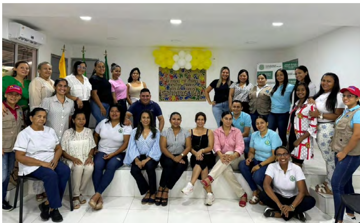
En La Jagua del Pilar, la Secretaría de Salud conmemoró el Día Mundial para la Prevención del Suicidio con una jornada de sensibilización sobre salud mental, promoviendo la solidaridad y redes de apoyo comunitario.

Esta actividad simbolizó la unión y el compromiso colectivo en la prevención del suicidio, destacando la importancia de la