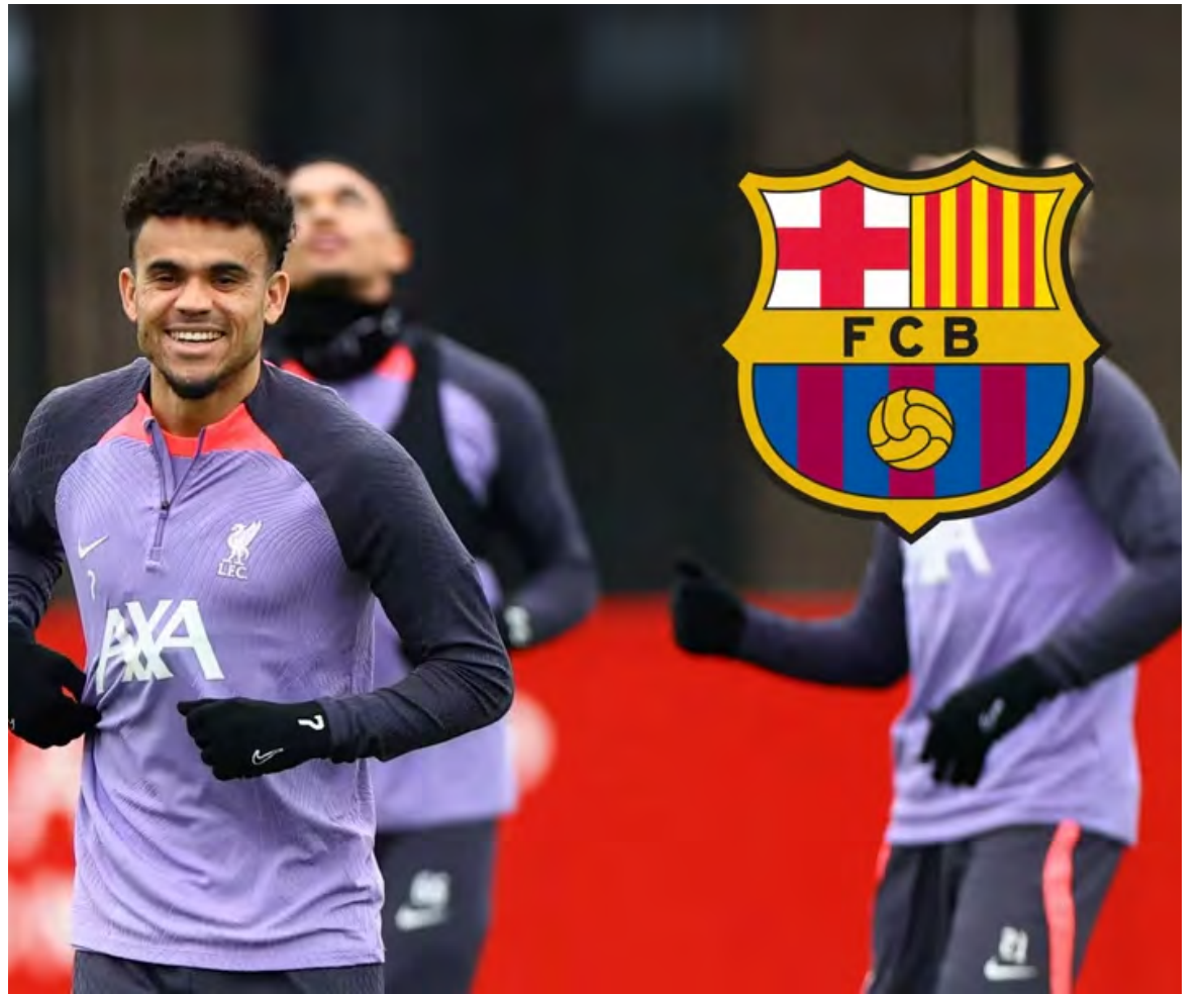
Luis Díaz fue relacionado con el Barcelona y muchas versiones indicaron que hubo acercamientos para su fichaje

Luego del partido ante Argentina, Luis Díaz destacó la unión entre todos los jugadores en esa clase de encuentros: “Creo que lo más especial que tiene el grupo es que es una familia dentro del campo y fuera de él, cada vez que nos reunimos se siente esa energía que todos tiran para