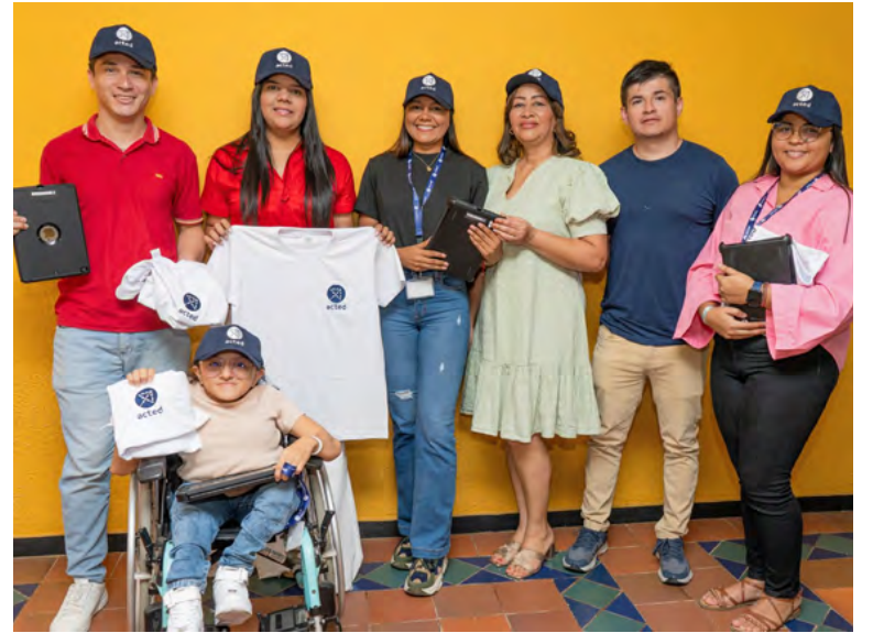
Grupo de encuestadores con funcionarios de la Oficina de Regionalización

la situación de los grupos poblacionales en Riohacha, dentro de este lapso se realizarán las encuestas y la información recopilada permitirá a ACTED brindar asistencia humanitaria ajustada a las necesidades de las comunidades.