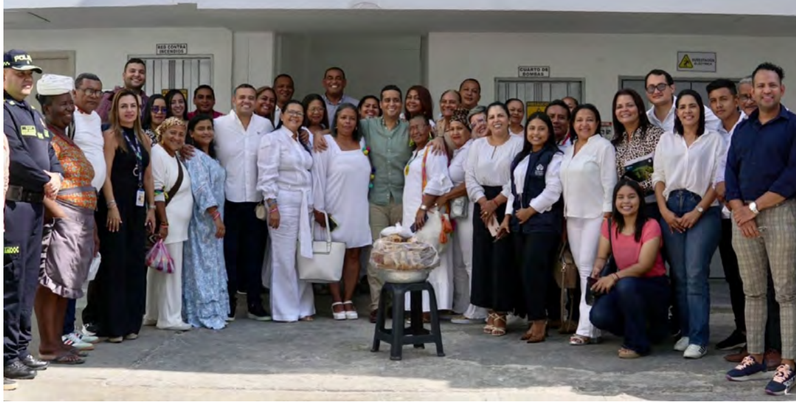
El Gobernador de La Guajira, Jairo Aguilar, participó en la Primera Mesa Territorial de Garantías del departamento, respaldando a los defensores de derechos humanos y firmando el 'Pacto Ciudadano contra la Estigmatización'.