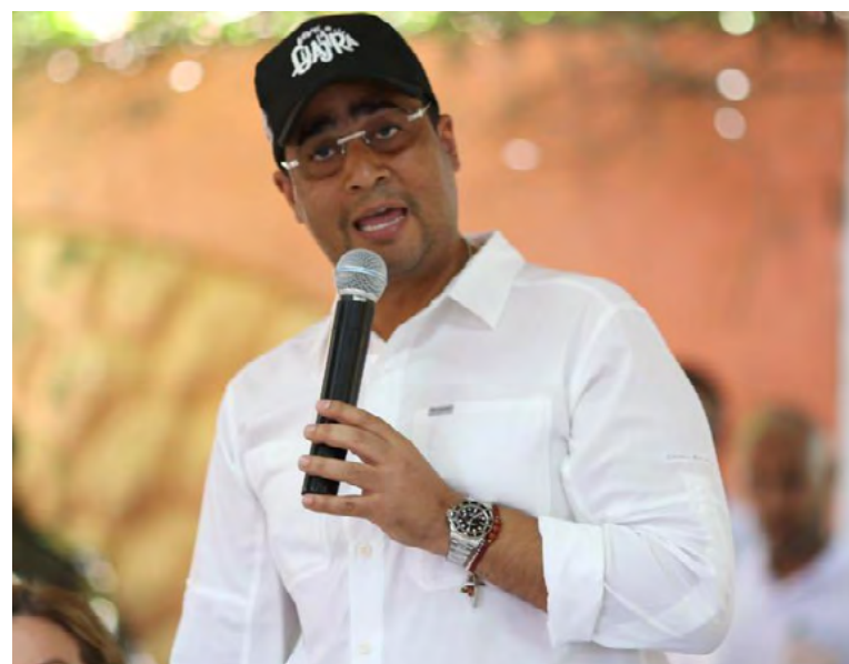
Gobernador Jairo Aguilar.

Nuevamente el gobernante exigió una inversión considerable para La Guajira para que se mejore el servicio de energía.