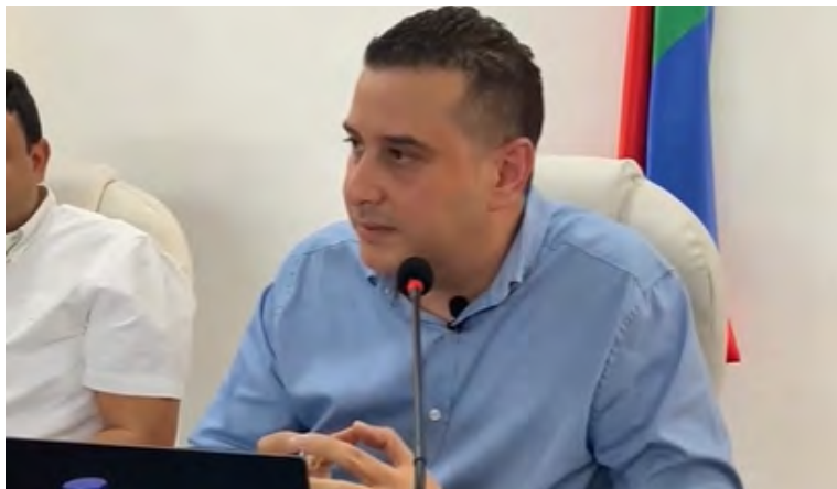
Diputado de La Guajira, Mateo Luquez López.