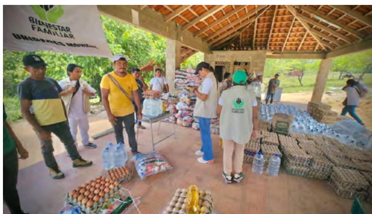
El ICBF brindó apoyo psicosocial y entregó raciones de emergencia a las familias wiwa retornadas a sus territorios en la zona rural de Riohacha.

"El compromiso debe ser continuo tanto a nivel local como nacional, para garantizar que no se presenten más desplazamientos y proteger nuestros re-