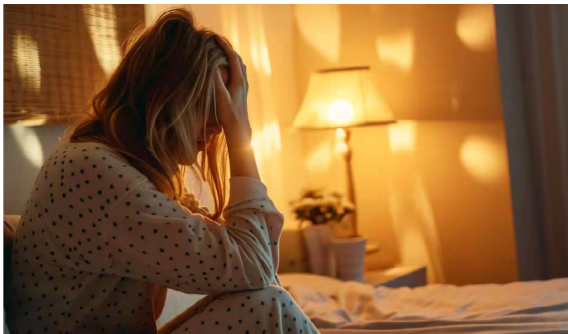
La manzanilla puede ayudar a reducir la inflamación, regular la presión arterial y reducir los niveles de colesterol