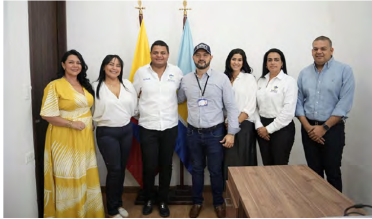
La Alcaldía de Riohacha, en colaboración con Ecopetrol y la Universidad Antonio Nariño, iniciará un diplomado para capacitar a 30 funcionarios en formulación y gestión de proyectos.

El mandatario destacó la importancia de este diplomado