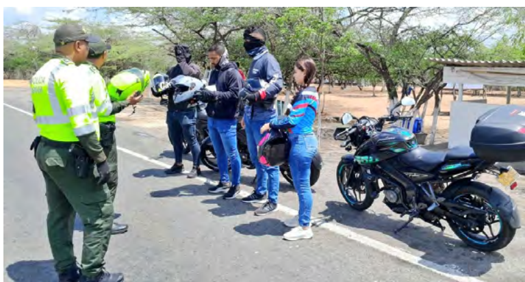
La jornada ‘Pausas Activas’ busca ofrecer descansos a conductores de diversos vehículos y promover la seguridad vial.

La Seccional de Tránsito y Transportes de La Guajira viene implementando estrategias para reducir los accidentes viales.