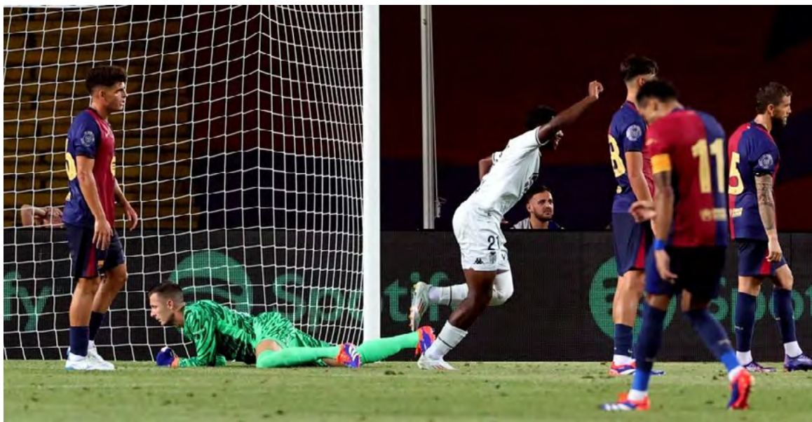
El Barça de Flick pincha en su presentación en el Gamper al caer de manera contundente ante el Mónaco por 0-3 a cinco días de debutar en la Liga en Mestalla.

Esta derrota llega en un momento crítico, a tan solo cinco días de su primer partido en La-