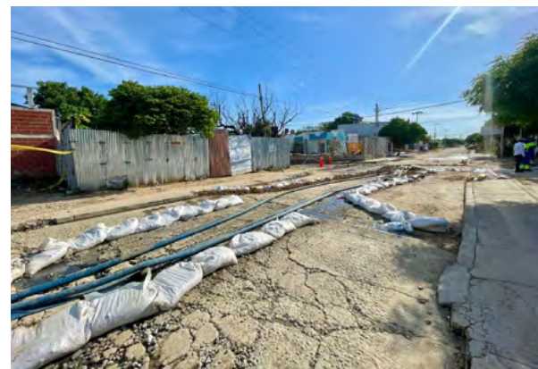
La Alcaldía de Riohacha y Aqualia han respondido al llamado urgente de los residentes del barrio Las Tunas con medidas para controlar el daño en el colector principal del distrito sanitario No. 5.