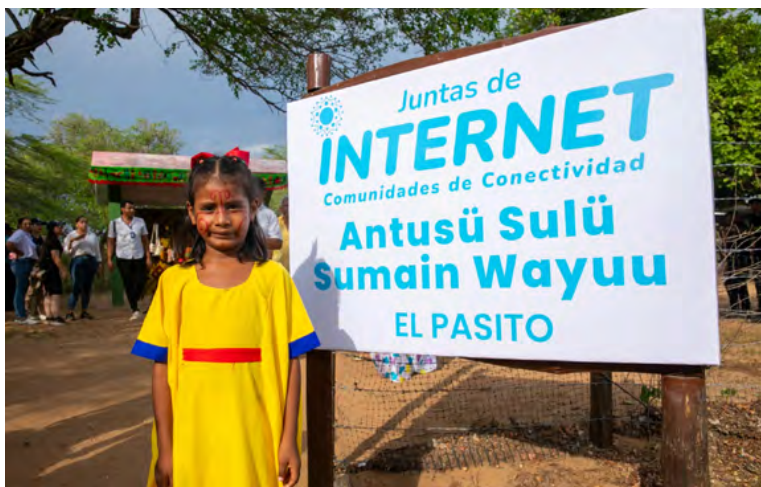
Con la firma del convenio entre el Ministerio TIC y la Asociación de Autoridades Indígenas Wayuu Akatsinja Wakuaipa, 10.200 hogares de comunidades Wayúu de Riohacha y Manaure serán beneficiadas.

mar un convenio con el que vamos a beneficiar a 10.000 hogares, cerca de 40.000 personas, con Internet de alta velocidad.