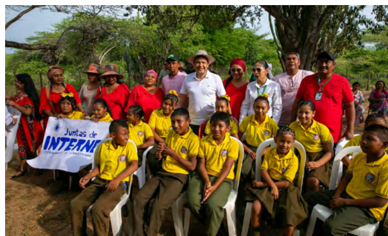
El convenio implica una inversión cerca de $12.040 millones.

El proyecto comenzará con etapas de sensibilización, caracterización y estudios de sitio, y se espera que los primeros hogares sean conectados a principios de septiembre. Este esfuerzo conjunto entre el sector público, privado y las organizaciones étnicas reafirma la importancia del trabajo colaborativo para integrar a Colombia en la economía digital global, promoviendo equidad y desarrollo sostenible en las regiones más vulnerables del país.