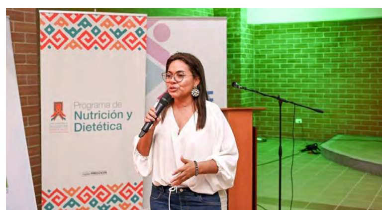
Para conmemorar el Día del Nutricionista Dietista, la Universidad de La Guajira organizó un evento en la Biblioteca Héctor Salah Zuleta de Riohacha.

Hay que indicar que estos encuentros son esenciales para avanzar hacia un futuro más sa-