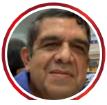
Hernán Baquero Bracho

Lo que ha venido ocurriendo en el Cauca y en parte del sur del país, contra el ejército nacional, ha sido humillante y bochornoso, para las instituciones que guardan el orden y la seguridad del país. Humillante, por la forma como han sido maltratados, el contingente de la patria con ofensas e insultos por parte de los indígenas, por una parte, con la excusa malsana de que están cansados de la guerra en su territorio, presuntamente haciéndole el juego a las FARC, como si esta región de la patria no fuera parte de Colombia y por otro lado por los grupos armados ilegales. Bochornoso y vergonzoso, porque actos como estos jamás se habían visto, lo que generan y ha generado indignación nacional por la forma como fueron tratados los integrantes de nuestro glorioso Ejército y con mucha responsabilidad por parte del Ejército, no generó una reacción mayor ante los atropellos y los vejámenes de que fueron parte en los hechos relacionados. Da tristeza como en este gobierno los soldados de la patria han sido humillados, secuestrados, asesinados y pareciera que al Ministro de Defensa le importara un rábano lo que sucede con el ejército nacional.