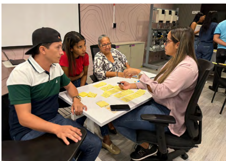
La iniciativa incluye a medios locales, nacionales y entidades como la Gobernación de La Guajira y la Alcaldía Distrital de Riohacha, fortaleciendo así las capacidades de comunicación en la región.