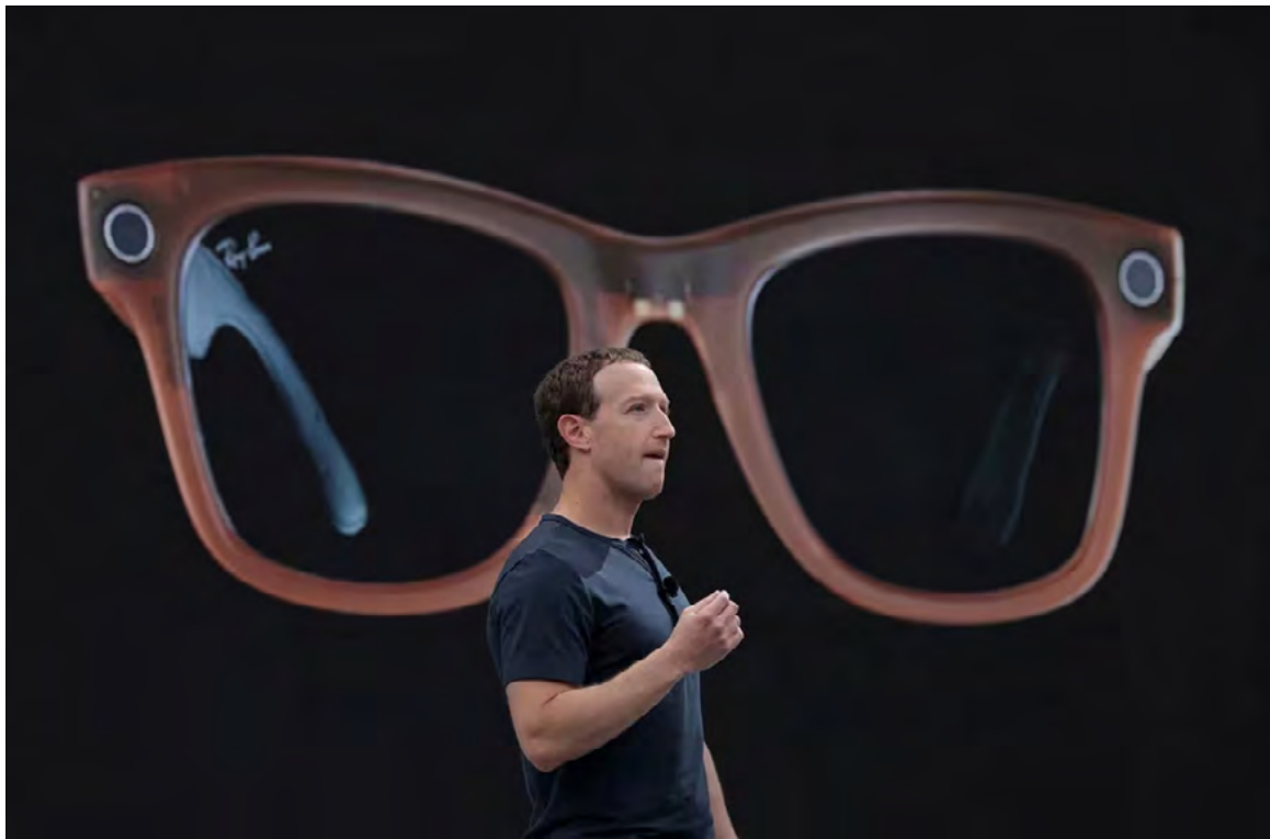
Apple quiere ampliar su portafolio de opciones de realidad virtual para tener dispositivos más económicos.

A diferencia de las Vision Pro, que se centran en la realidad mixta y ofrecen una experiencia