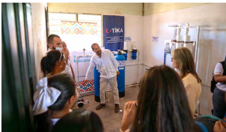
La planta de tratamiento tiene una capacidad de producción de hasta 800 litros de agua potable por hora

que, la planta de tratamiento funciona a través de un sistema de ósmosis inversa que genera hasta 800 litros de agua potable