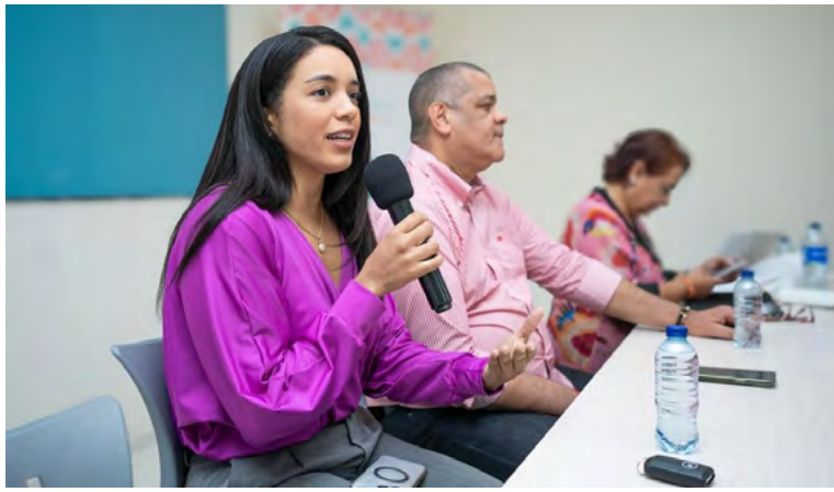
Durante el encuentro, se compartieron conocimientos y se brindó asistencia técnica.

Durante dos días, compartieron conocimientos, brindaron