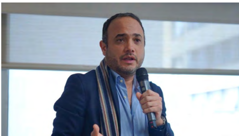
Senador Alfredo Deluque.

El senador Alfredo Deluque, en un contundente pronunciamiento, denunció los matrimonios infantiles en Colombia como un acto de violencia sistemática contra las mujeres. Durante el debate sobre la eliminación de esta práctica, Deluque enfatizó que la gran mayoría de estos matrimonios involucran a niñas forzadas a casarse con hombres mucho mayores, y no se trata