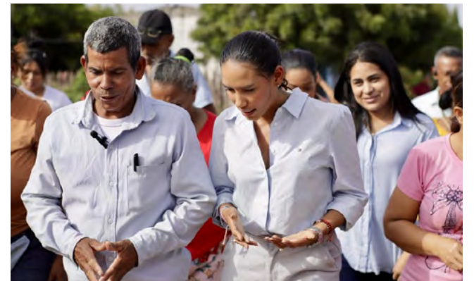
Más de 200 familias de Villanueva reciben títulos de propiedad gracias al trabajo conjunto de la Gobernación de La Guajira y autoridades locales

La Gobernación de La Guajira indicó que se adelantó la titulación de predios para 200 familias guajiras del municipio de Villanueva. Esto se dio al trabajo articulado entre el gobierno nacional, departamental y municipal.