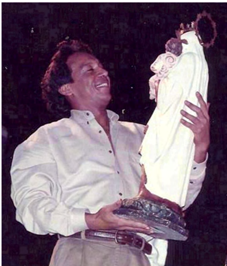
Diomedes Díaz siempre fue fiel devoto de la Virgen del Carmen

Carmen dame vida, dame salud, que lo demás lo resuelvo yo".