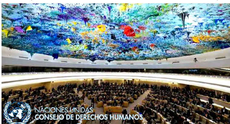
NACIONES UNIDAS CONSEJO DE DERECHOS HUMANOS

del Alto Comisionado para que preste la cooperación y asistencia técnica requerida por Colombia para avanzar en la implementación de las recomendaciones de la Comisión de la Verdad y para superar los retos que subsisten en materia de derechos humanos.