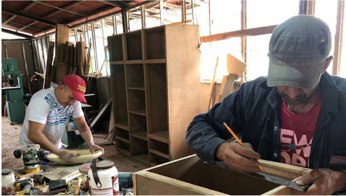
El Programa de Reincorporación Integral contempla 211 acciones diseñadas para atender las necesidades y aspiraciones de los y las firmantes de paz.

Para la creación del Sistema Nacional de Reincorporación y el Programa de Reincorporación Integral se incorporaron las propuestas y visiones de diferentes organizaciones de firmantes del Acuerdo, que participaron