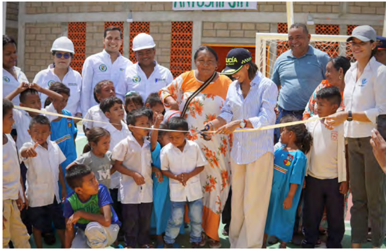
60 estudiantes wayuu del Internado Akuaipa reciben modernas aulas, cocina, comedor, cancha y baños, mejorando su calidad de vida y educación.

realidades y brindando espacios dignos para los niños, que son el futuro de La Guajira. Las nuevas aulas representan un avance y una apuesta por el fortalecimiento y mejoramiento de la educación, demostrando que la inversión en infraestructura educativa es necesaria para el bienestar de sus habitantes.