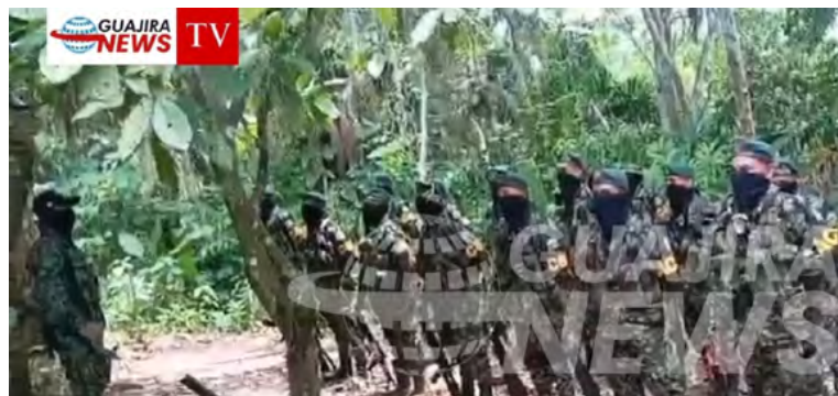
Para ver video toque la imagen

La difusión del video ha causado temor entre la población, ya que se está compartiendo