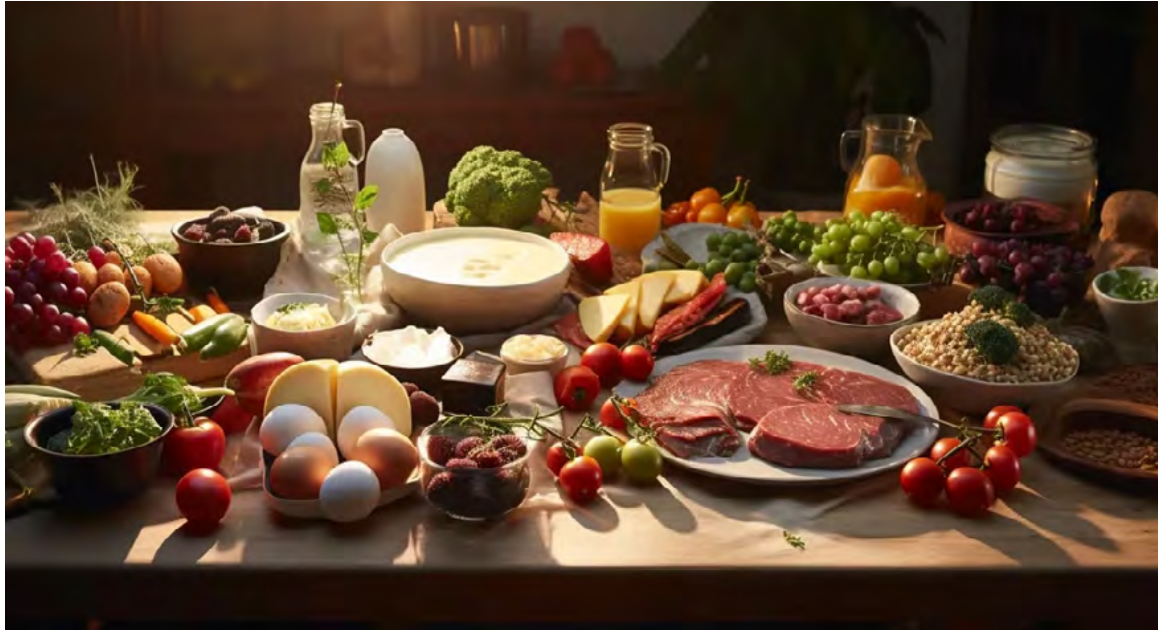
La dieta flexitariana se caracteriza por reducir el consumo de carne

Los efectos del cambio climático son evidentes, y tomar medidas individuales puede ser determinante. Reducir el consumo de carne no es solo una elección dietética, sino un paso hacia la reducción de nuestro impacto ambiental. Aunque algunas dietas, como la flexitariana, sean percibidas como tibias, representan un inicio crucial hacia una alimentación más consciente y sostenible.