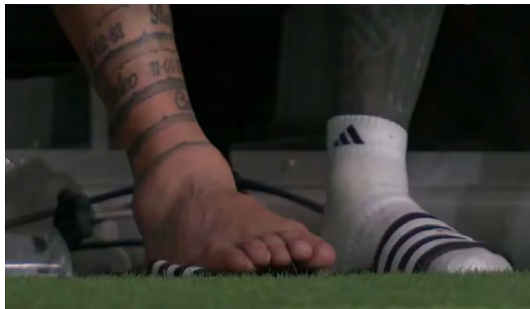
Lionel Messi, por primera vez en las ocho finales que disputó con el seleccionado mayor, salió de la cancha en una final

"La lesión de Messi en el tobillo fue un traumatismo con