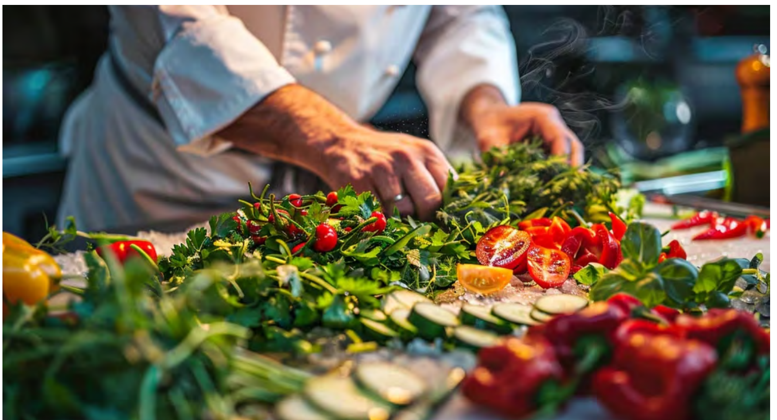
Si todos adoptaran esta dieta, podríamos limitar el calentamiento global a aproximadamente 1,5 °C y ver reducciones en la eliminación del dióxido de carbono para 2045