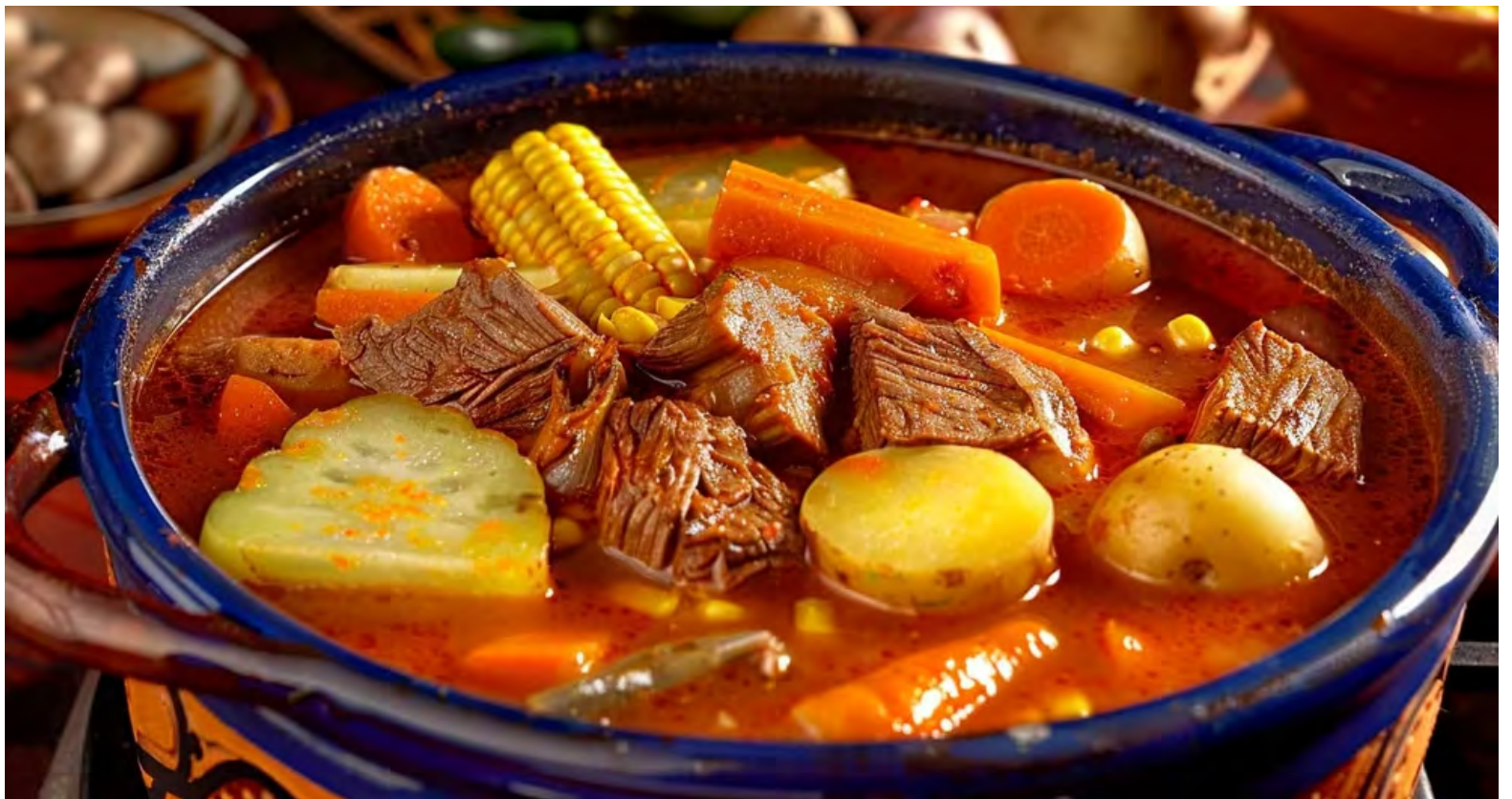
Reducir el consumo de carne no es solo una elección dietética, sino un paso hacia la reducción de nuestro impacto ambiental