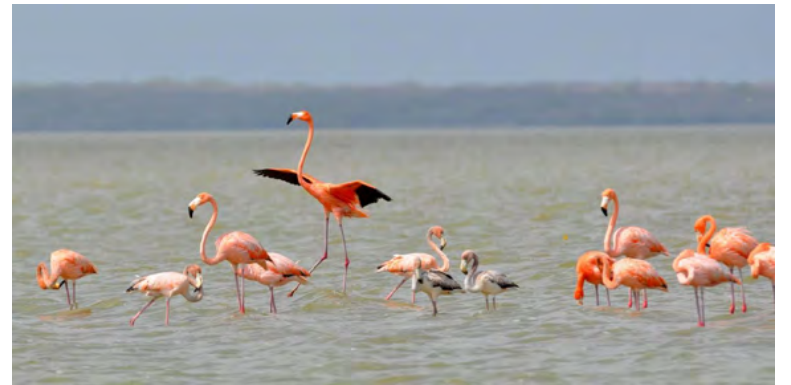
Santuario de Fauna y Flora Los Flamencos Rosados.