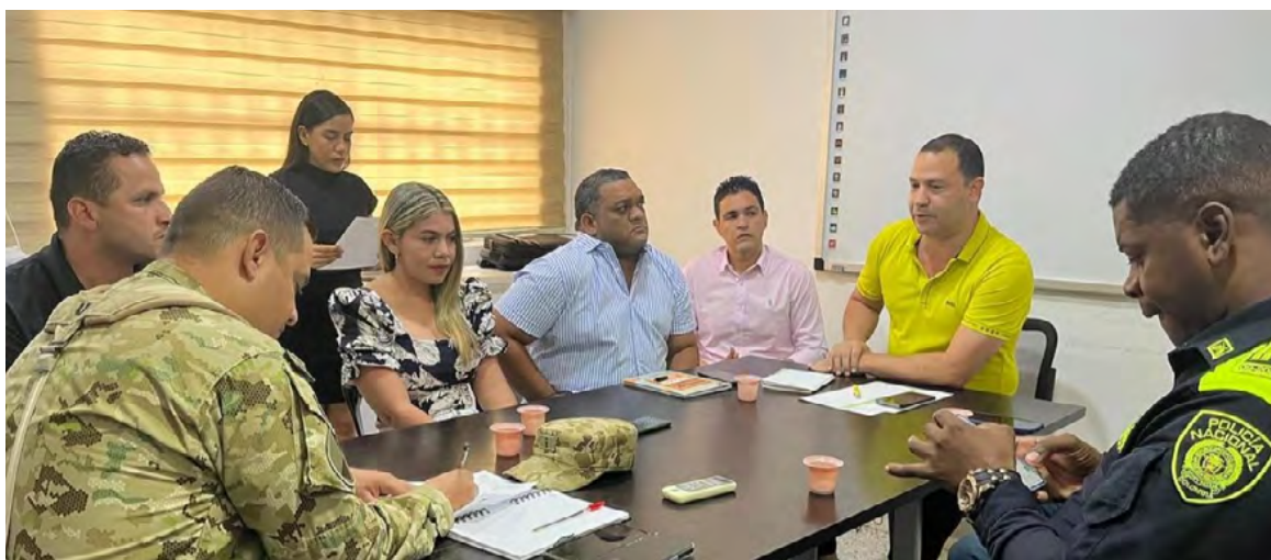
El alcalde Rafael Manjarrez Aponte refuerza el compromiso con la seguridad y la coordinación con instituciones locales para prevenir futuros actos de violencia.

"Tras recibir el informe de la Policía Nacional, estamos convencidos de que con los recursos de la Fuerza Pública lograremos capturar a los delincuentes", afirmó el Alcalde.