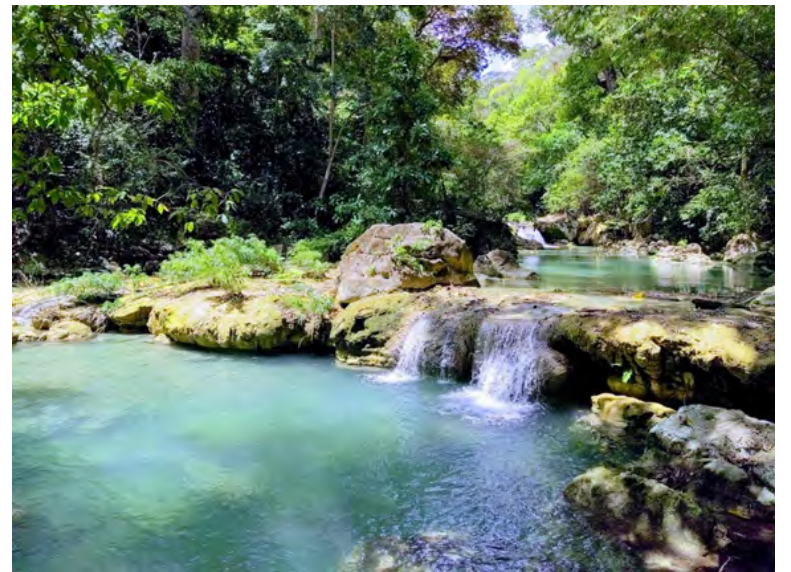
Montes de Oca: un paraíso para hacer ecoturismo en La Guajira