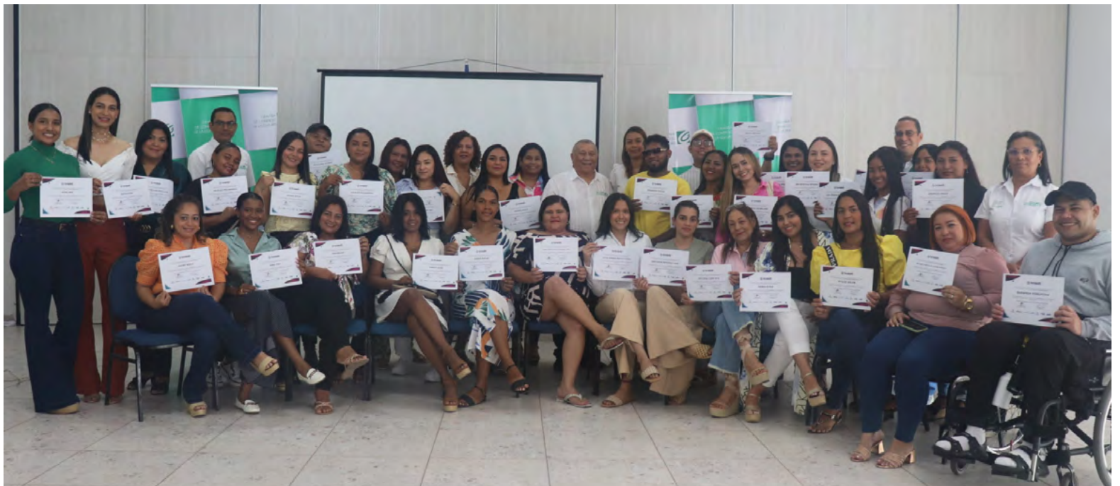
Cámara de Comercio impulsa crecimiento del sector belleza.

Esta iniciativa forma parte de una apuesta nacional desarrollada a través del Ministerio de Comercio, Industria y Turismo e INNpulsa Colombia, operada por la Cámara de Comercio de La Guajira en alianza con la Cámara de Comercio de Cartagena, para promover el fortalecimiento de micro y pequeñas empresas, así como de las unidades económicas de la economía popular en La Guajira. Con un enfoque integral que incluye acompañamiento, capacitación, asistencia técnica especializada y herramientas de gestión.