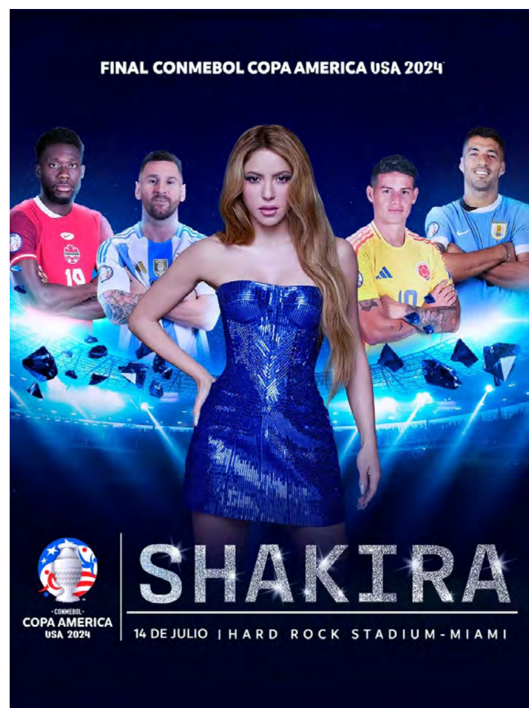
La cantante colombiana, Shakira, estará presente en el show de la final de la Copa América 2024

En medio de la entrevista, la colombiana habló de su presentaciones destacadas en varios mundiales de fútbol. En el Mundial de Alemania 2006, Shakira interpretó la canción Hips Don't Lie junto a Wyclef Jean en la ceremonia de clausura, logrando una repercusión mundial. Luego, en la Copa Mundial de Sud-