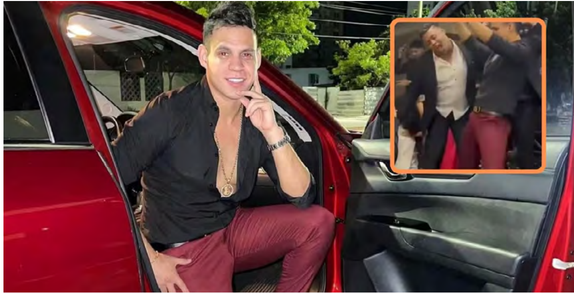
El artista entregó declaraciones sobre lo sucedido asegurando que se debe a su público

La discusión continúa en las plataformas digitales donde, como es de esperarse, los usuarios no se ponen de acuerdo y otros internautas afirman que lo único que debe hacer es enfocarse en su carrera.