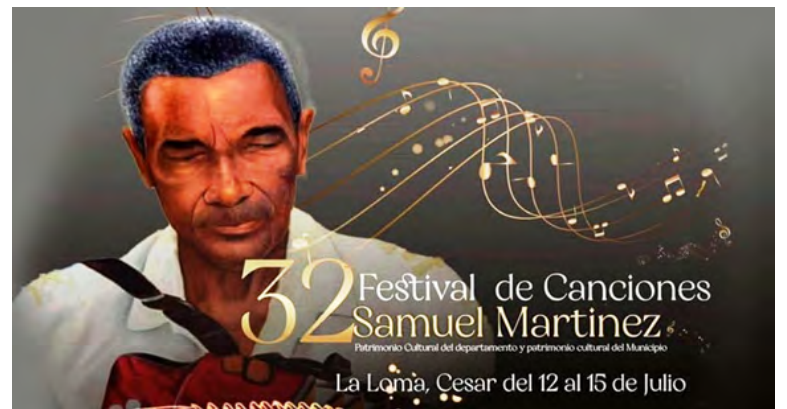
32 Festival de Canciones Samuel Martínez