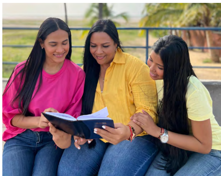
El programa abrirá un nuevo proceso de inscripciones, el próximo 20 de julio.

(sólo para jóvenes en estado suspendido).