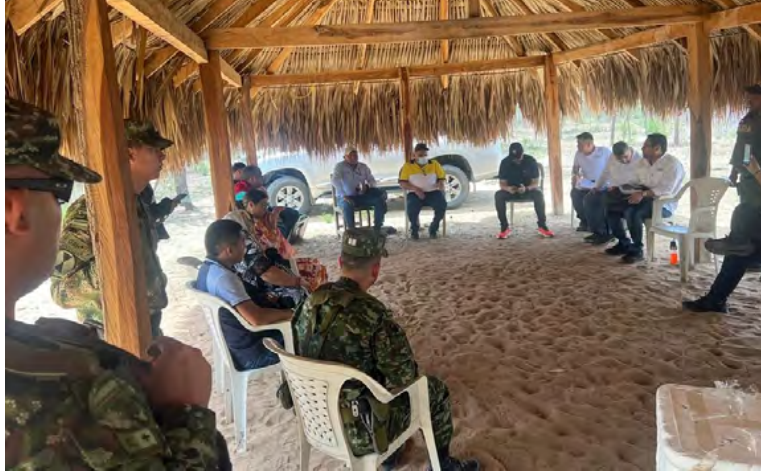
Personero de Maicao y autoridades dialogan con Grupo Energía Bogotá y comunidad indígena sobre vandalismo en infraestructura eléctrica.

A su vez, también participan la Directora de asuntos Éticos del Municipio de Maicao; Delegado de Asuntos Indígena Departamental; Asesor de Despacho del Gobernador; y Representantes de la Policía y Ejército Nacional.