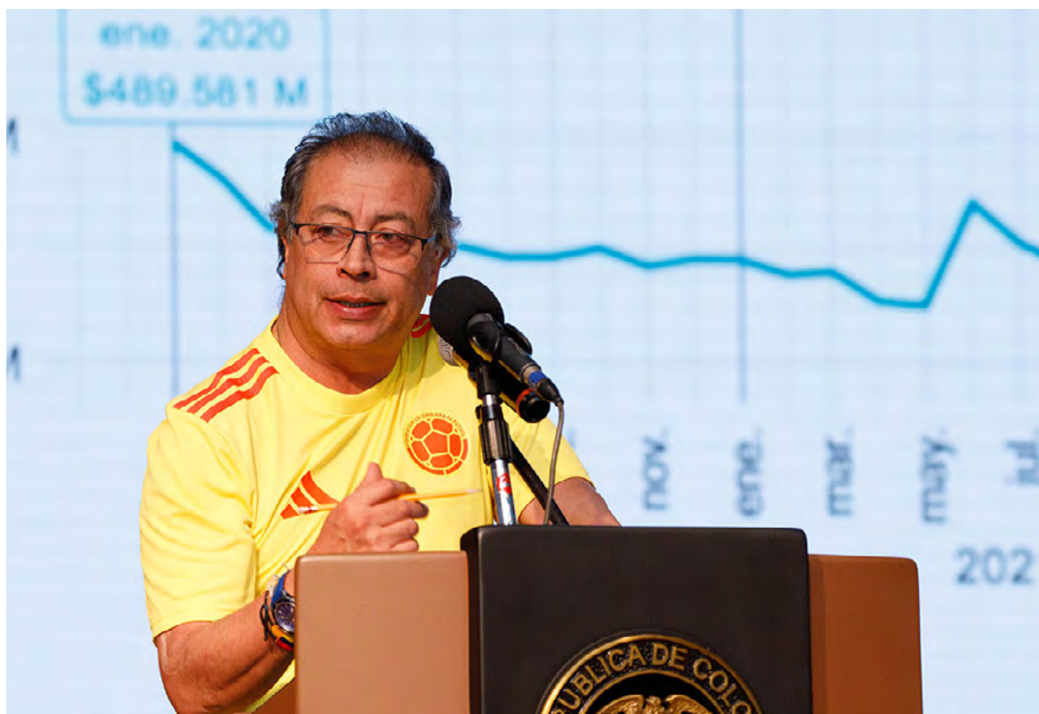
Gustavo Petro, presidente de Colombia.

Señaló que estos recursos pasaron de $ 27.000 millones de pesos, en agosto de 2023, a $ 1,5 billones en mayo de este año, lo que calificó de "salto sustancial que hace la Administradora de los Recursos del Sistema General de Seguridad Social en Salud (Adres) a clínicas y hospitales, públicos y privados" y que a la fecha alcanza los $ 4