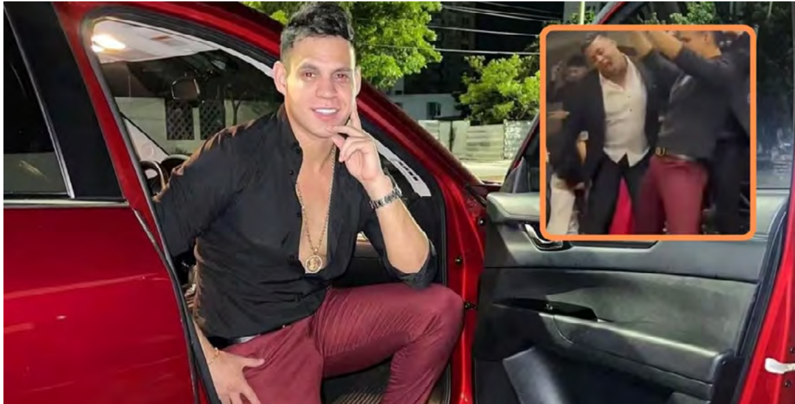
El artista entregó declaraciones sobre lo sucedido asegurando que se debe a su público

La discusión continúa en las plataformas digitales donde, como es de esperarse, los usuarios no se ponen de acuerdo y otros internautas afirman que lo único que debe hacer es enfocarse en su carrera.