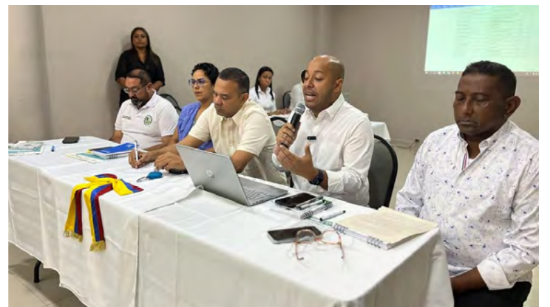
Funcionarios del gobierno departamental y líderes sociales e indígenas participan activamente en la primera sesión ordinaria del Consejo Departamental de Paz, Convivencia, Reconciliación, y Derechos Humanos.

“En el cual como equipo interinstitucional, reiteramos nuestro compromiso de trabajar articuladamente desde nuestras secretarías, para fortalecer el tejido social, promover la inclusión y garantizar el respeto por los derechos humanos en todas las comunidades de La Guajira”, advirtió el Secretario de Desa-