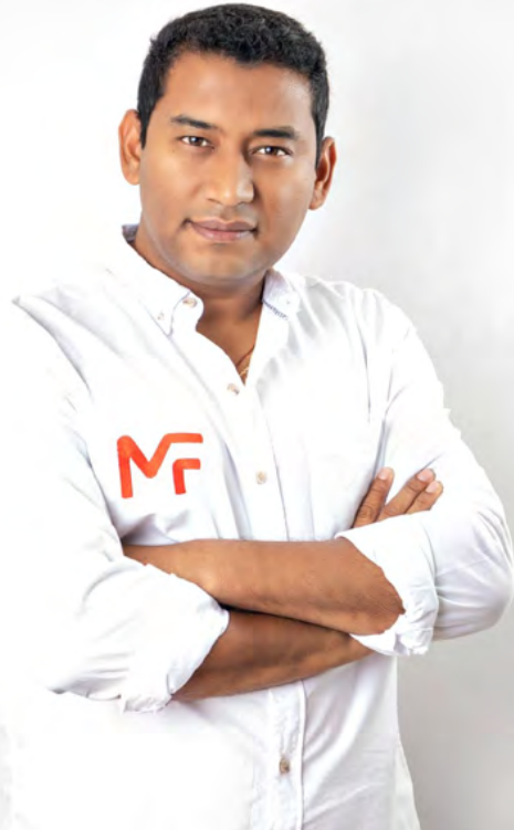
Miguel Felipe Aragón, alcalde de Maicao

Este reconocimiento llega en un momento en que las ciudades intermedias están siendo cada vez más valoradas por su capacidad de impulsar el desarrollo económico y social de amplias regiones. La gestión de Aragón González en Maicao se presenta como un ejemplo de liderazgo eficaz y orientado a resultados en la región del Caribe.