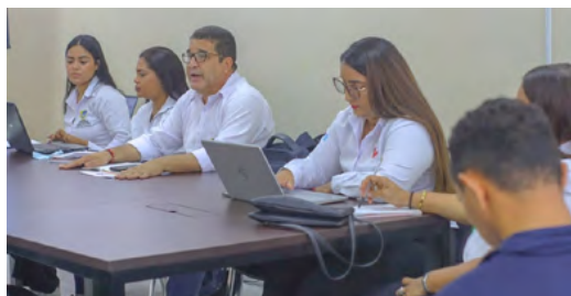
Primera Sesión del Comité del Mecanismo Articulador en Riohacha para abordar las violencias por razones de sexo y género.