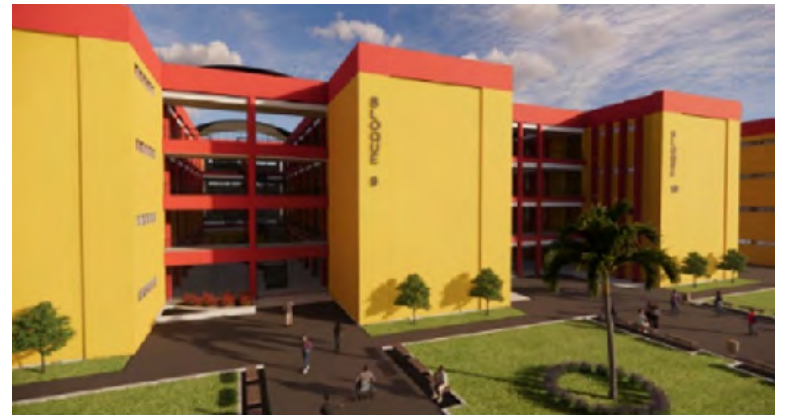
Bloques IX y X de la Universidad de La Guajira, sede Riohacha.

Hay que indicar que esta importante inversión para la Universidad de La Guajira es