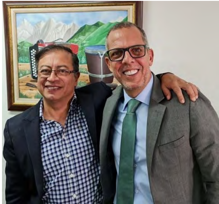
Alfredo Saade junto al presidente Gustavo Petro.