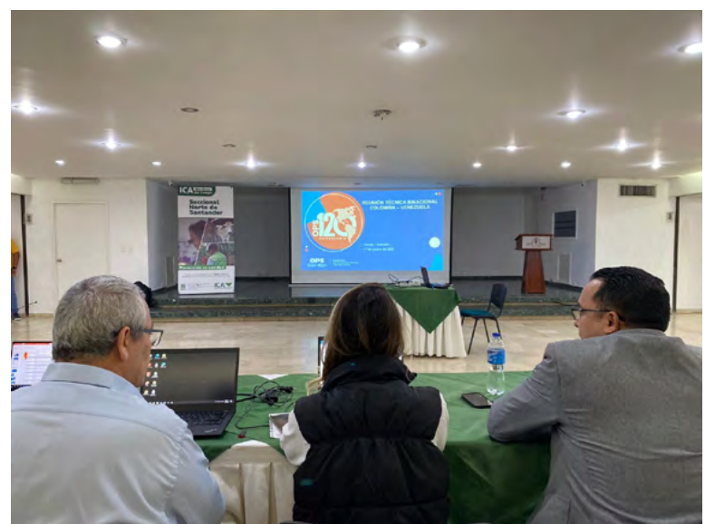
Esta reunión busca fortalecer los lazos entre los países en temas sanitarios para prevenir, mitigar y controlar la fiebre aftosa en la zona de frontera.

gerente de Protección Animal del ICA, presentó la estrategia del programa de erradicación de fiebre aftosa en Colombia y las acciones que ha tomado el Instituto para prevenir y controlar el ingreso de la enfermedad al país.