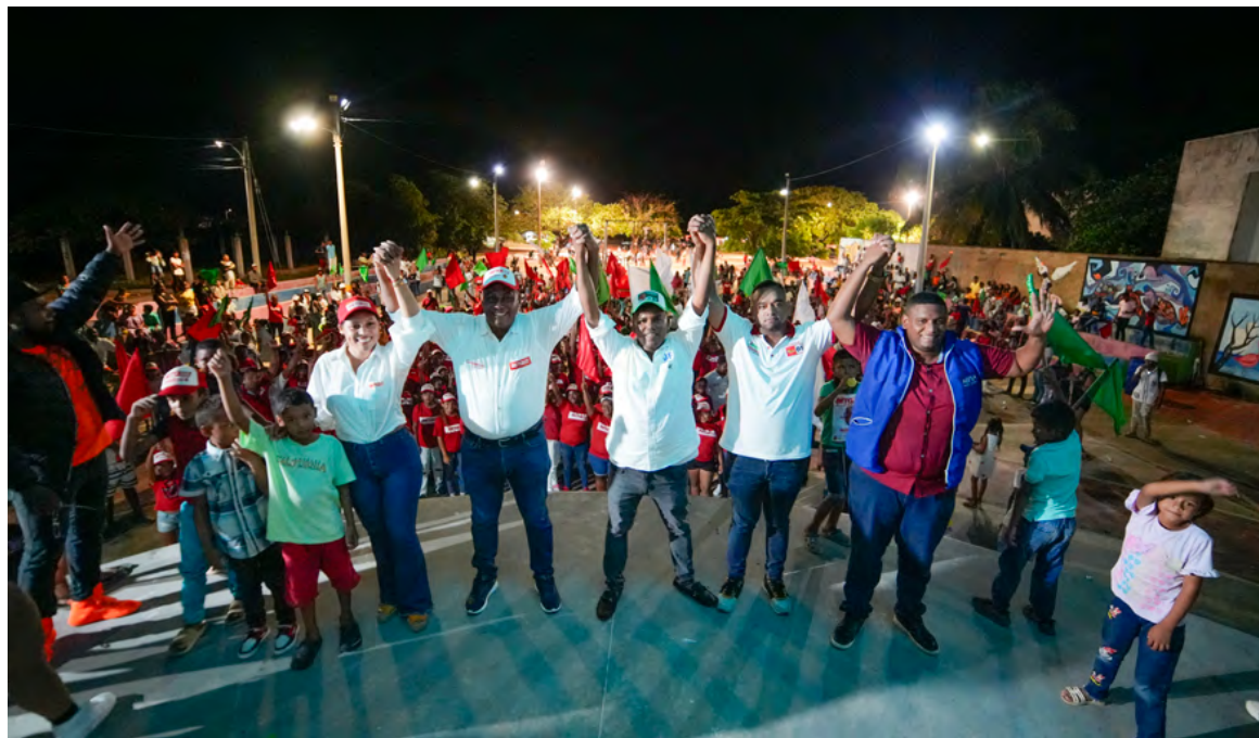
El evento contó con la presencia de más de 800 personas