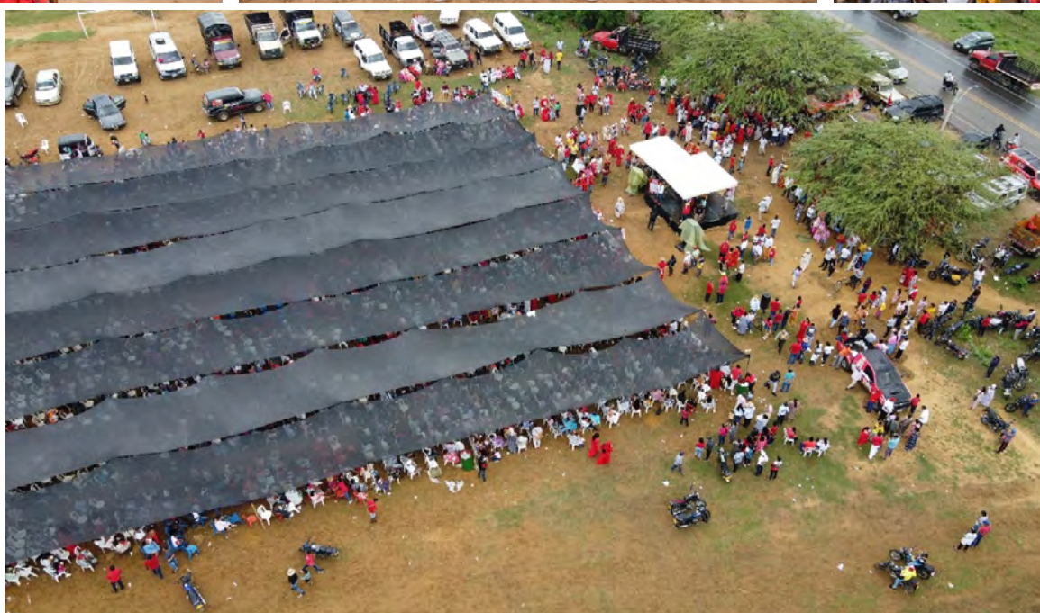
El evento contó con la presencia de miles de Autoridades Tradicionales, Autoridades Ancestrales, líderes y lideresas indígenas