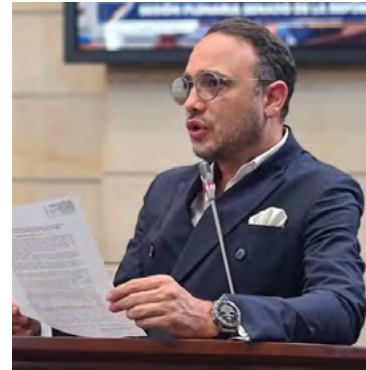
Alfredo Deluque Zuleta, Senador de La Guajira.

los colombianos que padecen el flagelo del hambre y la desnutrición en el país, nuestra meta es cumplir con ese objetivo mundial que va en línea con el desarrollo sostenible y el ‘Hambre Cero’. Estamos defendiendo desde el Congreso el derecho fundamental a estar protegido contra el hambre a través de la creación de políticas integrales y transversales a la institucionalidad y la ejecución pública”, finalizó.