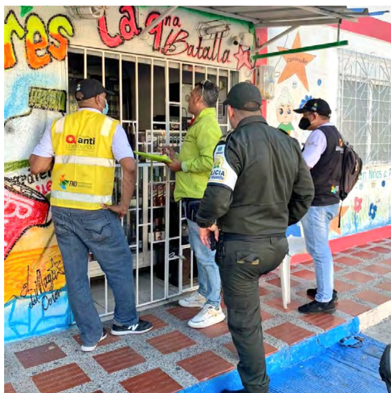
Visitas a los tenderos en distintos municipios de La Guajira.

“Al comprar un producto de contrabando, puede existir un engaño. El consumidor puede creer que está adquiriendo un juguete original. Los juguetes de contrabando pueden estar fabricados con material peligroso para la salud. Los productos ilegales, pueden no cumplir los estándares ambientales. Pueden ser fabricados con material tóxicos o peligrosos” , recomenda-