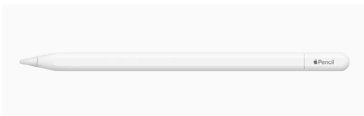
El nuevo Apple Pencil, más asequible, ofrece funciones como una precisión de píxeles perfecta, baja latencia y sensibilidad a la inclinación.

- Messages trae actualizaciones para la búsqueda y ofrece nuevas formas para que los usuarios se expresen, incluida una experiencia de stickers con nuevos stickers emoji y la capacidad de crear Live Stickers levantando sujetos de las fotos.