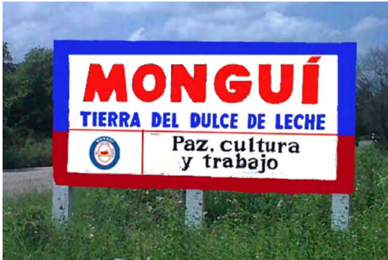
Aviso de entrada del corregimiento de Monguí.