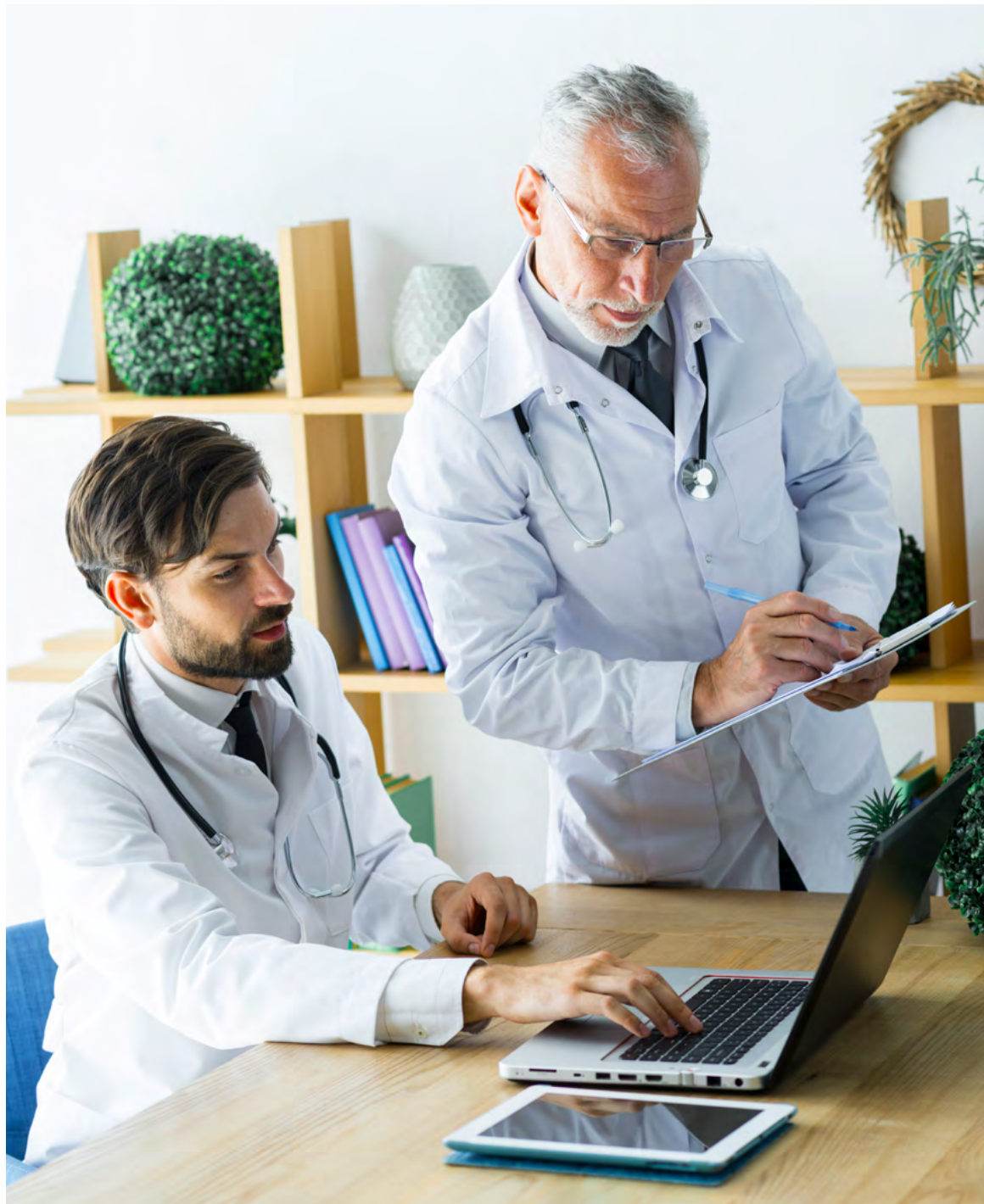
El paciente de enfermedades mentales tiene derecho a conocer y solicitar su historia clínica, además de acceder a un control médico adecuado y documentado a través de su historia clínica

tamiento y seguimiento mucho más acertado para su enfermedad. Si el paciente al reclamar y evaluar su historia clínica, siente que han sido vulnerados sus derechos puede solicitarlo por dos vías; si lo hace directamente a la entidad de salud donde fue