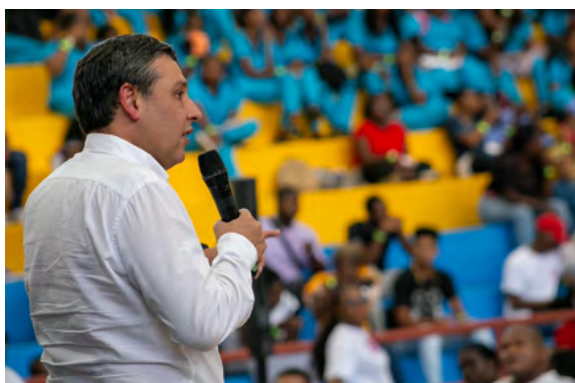
"Todo el Pacífico colombiano y La Guajira quedarán conectados con Internet de banda ancha y fibra óptica. Con este proyecto, vamos a llegar a más de un millón de personas y garantizaremos el subsidio del servicio por 10 años": Mauricio Lizcano, Ministro de las TIC.

"Este es el resultado del Gobierno del Cambio, y quizá el más grande del Gobierno para todos los colombianos del Pacífico. Venimos ya a firmar un acuerdo para que mañana inicien las obras. Todo el Pacífico colombiano y La Guajira van a quedar conectados con banda ancha, son los municipios con menos conectividad del país, con lo que llegaremos a 1.190.000 personas. En 10 años vamos a invertir $2,2 billones, será un subsidio por parte del Gobierno, para garantizar este suministro de internet. Va-