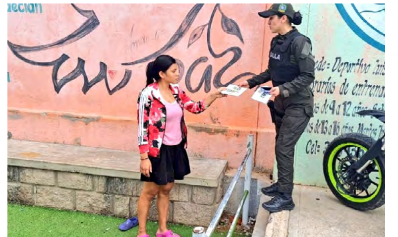
Socialización de la estrategia 'No dejes que te engañen! Córtales la conexión a la extorsión, cuelga y marca 165'

Cabe indicar que para estos tres últimos meses del año las autoridades han informado que se incrementa el delito de extorsión, por ello es que han forta-