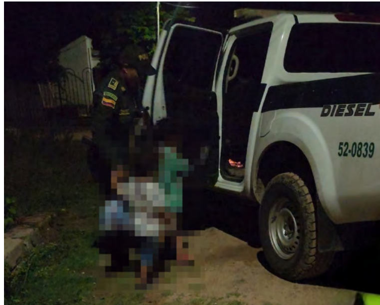
Los menores eran una niña de 5 años y un niño de 3 años.