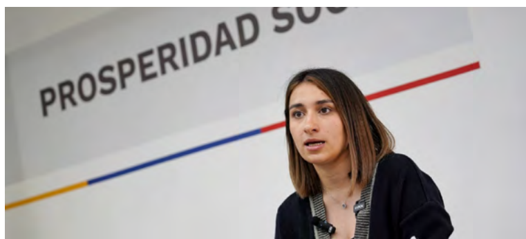
Laura Sarabia, directora de Prosperidad Social

De esta manera, informó la entidad, se está cumpliendo el compromiso del presidente Gustavo Petro con la comunidad en