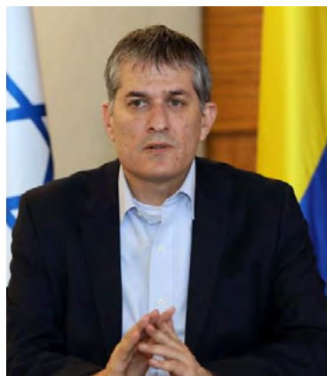
Gali Dagan embajador de israel en Colombia

"En la reunión se dejó en claro a la embajadora que sus declaraciones fueron recibidas en Israel con asombro ante el salvaje ataque de los terroristas de Hamás que asesinaron a más de 1.300 israelíes y secuestraron a más de 150", señaló el portavoz del Ministerio de Exte-