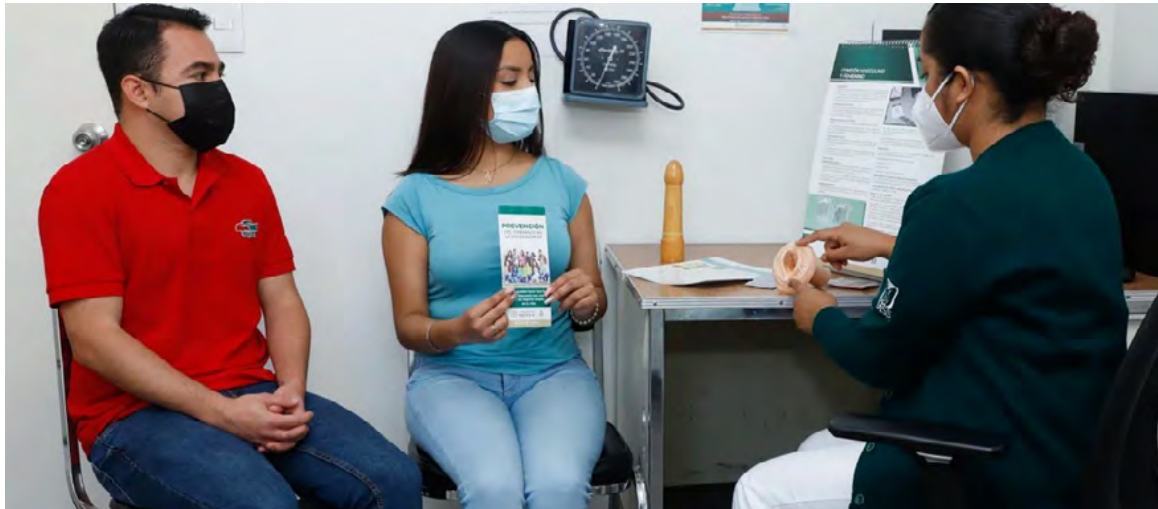
38,4 % de los colombianos no usaron ningún método anticonceptivo el pasado mes.