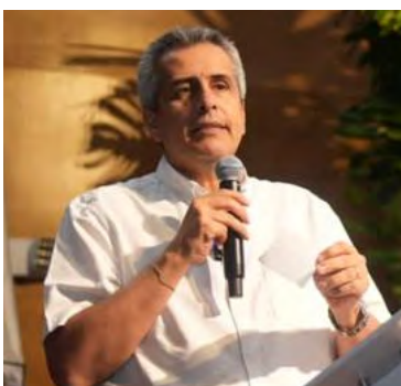
Luis Fernando Velasco, Ministro del Interior.

respecto el Ministro del Interior, Luis Fernando Velasco.