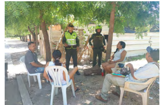
La Policía Nacional entrega de volantes informativos a los sanjuaneros.

"La Estación de Policía San Juan del Cesar invita a la construcción y consolidación de la convivencia y de la seguridad ciudadana. Lo anterior, con base en el humanismo, la corresponsabilidad y el trabajo cercano a la comunidad. Por cada actividad desarrollada en los diferentes barrios del municipio, se beneficiaron alrededor de 60 personas", finalizaron.