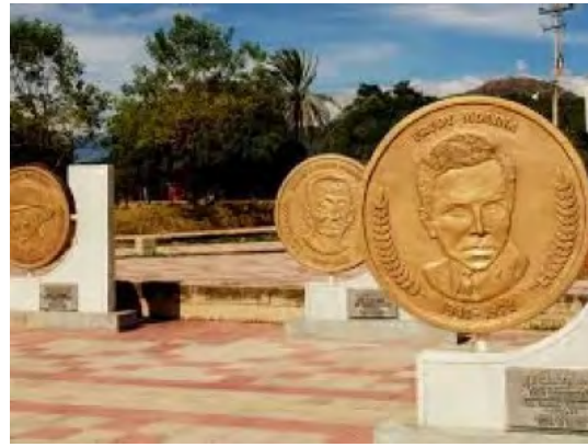
Este año la Fundación Cultural Costumbres y Tradiciones de Patillal, ha decidido exaltar en el marco del IX Encuentro Cultural a diferentes mujeres descendientes de este.

hacen de este mítico pueblo, un lugar apetecido por diferentes públicos, de ahí la importancia de buscar los espacios necesarios que permitan ofrecer el paradisiaco pueblo como el lugar donde en los amaneceres, tardes románticas y noches de bohemias se pueda llegar a escuchar una buena canción.