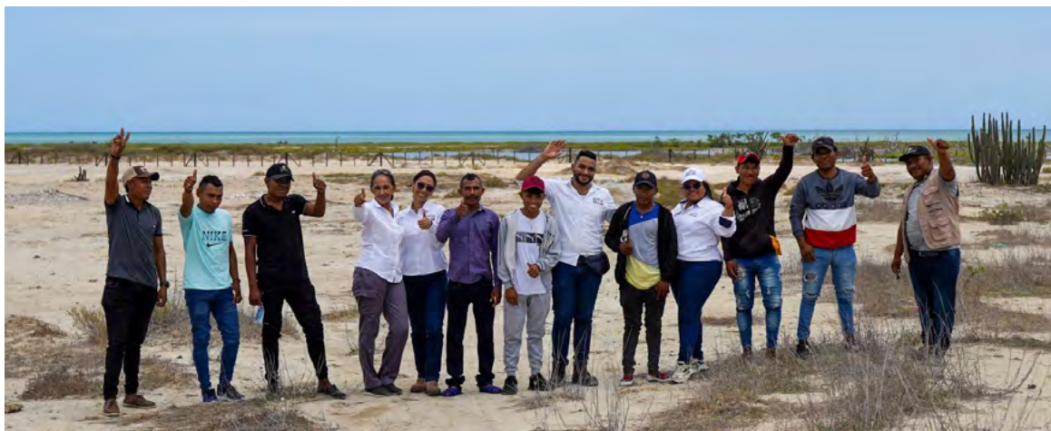
Musichi posee una gran diversidad fauna, es hábitat de poblaciones de flamencos rosados y sitio de residencia temporal, alimentación y descanso de aves migratorias las cuales transitan a lo largo de sus ciénagas, lagunas y estuarios.