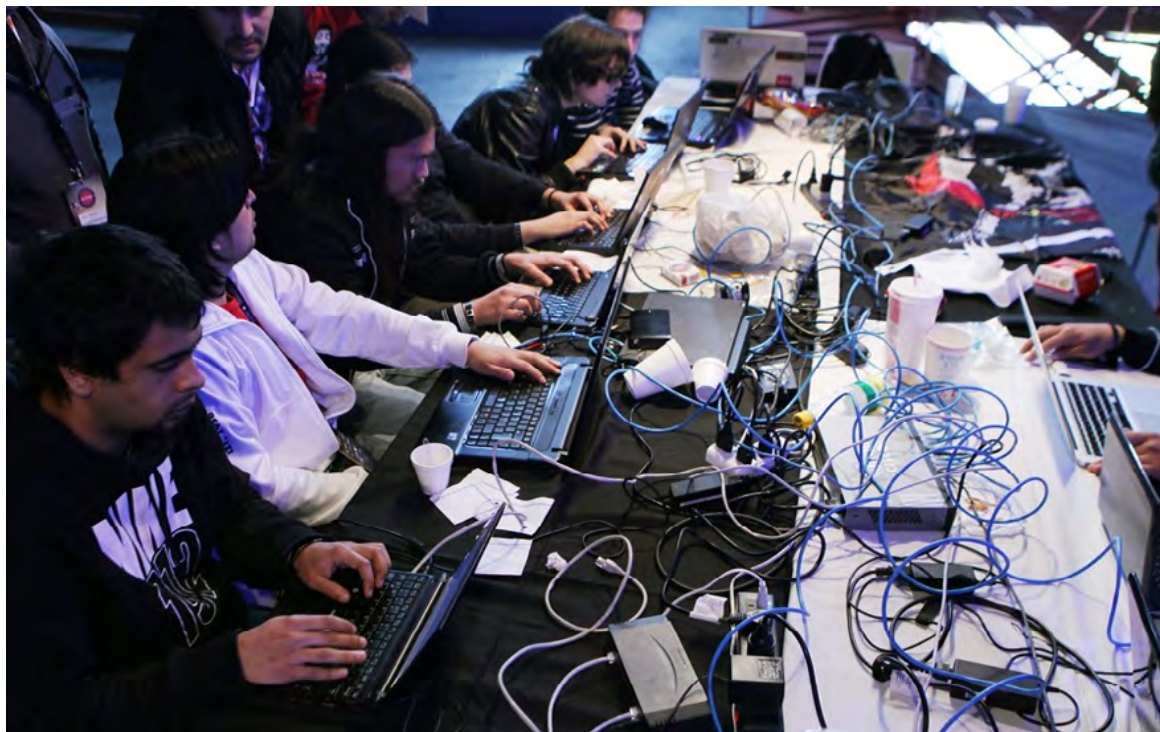
Un grupo de hackers participa en una competencia.

Una nueva vulnerabilidad en las CPU de los hardware de ordenadores (Central Processing Unit, en sus siglas en inglés; unidades centrales de procesamiento, en castellano) permite el robo de datos mediante el análisis del consumo de energía y es "casi imposible de mitigar", alertó este miércoles un equipo de investigadores de la Universidad Técnica TU de Graz (Austria) y del Centro Helmholtz (Alema-