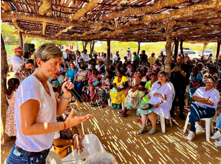
Verónica Alcocer, Primera Dama de la Nación.