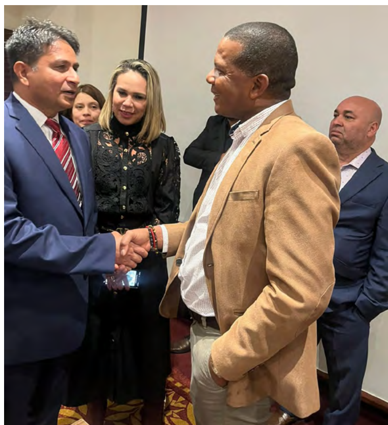
Camilo Iguarán Campo, Viceministro del deporte ha venido realizando encuentros con distintas embajadas y emisarios internacionales