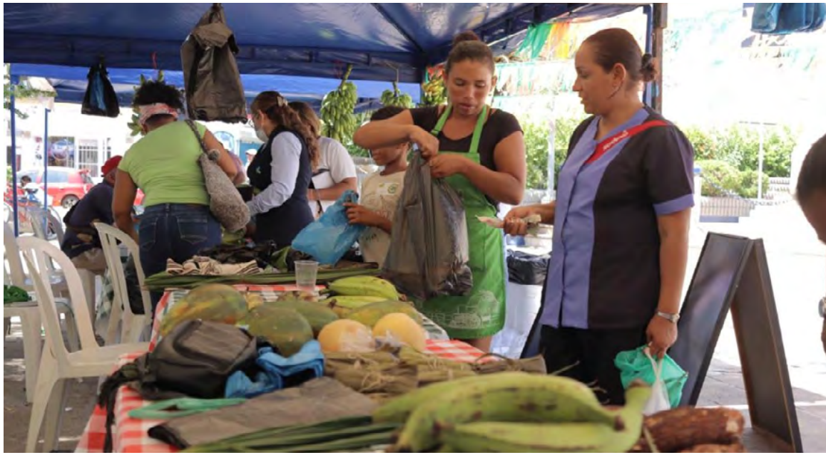
Se lograron ofrecer 103 productos y se realizaron, se tuvieron unas ventas que alcanzaron los 24 millones pesos.

“Resultado de la Feria Campesina y Negocios Verdes. Se