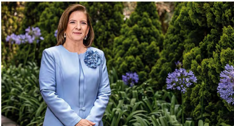
Margarita Cabello Blanco, Procuradora General de la Nación

Indicó que en calidad de magistrada de la Corte Suprema de Justicia fue ponente de la tutela que declaró el estado de cosas inconstitucionales en el departamento, lo que le impediría rendir su concepto sobre el decreto presidencial.