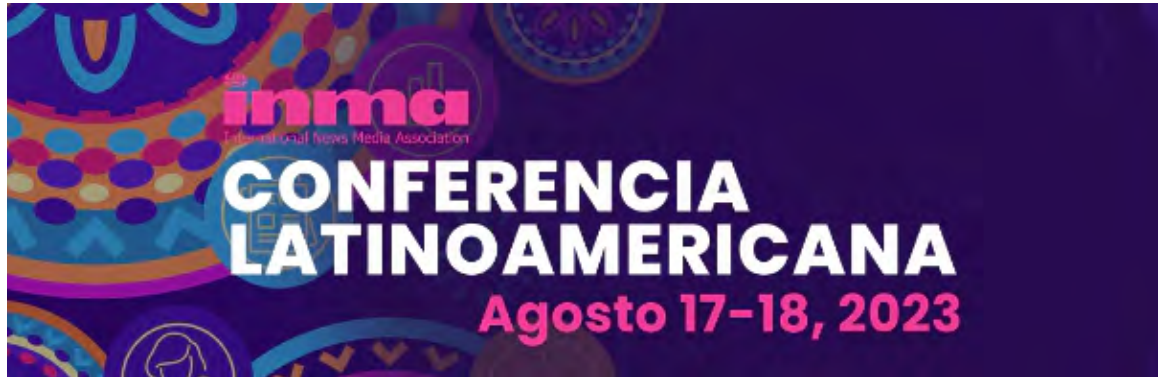
La conferencia se realizará el 17 y 18 de agosto

A lo largo de este evento virtual, al cual se puede inscribir cualquier persona interesada, se mostrarán las mejores prácticas,