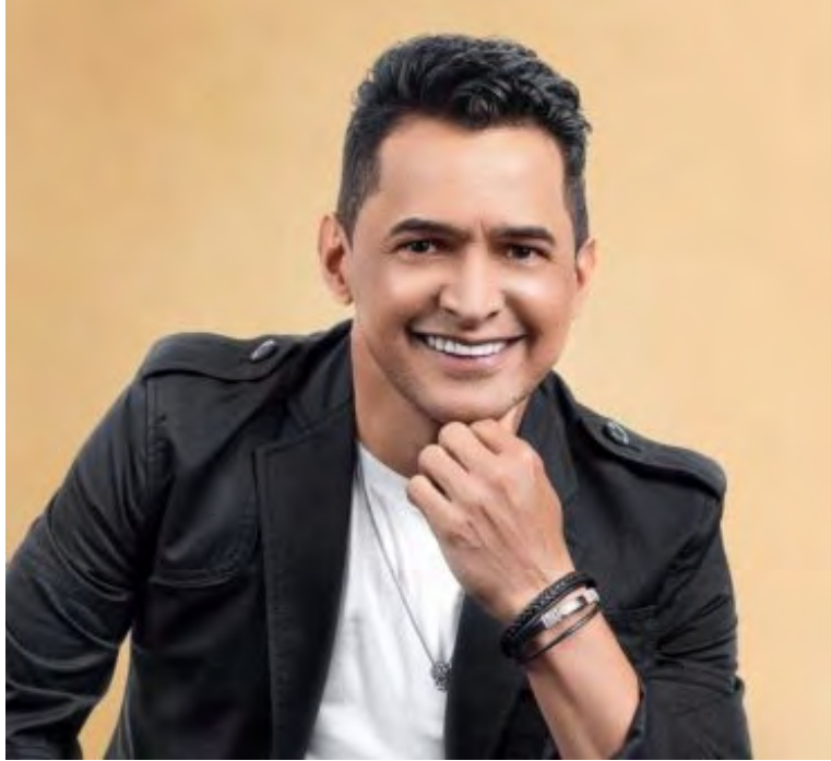
Jorge Celedón, artista.

'Nuestra fiesta' es una canción que imprime energía, motivación con el canto de Jorge Celedón y que tiene un espectacular video musical que se grabó en Cartagena con la participación y el colorido de bailarinas, vendedoras de frutas, rei-