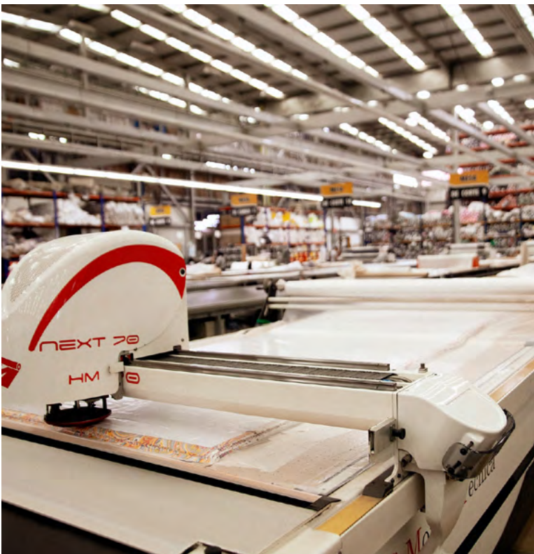
Es un estímulo a la creatividad nacional.

Negocios: podrán participar las empresas legalmente cons-