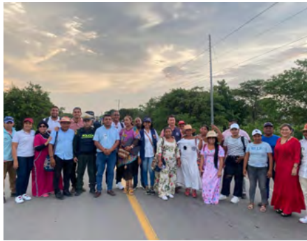
Ayer, jueves 3 de agosto se logró restablecer el tráfico vehicular en la vía que comunica de Riohacha a Maicao.