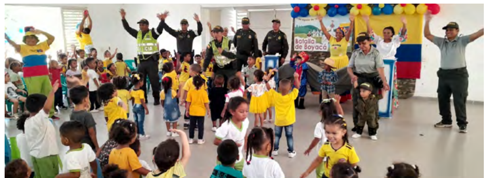
'Juntos por la niñez' es una estrategia implementada por la Policía

El grupo de la Policía de Infancia y Adolescencia viene realizando intervenciones que consisten en la prevención de delitos que se puedan presentar en entornos educativos y familiares en el territorio guajiro.