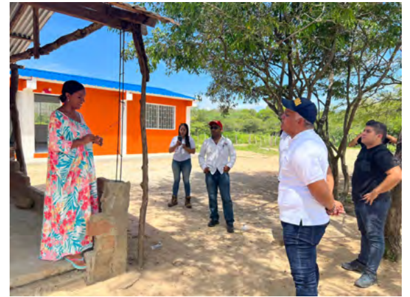
El Secretario de Infraestructura y Servicios Públicos de Riohacha visitó las instalaciones de distintas sedes educativas en área rural del Distrito.