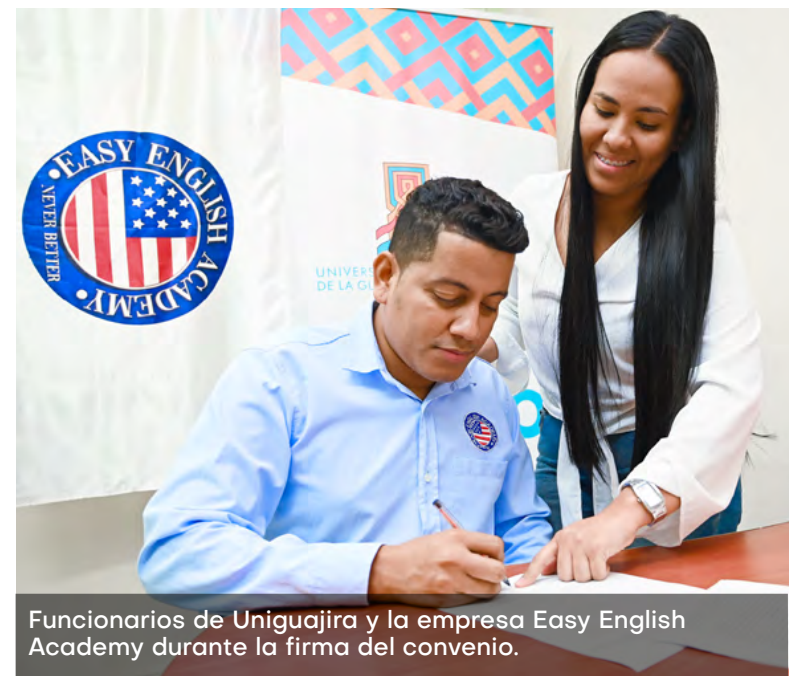
Funcionarios de Uniguajira y la empresa Easy English Academy durante la firma del convenio.

compromiso con el desarrollo local y consolida a la universidad como un agente clave en el progreso y bienestar de la comunidad.