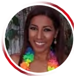
Por Marga Lucena Palacio Brugés

que no podía dormir fin que no entraran todas sus hijas a casa, hasta que me llegó la hora de ser cantinela y, no solo le creo, también me avergüenzo por todas las que le hice, porque este cura sí que se acuerda cuando fue sacristán y bastante que pa-