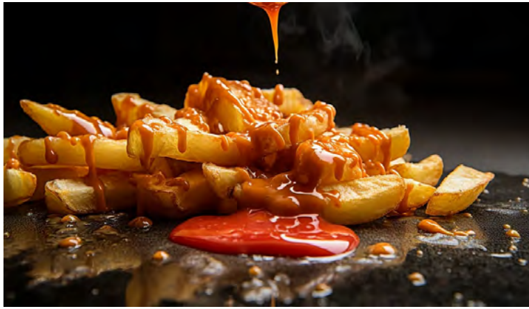
El consumo excesivo de embutidos puede generar hipertensión y también obesidad, diabetes e incluso altos niveles de colesterol

Y si se tiene en cuenta que desde la Sociedad Argentina de Cardiología (SAC) advirtieron