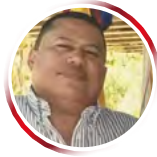
Por Luis Eduardo Acosta Medina

La verdad es que nunca le creía a mi mamá cuando decía