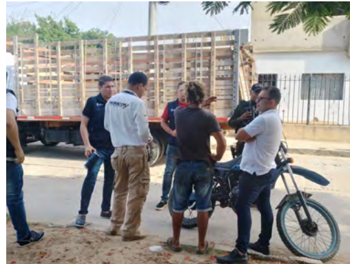
El grupo especial migratorio viene adelantando acciones e intervenciones en la ciudad de Riohacha

Para seguir vinculando a niños, niñas y adolescentes