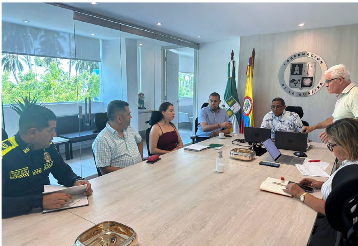
El encuentro se adelantó en las instalaciones de la Gobernación de La Guajira.

Cabe recordar que esta semana la Policía Fiscal y Aduanera lideró un operativo en el sur de La Guajira que dejó la captu-