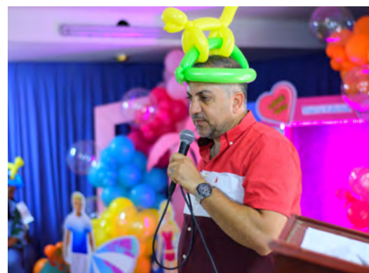
Mohamad Dasuki, alcalde de Maicao.