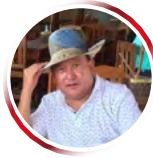
Por Weidler Guerra Curvelo

conocían las distintas artes de pescar, pero carecían de redes. En un tiempo mitológico las redes de pesca se encontraban exclusivamente en poder de