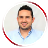
Por Luis Guillermo Baquero Rojas

Las instituciones de La Guajira sufren de debilidad institucional. Estas instituciones, que deberían trabajar incansablemente para asegurar la ejecución adecuada de los recursos y el bienestar de la población, se han convertido en entidades inmersas en la solución de los