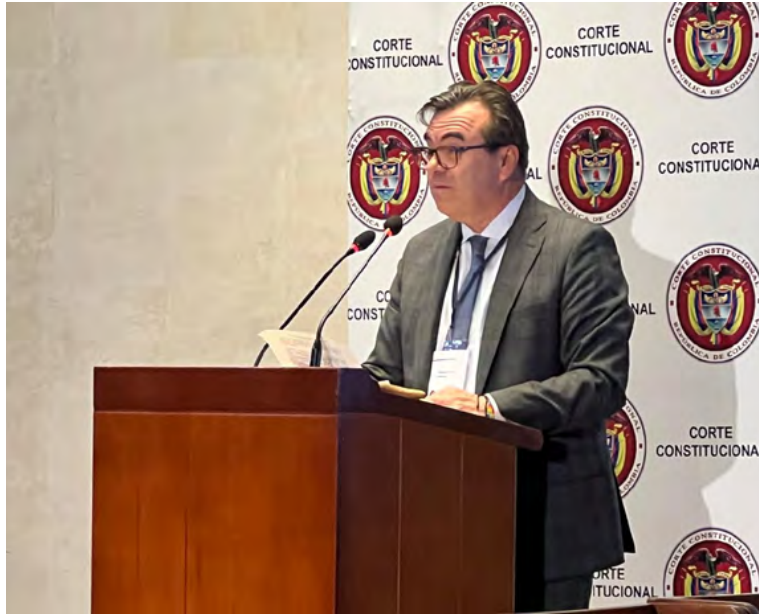
Olmedo López Martínez, director general de la Unidad Nacional para la Gestión del Riesgo de Desastres (UNGRD)

“La UNGRD se centra en la prestación de servicios básicos durante la respuesta y proceso de rehabilitación a la población damnificada para garantizar su accesibilidad y transporte, comunicaciones, salud, saneamiento básico, albergues,