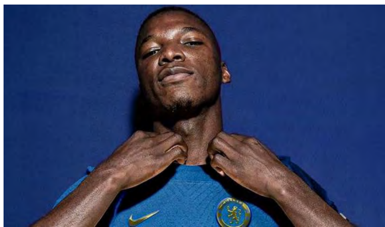
Moisés Caicedo pertenecerá al Chelsea hasta junio del 2031.

Con el conjunto blue como el mejor posicionado para llevarse al futbolista de 21 años, quien precisamente ya intentó incorporarlo en el pasado mercado invernal de 2023 antes de firmar a Enzo Fernández, el