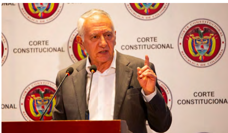
Guillermo Alfonso Jaramillo, ministro de Salud y Protección Social.

Durante su intervención en la Audiencia, el ministro Jaramillo propuso una transformación de las Entidades Promotoras de Salud (EPS) que operan en esta región de Colombia para “que no continúen detrás de las utilidades y pasen del negocio al de-