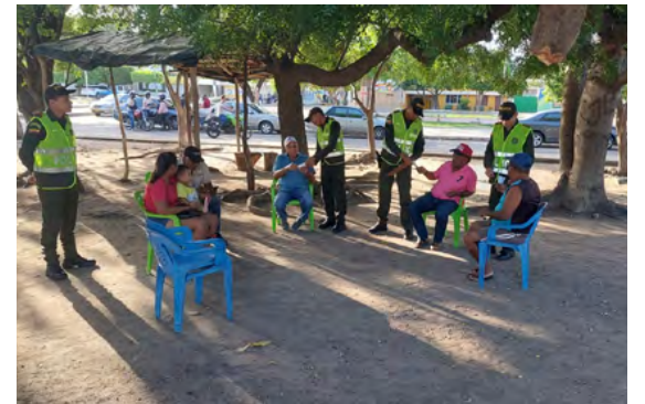
La campaña se realizó en los barrios El Prado y La Esperanza.

“Lo anteriores, con base en el humanismo, la corresponsabilidad y el trabajo cercano a la comunidad”, revelaron.