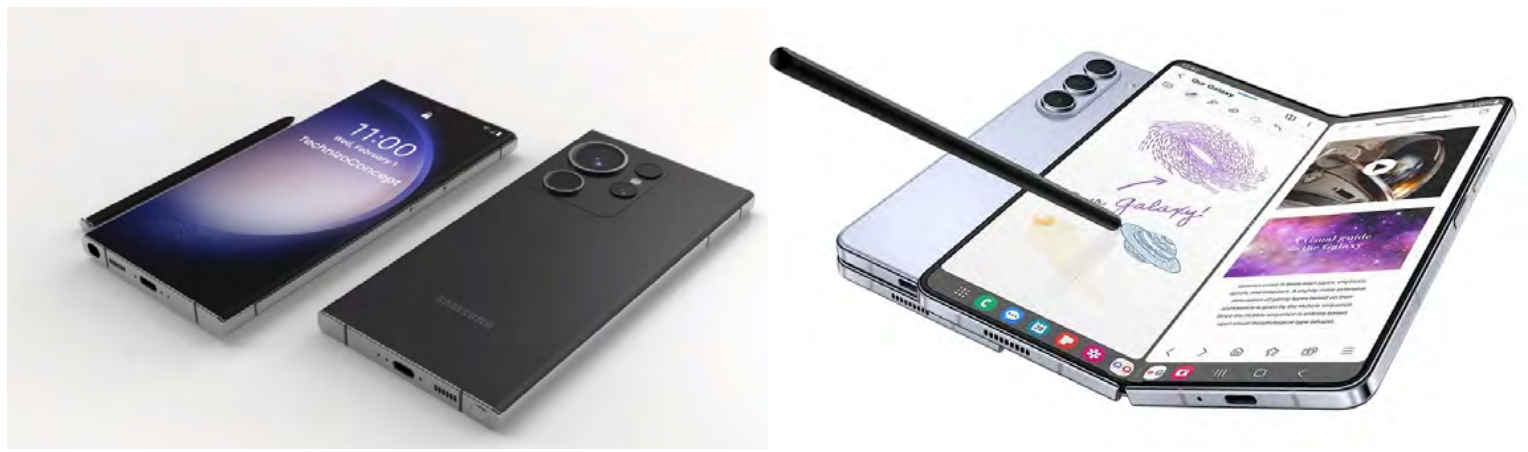
El concepto del Samsung Galaxy S24 Ultra creado por el canal de YouTube 'Technizo Concept'

El Fold5 contará con una pantalla interior Dynamic AMOLED 2X de 7,6 pulgadas, tasa de refresco variable de hasta 120 Hz y mayor brillo, pero sobre todo con una reducción en los bordes laterales, lo que mejorará la experiencia de visualización de contenido.