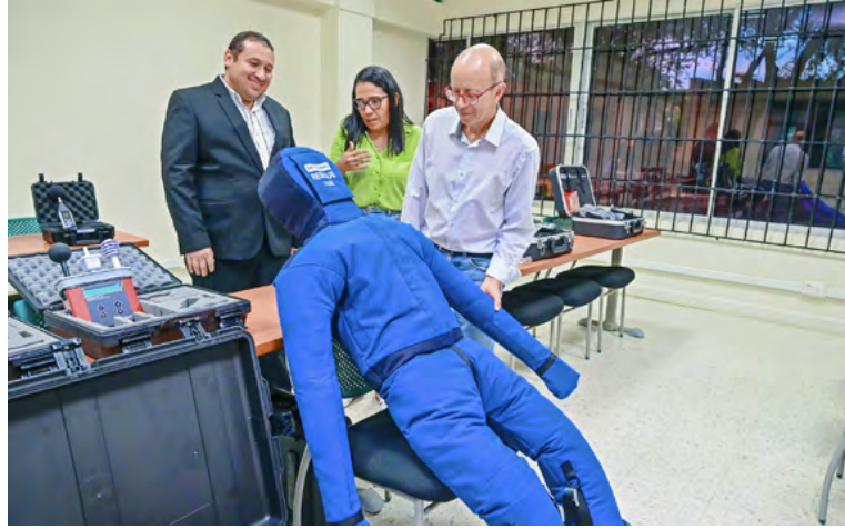
El programa de Arquitectura estaría adscrito a la Facultad de Ingeniería, mientras que el de Seguridad y Salud en el Trabajo, a la Facultad de Ciencias de la Salud.

Del mismo modo, por la ubicación del territorio, se anotó que es importante implementar las energías eólicas y solar y de hidrógeno verde. Al respecto, esta carrera universitaria está dispuesta a que los estudian-