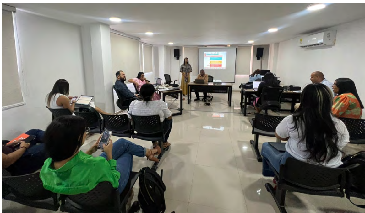
La Universidad de La Guajira busca conseguir los Registros Calificados en distintos Programas

La Universidad de La Guajira informó que sigue recibiendo la visita de pares académicos para la renovación del Registro Calificado para sus programas.