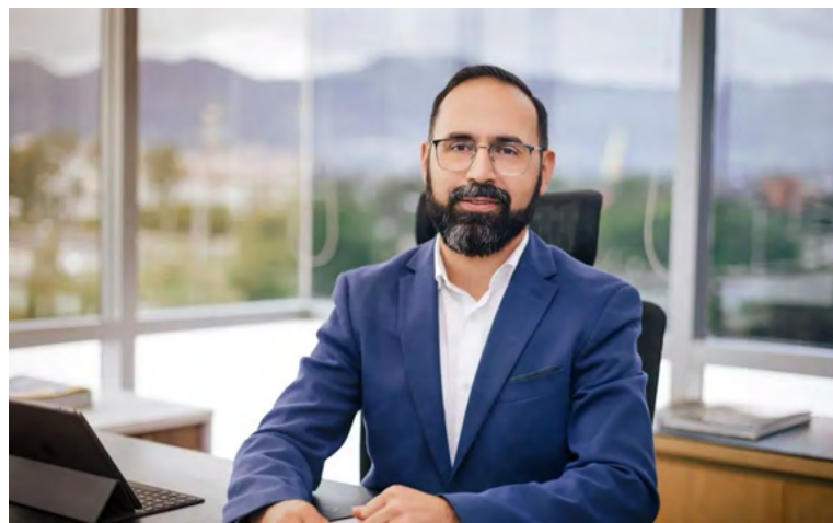
Andrés Camacho, ministro de Minas y Energía.

“Es una decisión vital que transforma las políticas y los mercados energéticos de las próximas décadas, buscando el cuidado de la vida. Somos conscientes del rol que desempeñan