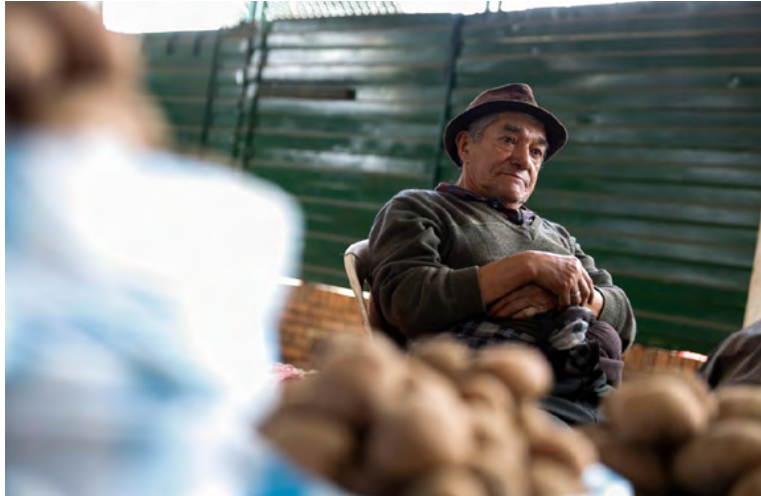
El Gobierno Nacional destinó más de 138.600 millones de pesos para garantizar el pago del ciclo siete del año a los participantes en todo el país.

La transferencia estará disponible hasta el próximo 24 de agosto, en los puntos de pagos de SuperGIROS y su red aliada, en el siguiente enlace está disponible el listado de los puntos