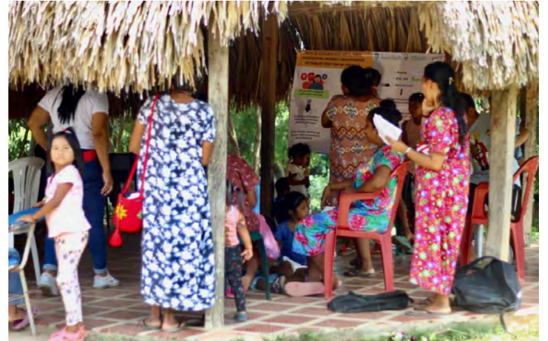
El equipo de profesionales de la Secretaría de Salud del municipio de Dibulla se desplazó hasta el asentamiento indígena Weipiappa y comunidad de Puente Jerez.

oral llegaron a un total de 261 habitantes de la geografía dibujera.