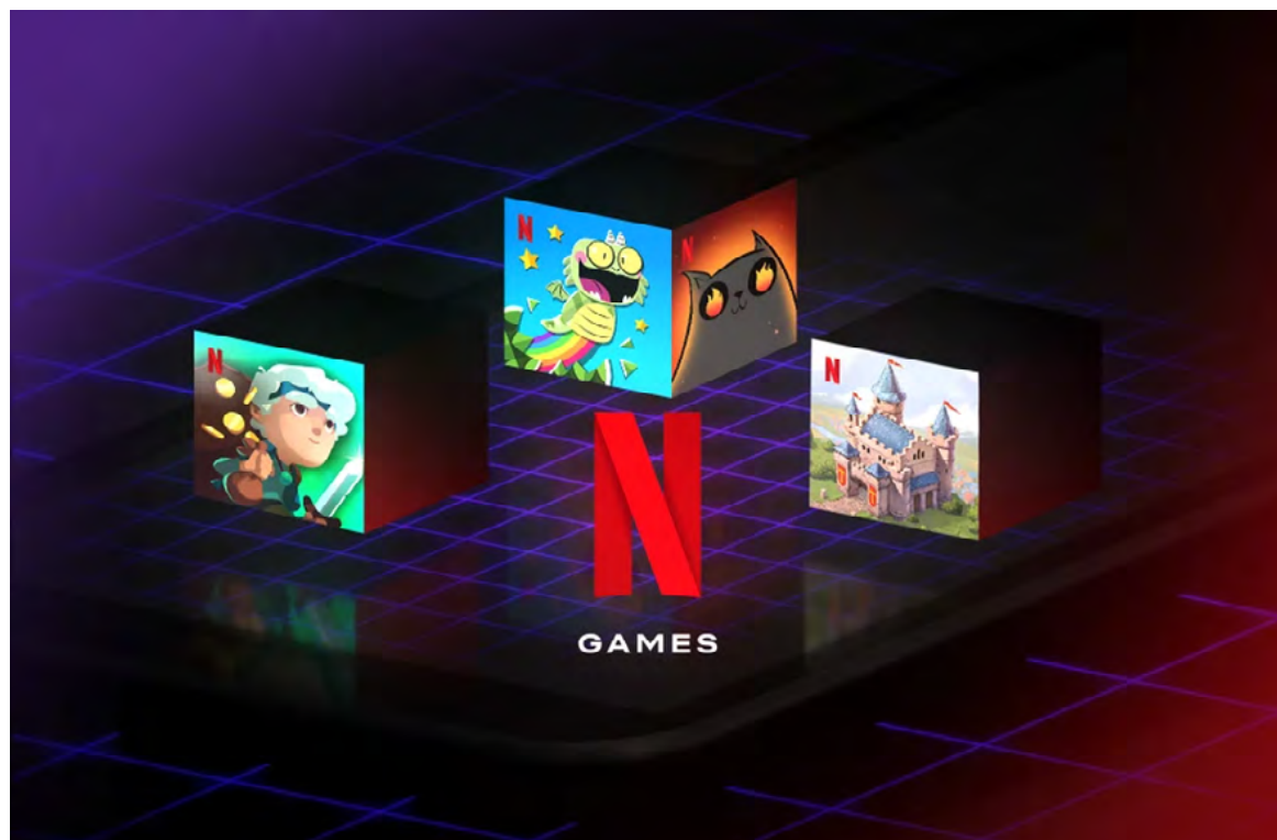
La aplicación se enlazará con el televisor para jugar a través de la nube.

Esto incluirá aquellos videos en los que se encuentren en medio de la reproducción, descargas de contenido previamente realizadas, elementos guardados en Mi Lista, notificaciones relevantes, además de series y películas de la que se hayan visto tráileres previamente.