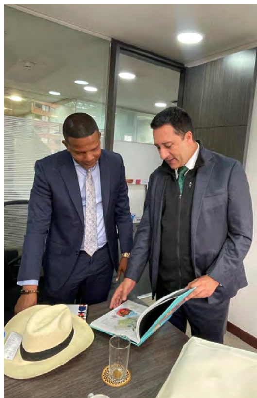
Camilo Iguarán Campo, Viceministro del deporte junto al Viceministro de Turismo, Arturo Ramos.

De esta manera el gobierno nacional, desde estas sectoriales, tienen el propósito de implementar procesos, convenios, entre otro tipo de actividades, enfocadas desde el turismo y el deporte.