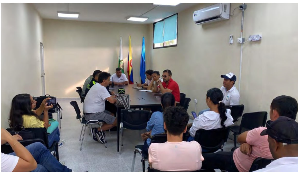
El secretario de gobierno exigió a la Policía Nacional del Distrito se incrementen los controles para evitar este tipo de hechos criminales en la ciudad.

"Realizamos una mesa de trabajo liderada para establecer medidas de seguridad pragmática para la recuperación de la confianza en el centro del distrito, pero con cobertura ampliada a todo el territorio", informó