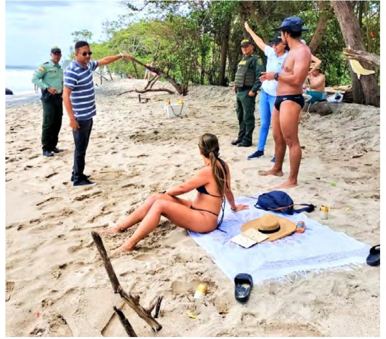
Jornada de prevención en las playas del corregimiento de Palomino.

Finalmente, la institucionalidad confirmó que van a seguir adelantando estas estrategias en Dibulla, corregimientos y veredas para combatir conductas punibles.