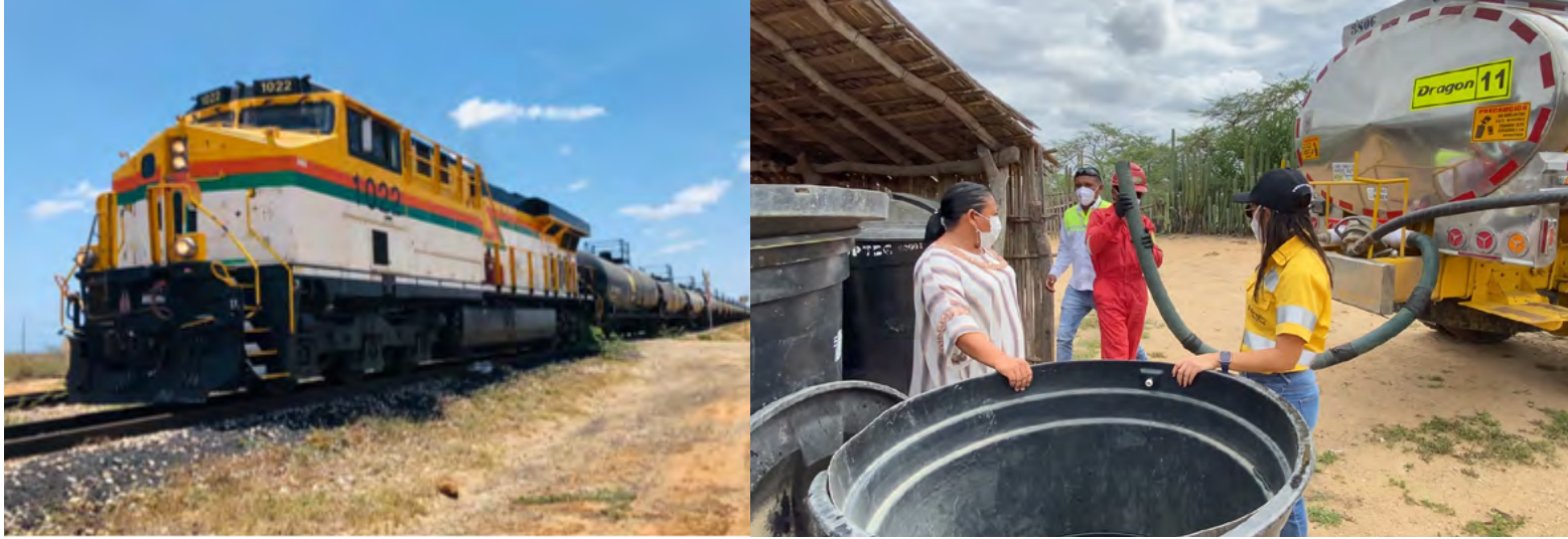
Cerrejón ha entregado más de 27 millones de litros de agua, en el primer semestre de 2023, a 163 comunidades vecinas a su operación en La Guajira

Cerrejón ha entregado más de 27 millones de litros de agua, en el primer semestre de 2023, a 163 comunidades vecinas a su operación en La Guajira en sectores cercanos a la mina, línea férrea y Puerto Bolívar. Desde el 2014, año en que nació la iniciativa del Tren del Agua, la compañía ha entregado más de 278 millones de litros de agua potable.