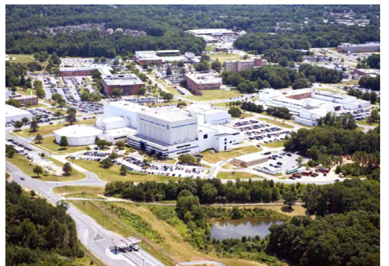
Fotografía cedida por el Centro de Vuelo Espacial Goddard de la NASA de una fotografía aérea de sus instalaciones.