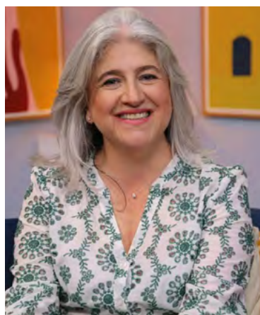
Catalina Velasco Campuzano, ministra de vivienda.

Adicional a estos 4 proyectos, para el departamento de La Guajira se están firmando 6