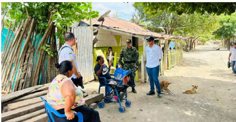
Iniciaron los operativos de las autoridades del Ejército Nacional para garantizar la seguridad y la convivencia en los corregimientos de Riohacha.

Cabe recordar que la ciudadanía pidió la atención de las autoridades, además que la Defensoría del Pueblo alertó sobre hechos delictivos en esta zona de la capital de La Guajira. Además, en esta zona fueron halladas varias personas muertas, las cuales fueron arrojadas en sacos.