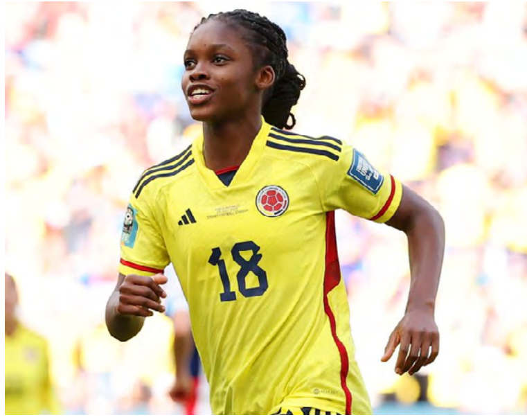
Linda Caicedo, jugadora profesional de fútbol.

Seguir aprendiendo es una de sus principales consignas, no se mete presión y solo quiere seguir haciendo feliz al país a