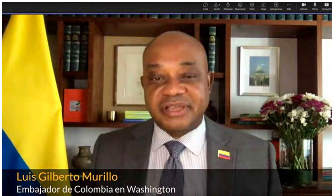
Luis Gilberto Murillo Embajador de Colombia en Washington

có el Embajador, y precisó que esos recursos permiten "programas de desarrollo que son muy importantes para el país", en sectores como desarrollo rural, comunidades campesinas, afrodescendientes y tecnología.