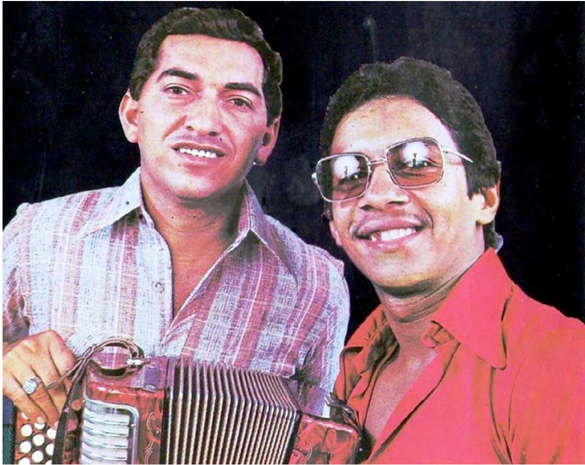
Elberto 'El Debe' López y Diomedes Díaz, dos grandes amigos del folclor vallenato.