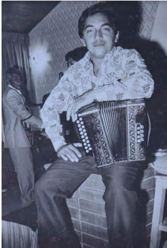
Elberto López Gutiérrez, Rey Vallenato en el año 1980.