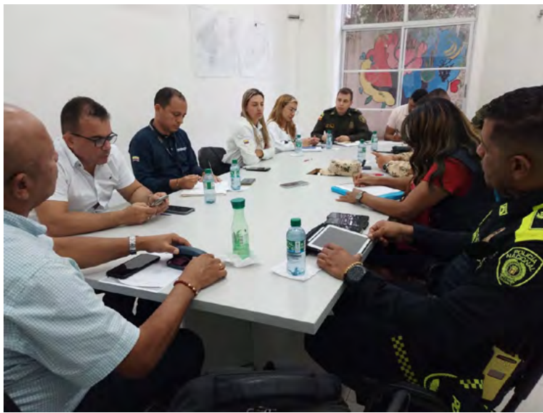
Consejo de seguridad en relación a los últimos hechos registrados en la ciudad.

Asimismo, las autoridades presentes en el consejo de seguridad confirmaron que esta es nueva modalidad de robo en la vía, donde tiran tachuelas para lograr en 100 o 200 metros la