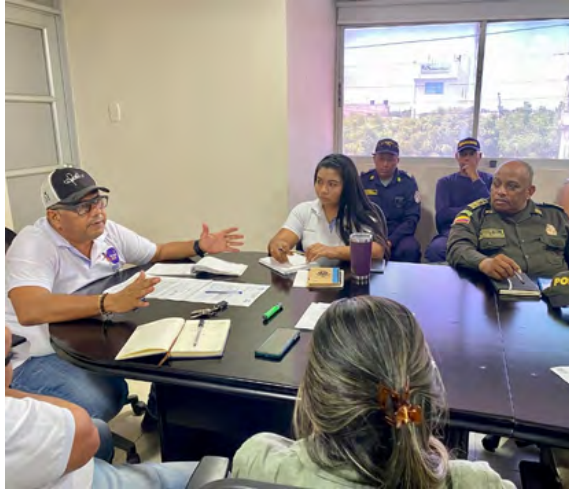
Durante la reunión se socializó el Decreto 1085 de 2023, el cuál oficializa la emergencia económica, social y ecología durante un periodo de 30 días.

Las autoridades informaron que "esto se viene trabajando en conjunto y con esfuerzo, resaltando que se han ido ejecu-