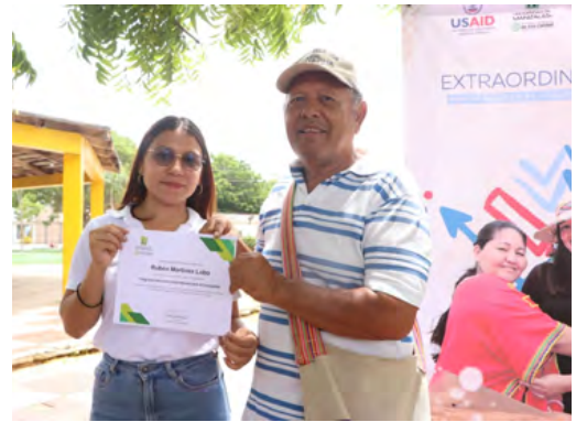
Durante este desarrollo de capacidades se certificaron 26 personas en el programa educativo.