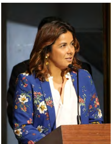
Jhenifer Mojica Flórez, ministra de Agricultura.

La ministra de Agricultura, Jhenifer Mojica Flórez, se pronunció en relación a la situación de La Guajira sobre la inseguridad alimentaria, entregando un panorama muy oscuro.