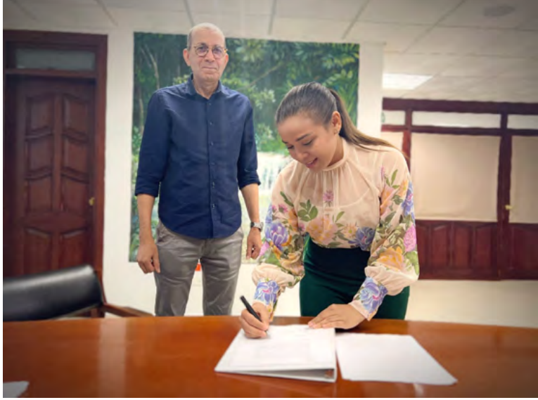
La gobernadora Diala Wilches Cortina, durante la firma del memorando de entendimiento.

Un memorando de entendimiento para implementar estrategias de desarrollo sostenible que contribuyan a planificar, ordenar y gestionar el ecoturismo, etnoturismo y agroturismo en La Guajira, fue firmado entre la Corporación Autónoma Regional de