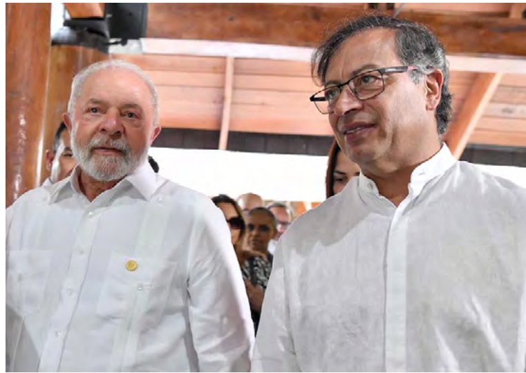
Presidentes Petro y Lula da Silva en la Universidad Nacional sede Leticia Amazonas.

También, el presidente Petro informó a Lula da Silva sobre