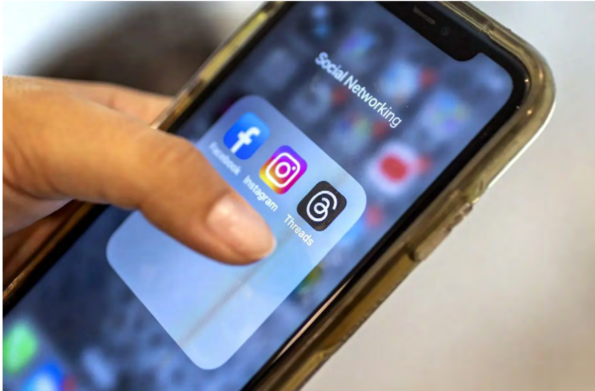
Threads ha irrumpido con fuerza en el mundo de las redes sociales.

• Según los datos de Sensor Tower, Threads es ac-