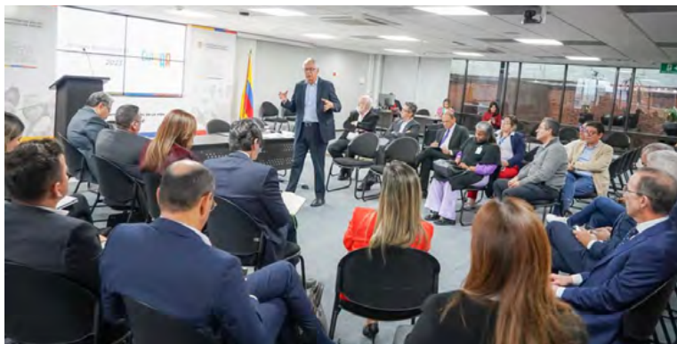
Guillermo Jaramillo, ministro de Salud.

rio reveló que se busca generar medidas para atender sin ningún contratiempo, a la población.