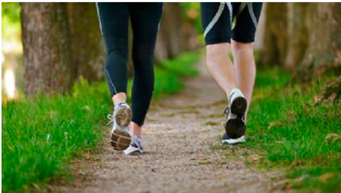
Los investigadores vieron que una caminata leve atenúa la glucosa posprandial y la insulina.

En el estudio, los investigadores compararon los efectos de una caminata ligera tras la comida frente al impacto de permanecer de pie. Y vieron que, aunque la segunda opción podría mejorar los niveles de glucosa posprandial, la primera era más eficaz. Quedarse de pie provocaba una reducción de un 9,5%, mientras que caminar, de un 17%. “Los efectos serían aún mejores si, además de pasear, se incorporara la práctica regu-