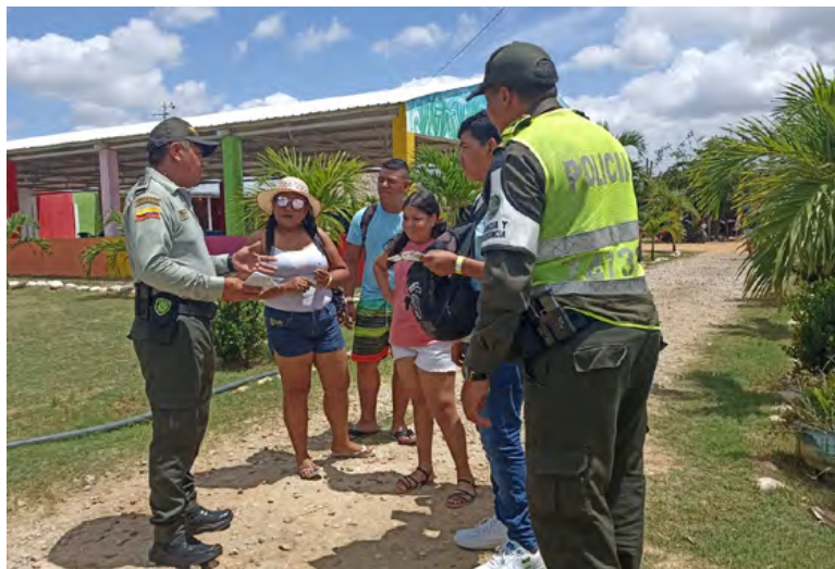
Las autoridades siguen trabajando para prevenir delitos en zonas turísticas del territorio guajiro

La Policía de Turismo por su parte confirmó que estará adelantando este tipo de acciones en otros municipios en el sur de La Guajira, donde hay masiva presencia de turistas y también realizando recomendaciones a los prestadores de servicio de turismo.