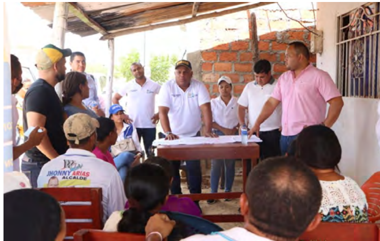
Este proyecto asegurará la ampliación de la cobertura del servicio de energía eléctrica para 150 hogares en la zona rural de Camarones,

1.000 millones serán invertidos en este corregimiento de la zona rural de Riohacha.