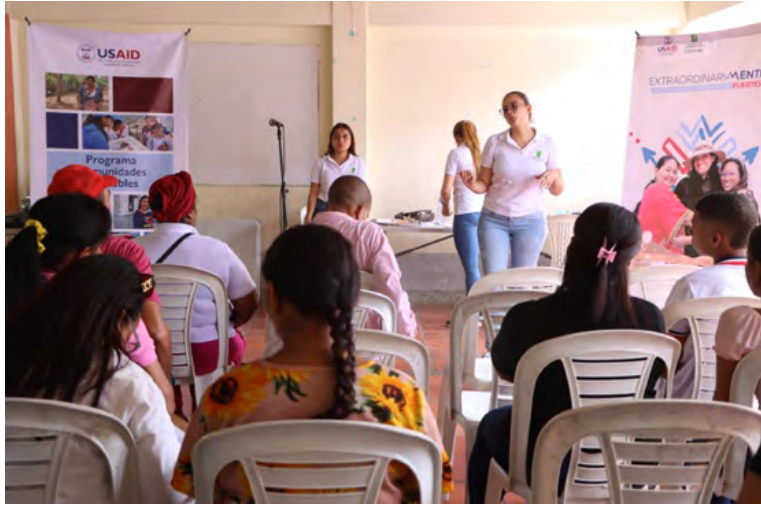
El objetivo de esta capacitación es el de mejorar la capacidad instalada para abordar la problemática de salud mental en el Distrito.

“Esta capacitación ha sido de gran importancia y la valoramos porque se trata de apoyar a las personas, a la vida para