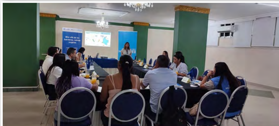
Desarrollo de desayuno empresarial-Maicao