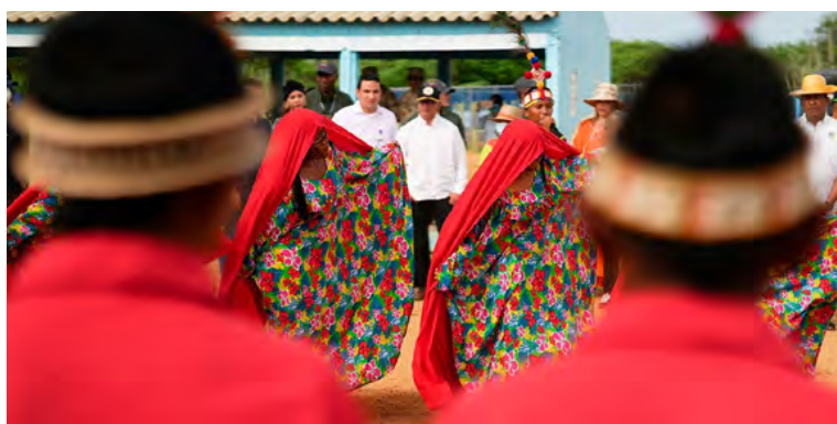
Gustavo Petro, presidente de Colombia, quien arriba este lunes a despachar desde La Guajira.

En la mañana del martes 27 se realizará en Nazareth, corregimiento de la Alta Guajira perteneciente a Uribia, el Diálogo Social de Autoridades (palabreos wayuu), donde se firmará el decreto de la Comisión de la