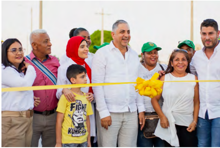
Inauguración del anillo vía del barrio Los Comuneros en Maicao.

“Hoy estamos inaugurando esta imponente avenida que refleja lo que nosotros hemos comprometido en nuestra vida pública, el respeto por los recursos públicos que son sagrados.