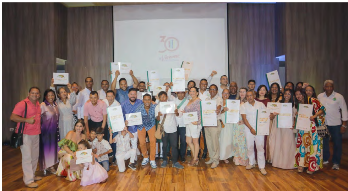
La entidad giró 69 millones de pesos en premios a los ganadores de primer y segundo lugar en las 14 categorías