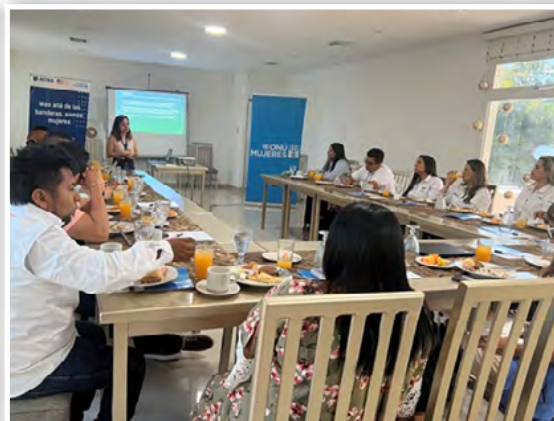
Desarrollo del primer desayuno empresarial “Mas allá de las banderas, somos mujeres”

“Mas allá de las banderas, somos mujeres” tiene como objetivo fortalecer el acceso a servicios de protección e inclusión económicas de las Mujeres migrantes y de comunidades de acogida en Colombia.