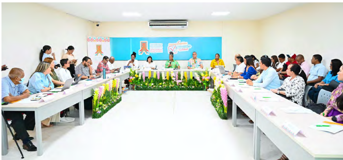
La sesión del Consejo Superior se realizó de manera ampliada.