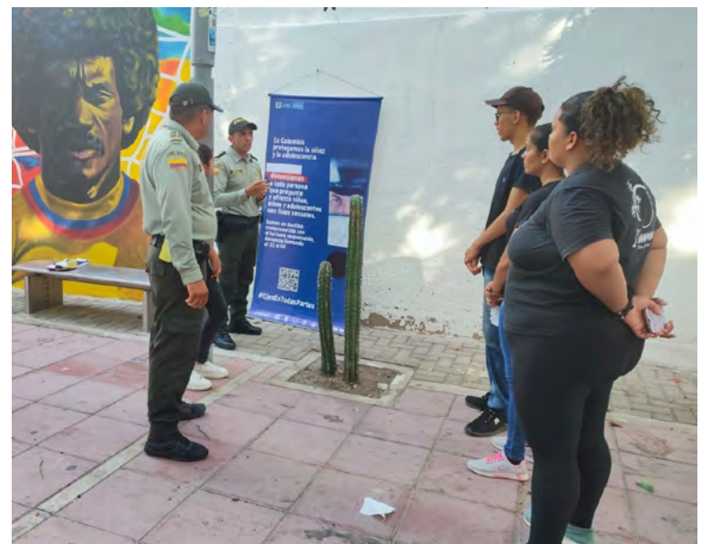
Jornada de prevención del delito de explotación sexual y comercial a niños, niñas y adolescentes.

Kiosquitos, sector de Yo Amo a Riohacha, la Circunvalar, avenida del Riito hacia Villa Fátima, alrededores del Centro Cultural y el muelle.