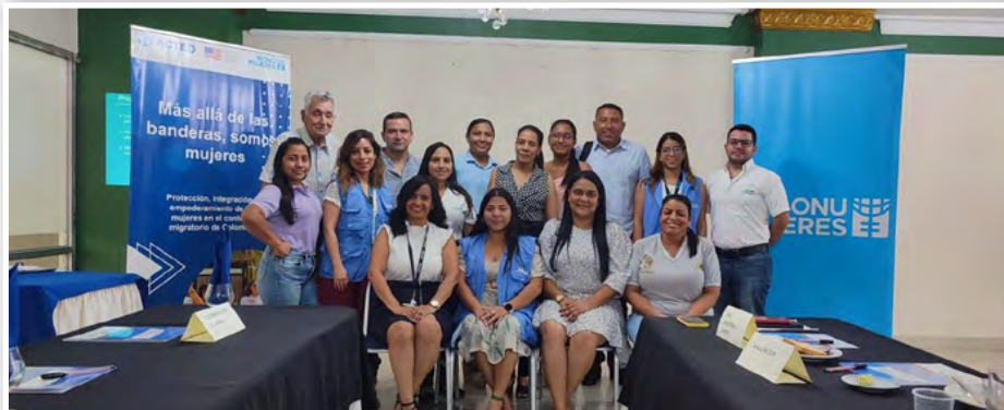
Grupo de empresarios del municipio de Maicao