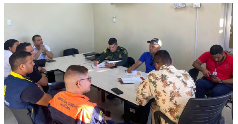
Autoridades del Distrito de Riohacha iniciaron las estrategias enfocadas en garantizar la seguridad durante los eventos del Festival Francisco El Hombre

También se realizarán eventos de salud a nivel nacional, la celebración del cumpleaños de La Guajira, el encuentro de varios gobernadores con la RAP, entre otros eventos en la capital de La Guajira.