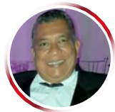
Por Fabio Olea Massa (Negrindio)

El Titanic fue botado al mar en 1912 y para su época fue considerado el barco de pasajeros más grande y lujoso. En su viaje inaugural de Southampton a Nueva York, la noche del 14 de abril de 2012 naufragó en el Atlántico norte llevándose consigo al fondo del mar a 1496 almas. Algunos de los hombres más ricos del mundo y prominentes miembros de la aristocracia viajaban en las cabinas más costosas de la clase uno del trasatlántico,