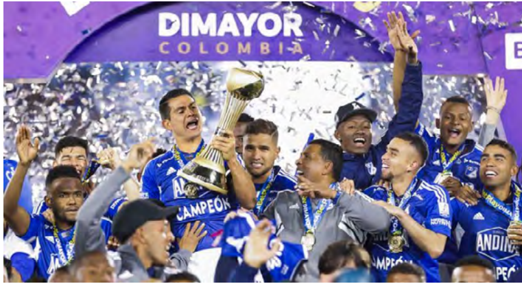
Millonarios levanta su liga número 16