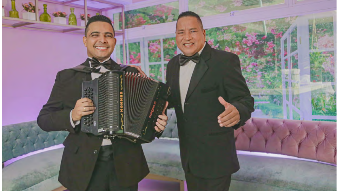
Las canciones ya se encuentran disponibles en todas las plataformas digitales.