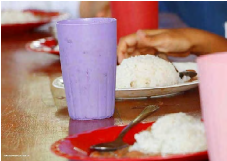
Algunas instituciones educativas no cumplen los requerimientos técnicos exigidos en áreas como manejo higiénico sanitario, saneamiento básico y dotación.