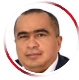
Por Arcesio Romero Pérez

Sus calendarios son testigos del trasegar; y sus "sencillos" compañeros -días, horas y segundos- son jueces del presente. Y a pesar de poseer identidad y valoración propia en cada individuo, su divisibilidad no puede ser medida como transacción en ningún mercado, ni puede ser sujeto de acuñamiento o atesoramiento; solo, en pocas ocasiones, se considera símbolo de ahorro y manifiesto de riqueza material o espiritual. En fin, o en breve como diría en afanoso, el tiempo no se puede monetizar, no es de considerarse medida de valor como su compañero el dinero. Sin embargo, y a expensas de revelar una dependencia manifiesta, el dinero si se rige por el paso del tiempo y su expresiva musicalidad. Una musi-