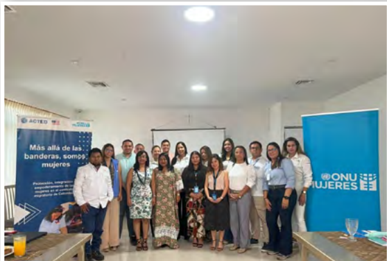
Grupo de empresarios de Riohacha- Acompañamiento de la ANDI