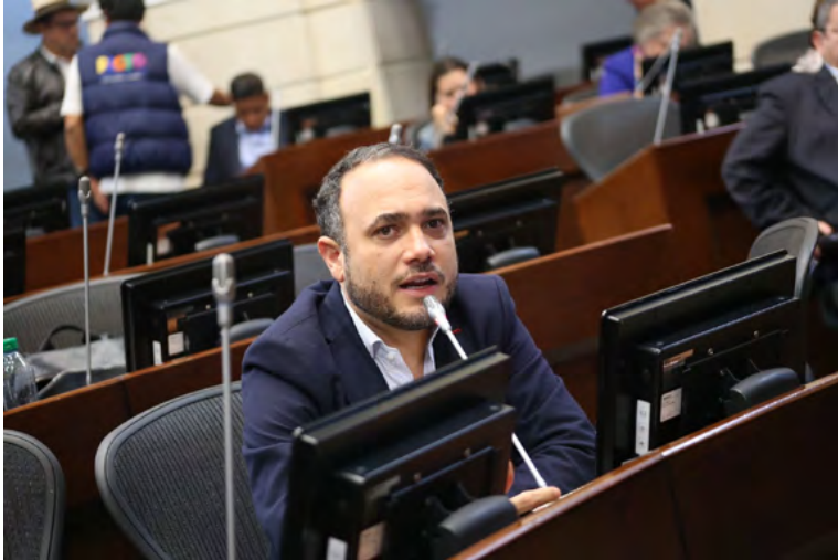
Senador guajiro Alfredo Deluque Zuleta.

“Desde el conocimiento de nuestras necesidades y de los muchos años de batallas que hemos dado para traer soluciones a La Guajira, le pido señor Presidente, que en su visita priorice los siguientes temas, que no