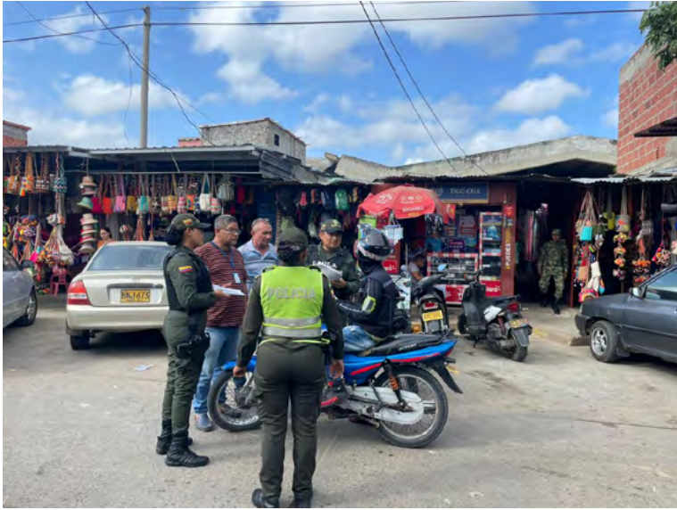
Un balance positivo y satisfactorio se registró en todo el departamento.

toridades que hubo un 80% en disminución de los casos de riñas, 85% reducción de violencia intrafamiliar, un 90% menos en las lesiones personales en comparación con el mismo fin de semana del año anterior.