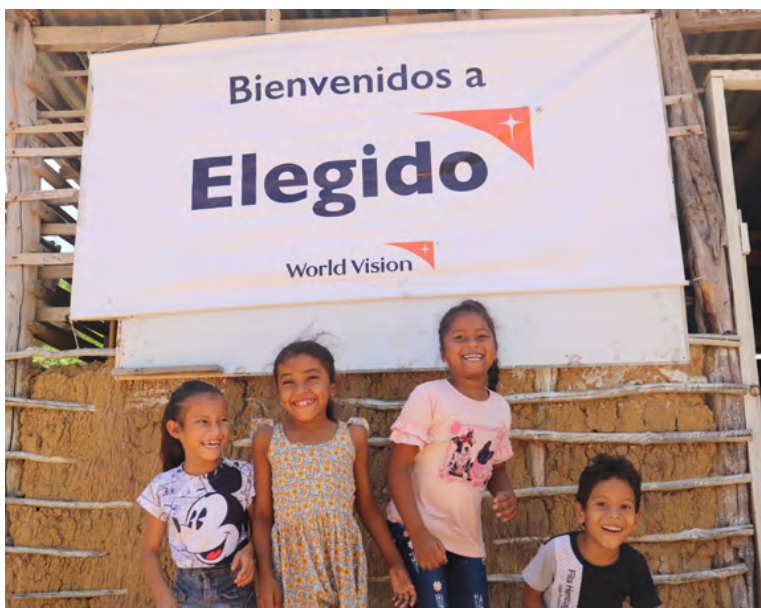
Una nueva experiencia de apadrinamiento donde el poder de elegir, lo tiene la niñez colombiana

cinadora en la página web de World Vision Colombia, el envío de una foto con el que una niña o niño podrá elegir a su nuevo padrino y un correo de confirma-