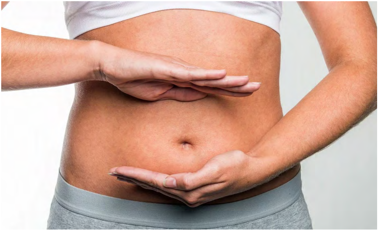
El microbioma de una persona sana está formado por diferentes microbios que coexisten pacíficamente. La mayoría está en el intestino

Para el estudio publicado ahora en Nature Communications, los investigadores examinaron muestras de heces de 75 pacientes con cáncer y descubrieron que ciertas especies bacterianas aparecen siempre