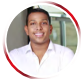
Por Jaime Alfredo Móvil

Existe un desconocimiento total por parte de la mayoría de los candidatos políticos, quienes ven como única posibilidad la consecución de votos mediante cálculos transaccionales para que el elector favorezca a su favor; es decir, el dinero se como forma de conquistar