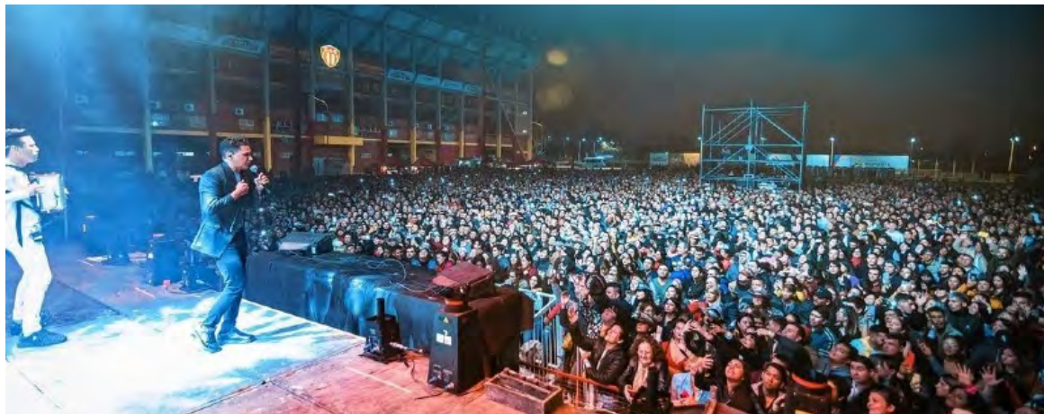
Jorge Celedón sigue abanderando el vallenato internacional en los mejores escenarios del mundo.