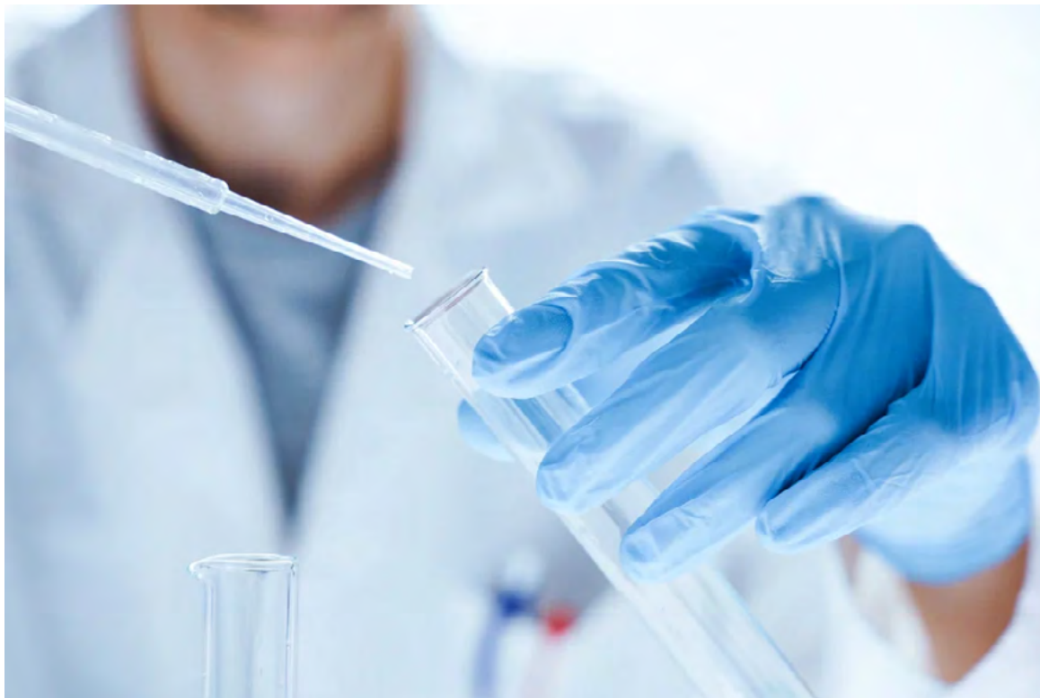
El estudio se hizo a partir de pacientes con cáncer. Esperan realizar otra investigación con personas sanas.

en mayor número cuando la cantidad de hongos del género Candida es también elevada.