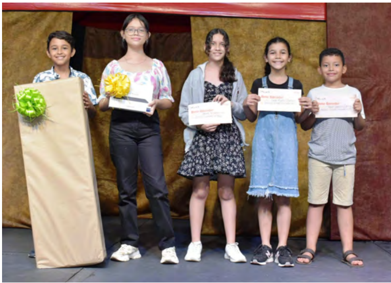
Ganadores del concurso 'Los niños pintan el Festival Vallenato' que promueve desde hace 12 años la Fundación Festival de la Leyenda Vallenata

En el Centro Comercial Mayales Plaza de Valledupar se cumplió la premiación de los cinco estudiantes ganadores del concurso ‘Los niños pintan el Festival Vallenato’, evento organizado desde hace 12 años por la Fundación Festival de la Leyenda Vallenata.