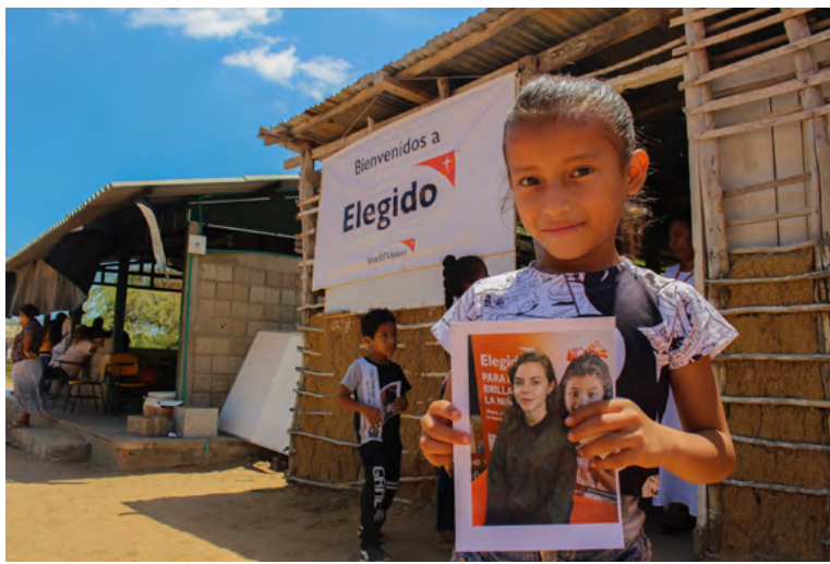
Elegido, el programa de patrocinio para la niñez en La Guajira.

Esta acción inicia con el registro del patrocinador o patro-