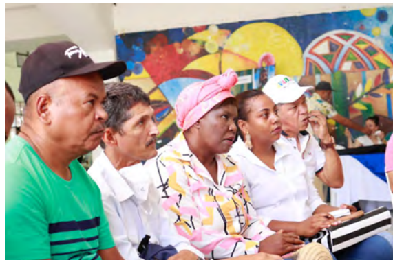
El evento se desarrolló en las instalaciones del Liceo Almirante Padilla de la capital de La Guajira.