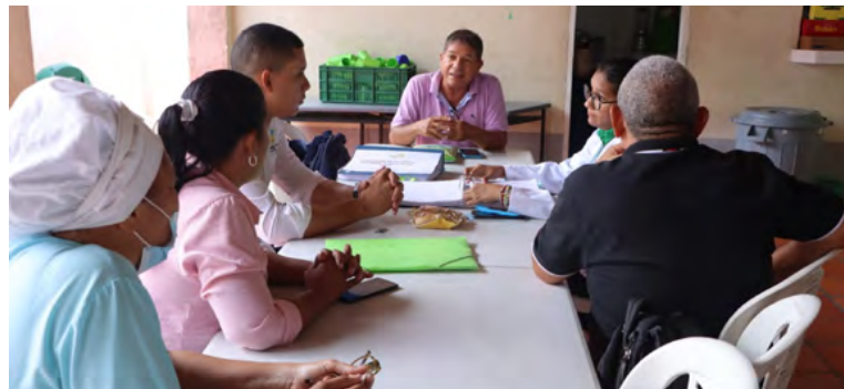
Inspección de verificación al PAE realizada por la Secretaría de Educación de Riohacha.

“Este ha sido el PAE en la sede 12 de octubre del IPC en el distrito de Riohacha, en lo corrido de la semana. Por ello es necesario que el PAE deje de ser un supuesto complemento y se convierta en un menú completo, que garantice los requerimientos nutricionales de nuestros