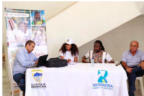
El evento se desarrolló en las instalaciones del Liceo Almirante Padilla de la capital de La Guajira.