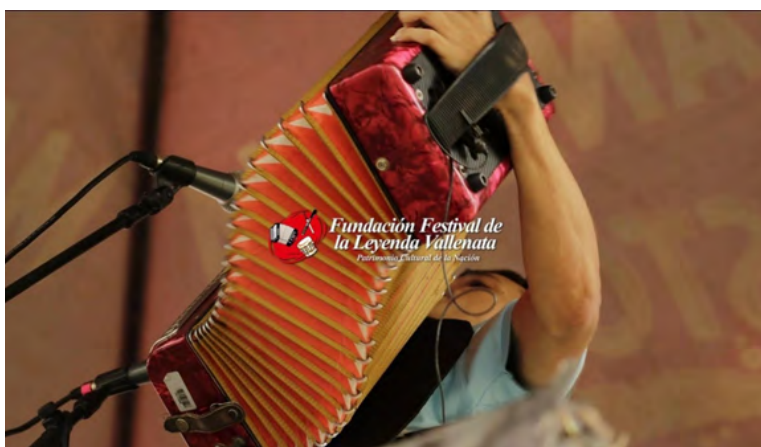
Gran balance de inscritos para el 56 Festival de la Leyenda Vallenata.

Respecto a las canciones que serán seleccionadas entre las 229 inscritas, la Fundación Festival de la Leyenda Vallenata indica que en los próximos días estarán haciendo el respectivo anuncio, luego de cumplido el trabajo por el jurado que tendrá esa misión.