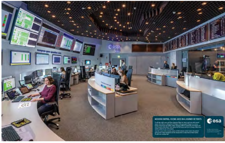
So de Operaciones Espaciales de la Agencia Espacial Europea en Alemania.

Ahora, como responsable de operaciones de la misión Juice,