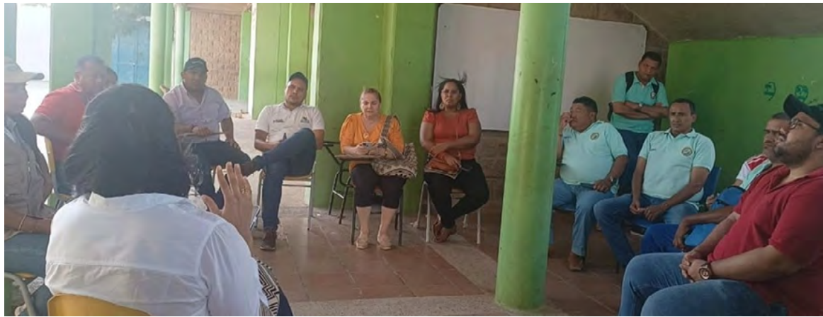
Encuentro con las directivas de la institución educativa del Eusebio Septimio Mary en relación a las denuncias por el pésimo estado del claustro educativo.

Las autoridades del municipio de Manaure informaron que realizaron un encuentro con las directivas de la institución educativa del Eusebio Septimio Mary en relación a las denuncias por el pésimo estado del claustro educativo.