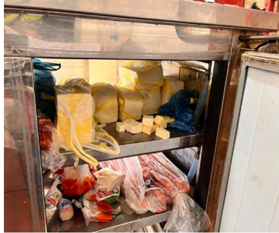
Se le recomendó a la ciudadanía para que realice la compra de lácteos en lugares confiables.

la mañana y tarde del día 11 de abril, se le hizo el acompañamiento y se adelantó el respectivo proceso que se implementa en estas situaciones. Se tomó la muestra para establecer la causa de esta enfermedad ya que varios de los pacientes asegu-