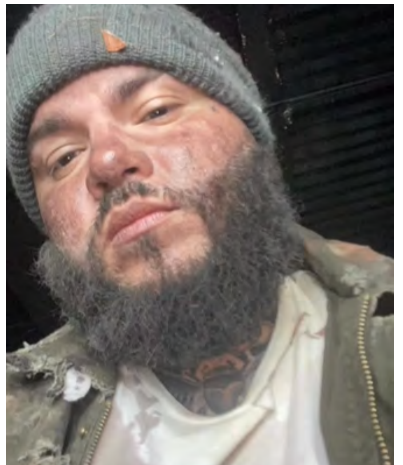
Farruko dice se sentía sucio antes ver a Jesús a través del amor.

Farruko cuestionó si sus seguidores lo reconocerían y lo tratarían de la misma manera si lo vieran en una situación menos glamorosa, y muchos de sus seguidores aplaudieron su sinceridad.