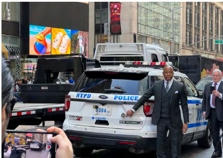
El alcalde de Nueva York, Eric Adams, señala a la herramienta que permite rastrear un vehículo en tiempo real llamada "StarChase GPS", hoy en Times Square, Nueva York.