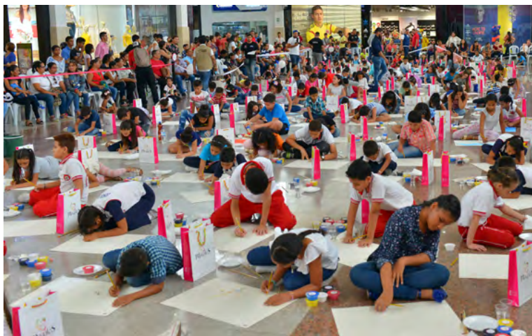
El concurso de Pintura Infantil llega a sus 13 años de unión y creatividad estudiantil alrededor del Festival Vallenato.

estar presentes en el homenaje al juglar Luis Enrique Martínez Argote, quien puso la nota más alta en el folclor”.