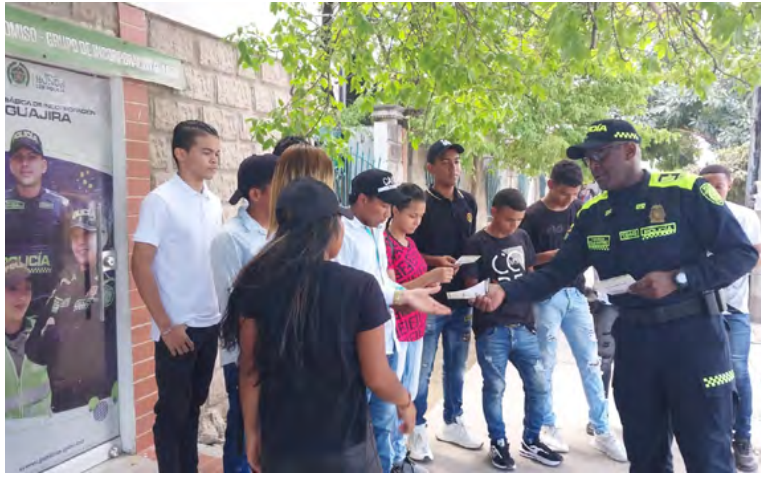
Desde ayer 12 de abril hasta el 10 de mayo del año en curso, estará abierta la convocatoria para ser Auxiliar de Policía.

lombiano. Mayor de edad y hasta faltando un (1) día para cumplir los 24 años de edad, al momento de ingresar al servicio militar o los que determine la ley. Soltero y sin hijos. No haber