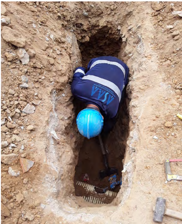
Desde las 10:00 de la mañana el servicio de agua en el Centro de Riohacha estará suspendido.