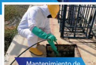
Mantenimiento de pozos sépticos