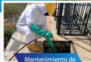
Mantenimiento de pozos sépticos