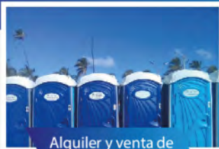
Alquiler y venta de baños portátiles