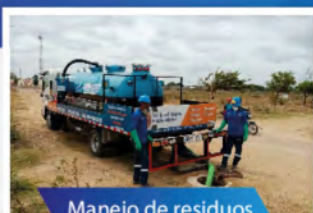
Manejo de residuos sólidos y líquidos