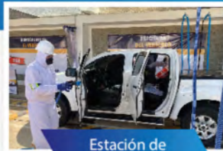
Estación de desinfección