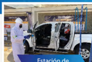
Estación de desinfección